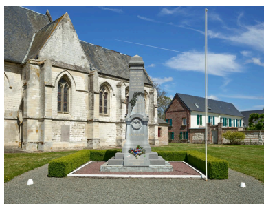
Vue générale depuis le sud-ouest. IVR22_20228000108NUCA