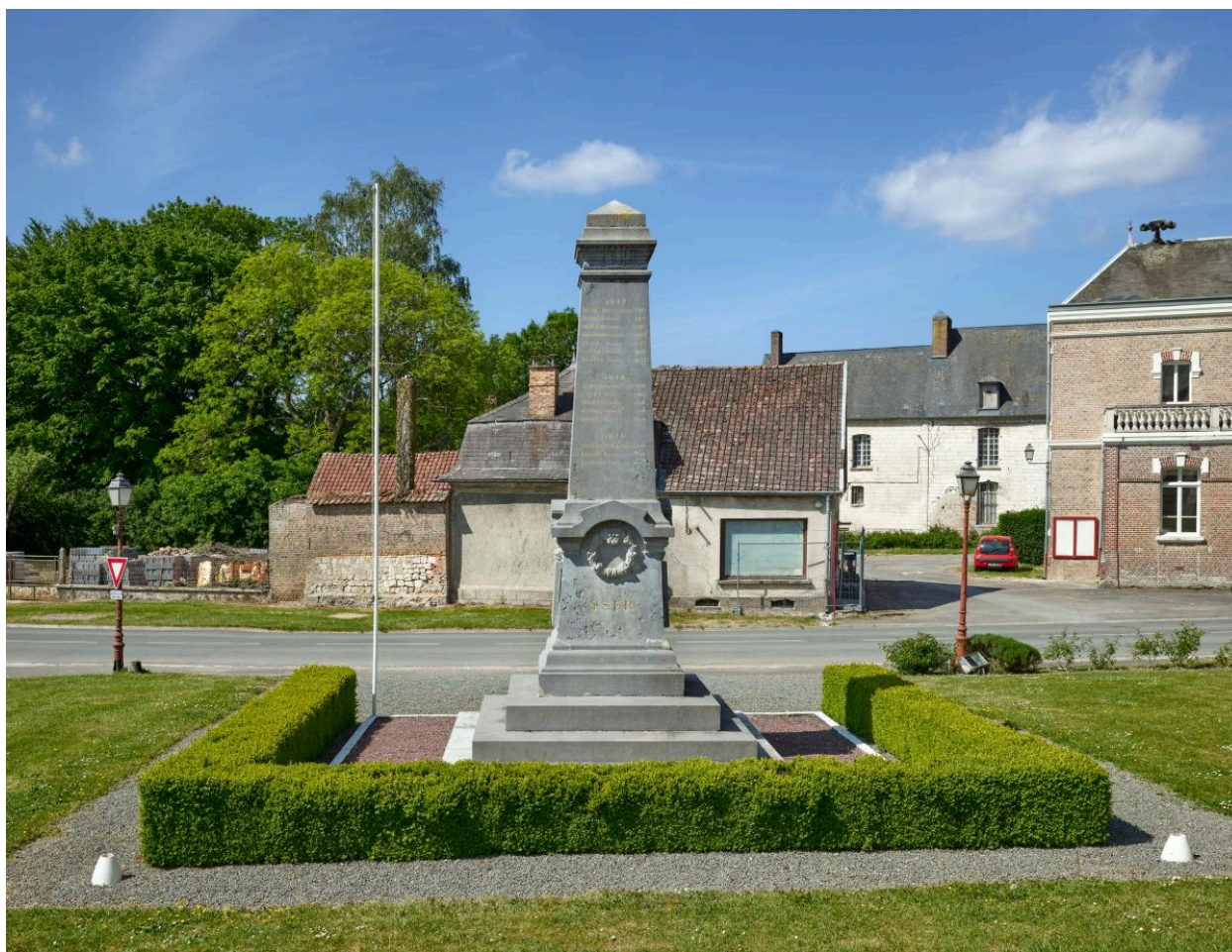
Vue générale depuis le nord-est.