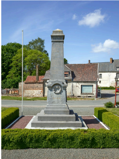
Vue générale depuis le nord-est. IVR22_20228000114NUCA