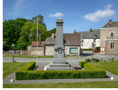
Vue générale depuis le nord-est.