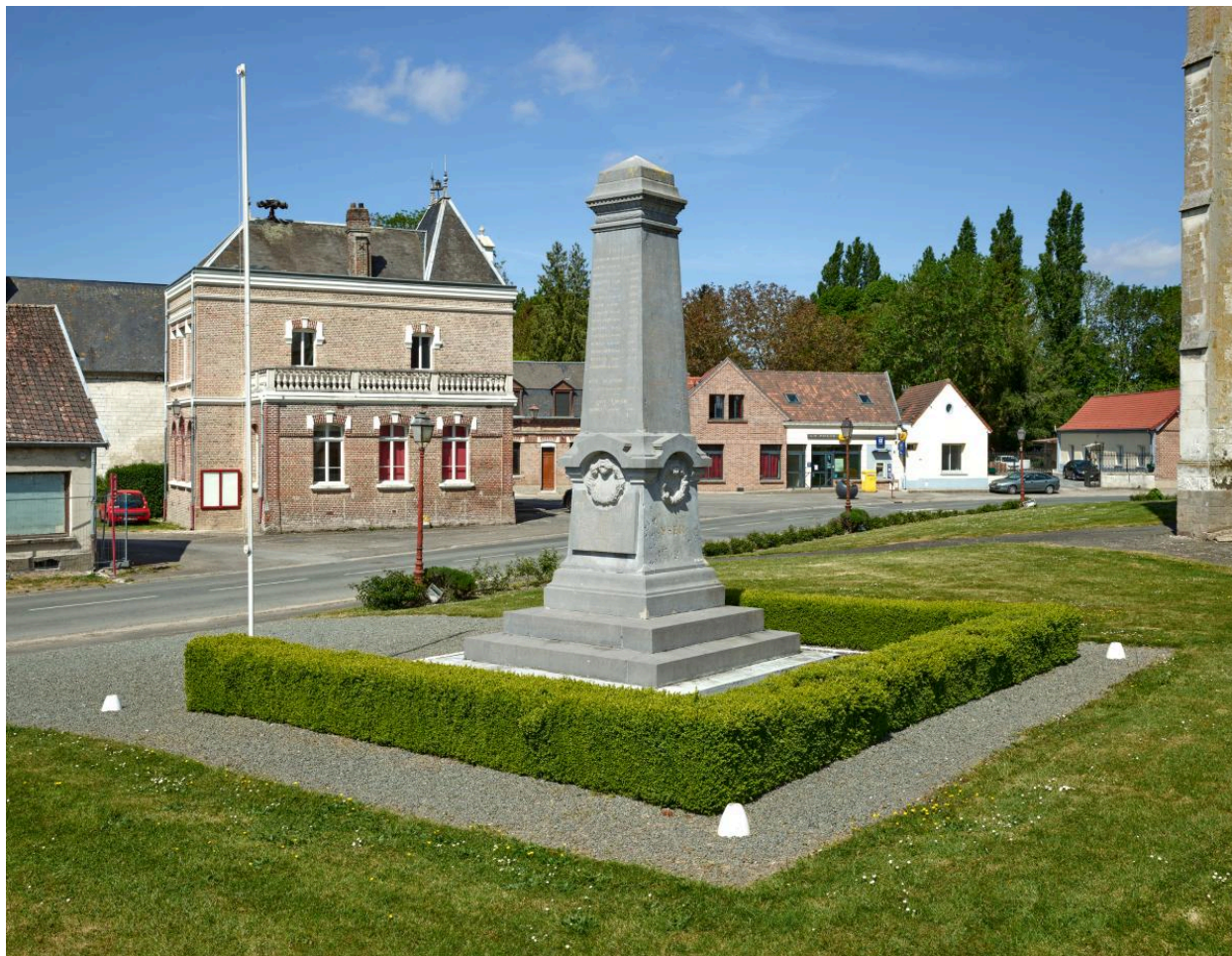
Vue générale de trois quarts depuis l'est.