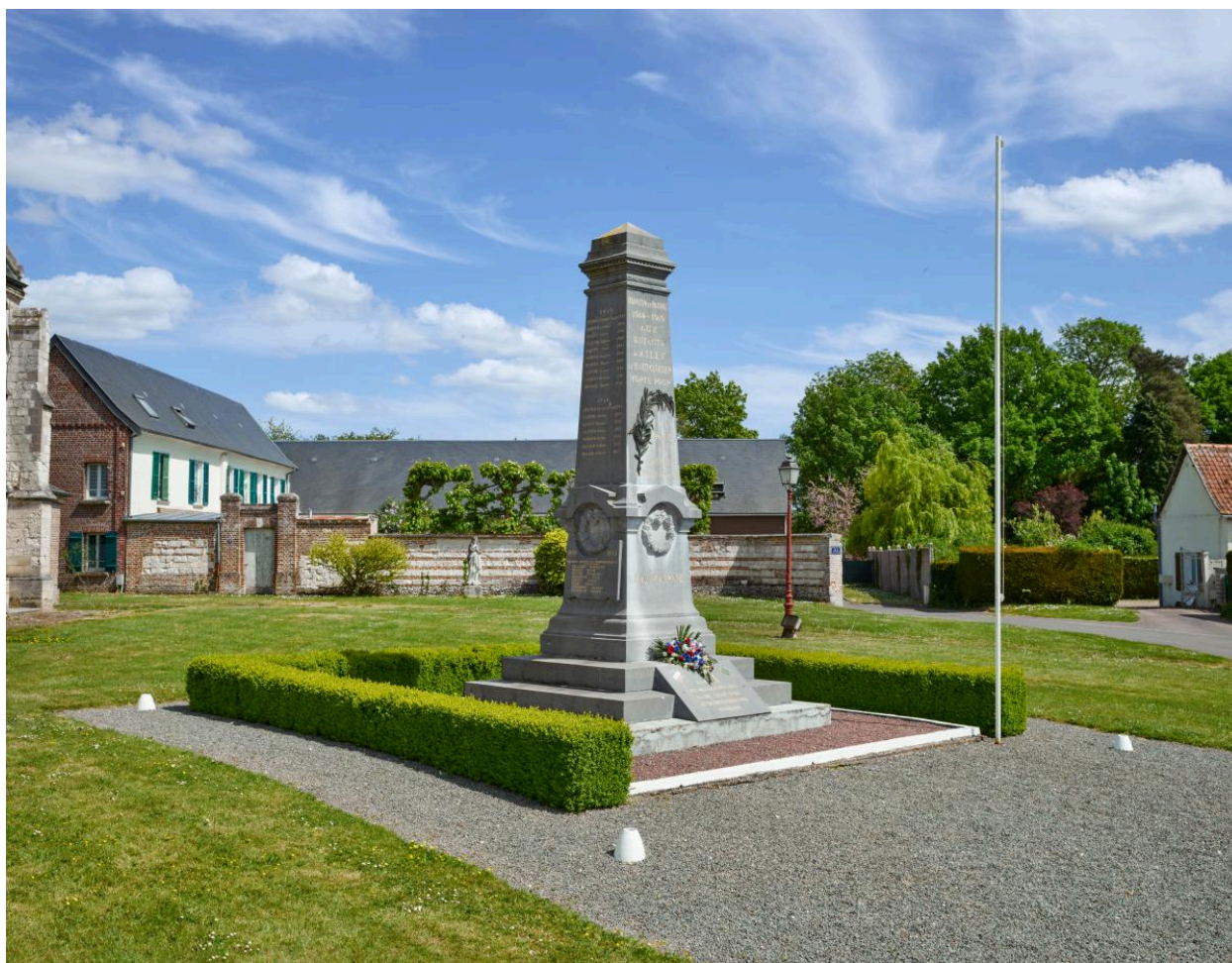
Vue générale de trois-quarts depuis l'ouest.