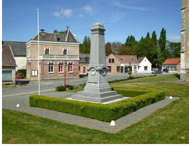
Vue générale de trois quarts depuis l'est.