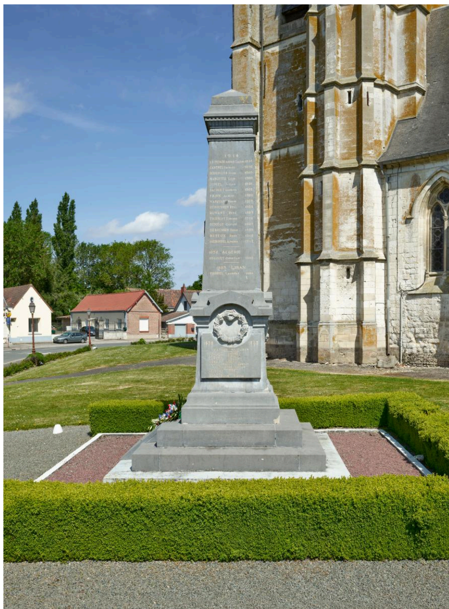
Vue générale depuis le sud-est.