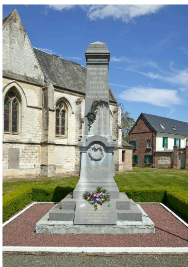
vue générale depuis le sud-ouest. IVR22_20228000109NUCA