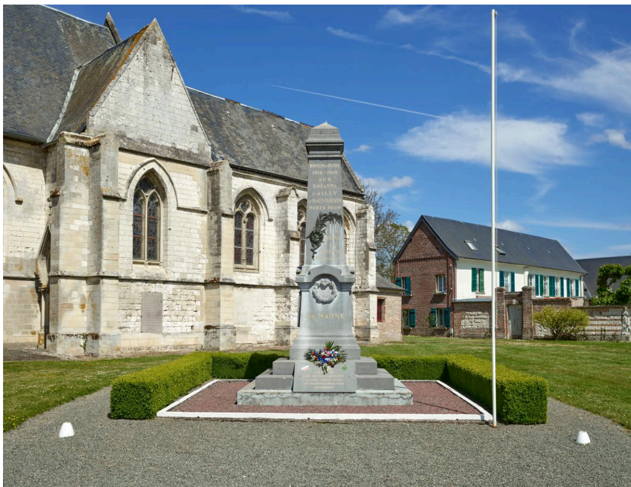
Vue générale depuis le sud-ouest.