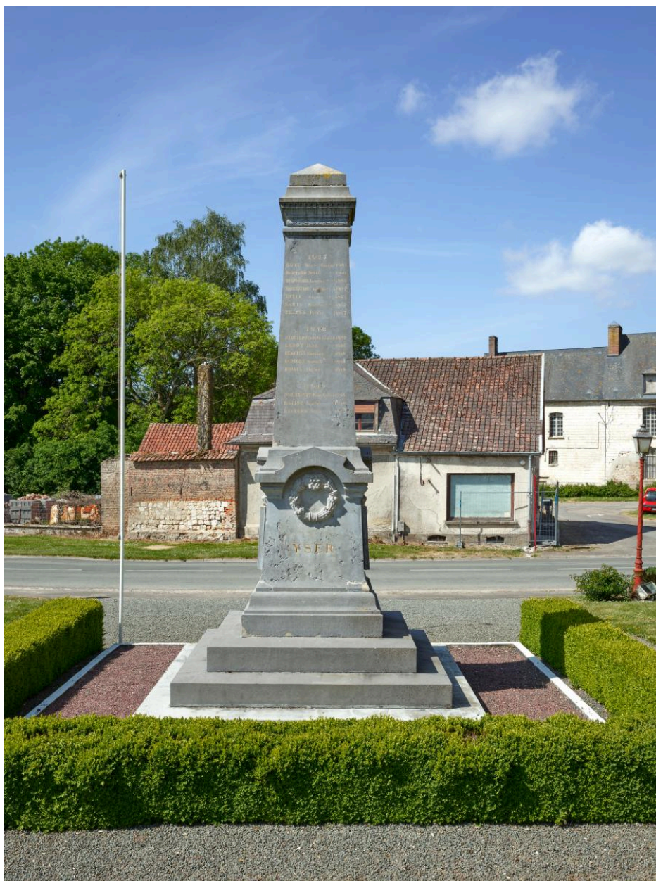
Vue générale depuis le nord-est.