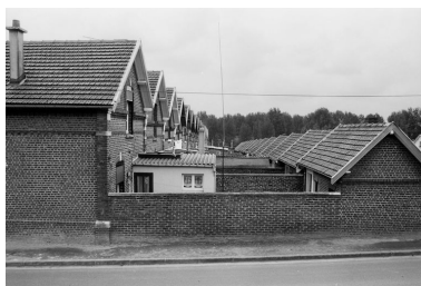
Vue d'ensemble postérieur de la cité Victor Hugo en 1991. IVR22_19918000079Z