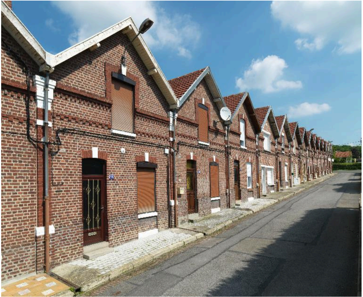
Vue d'ensemble de la cité Victor Hugo.