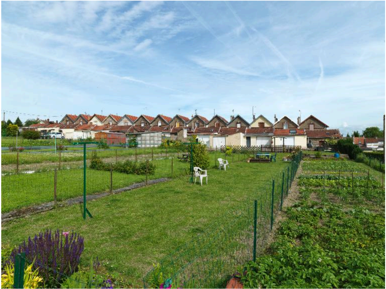
Jardins et remises de la cité ouvrière Anthime Gigaut.