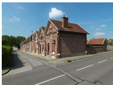
Vue d'ensemble de la cité Hugo IVR22_20128000285NUC2A