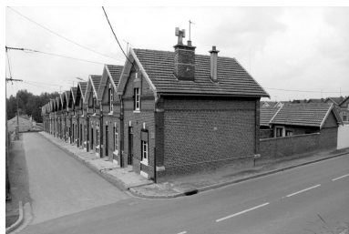
Vue d'ensemble de la cité Victor Hugo en 1991. IVR22_19918000081Z