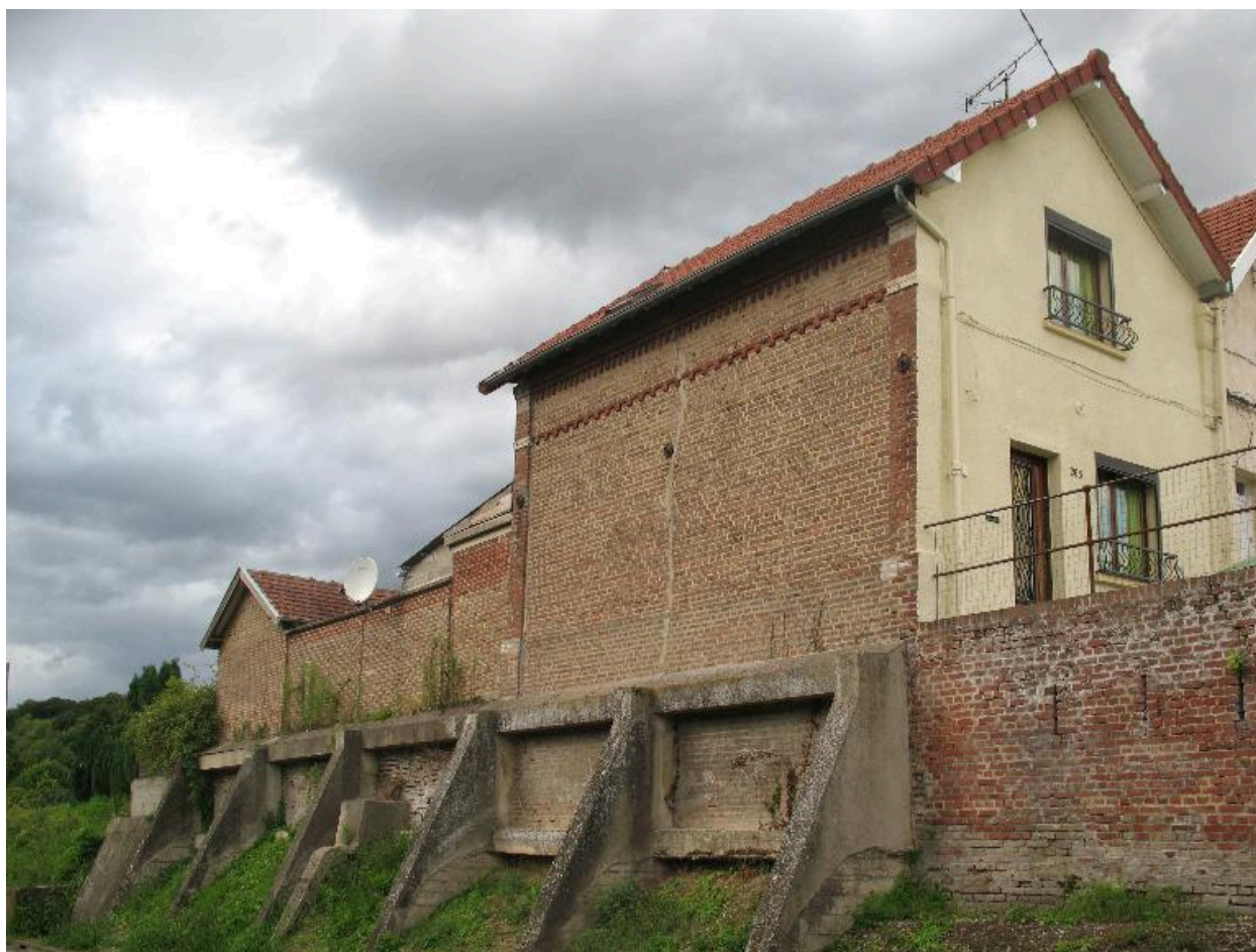
Contrefort de terrasse en béton armé rachatant le dénivelé à l'aplomb du logement.