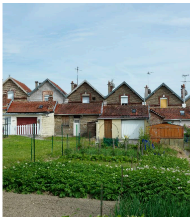
Vue des jardins situés à l'arrière des logements de la cité Anthime Gigaut.