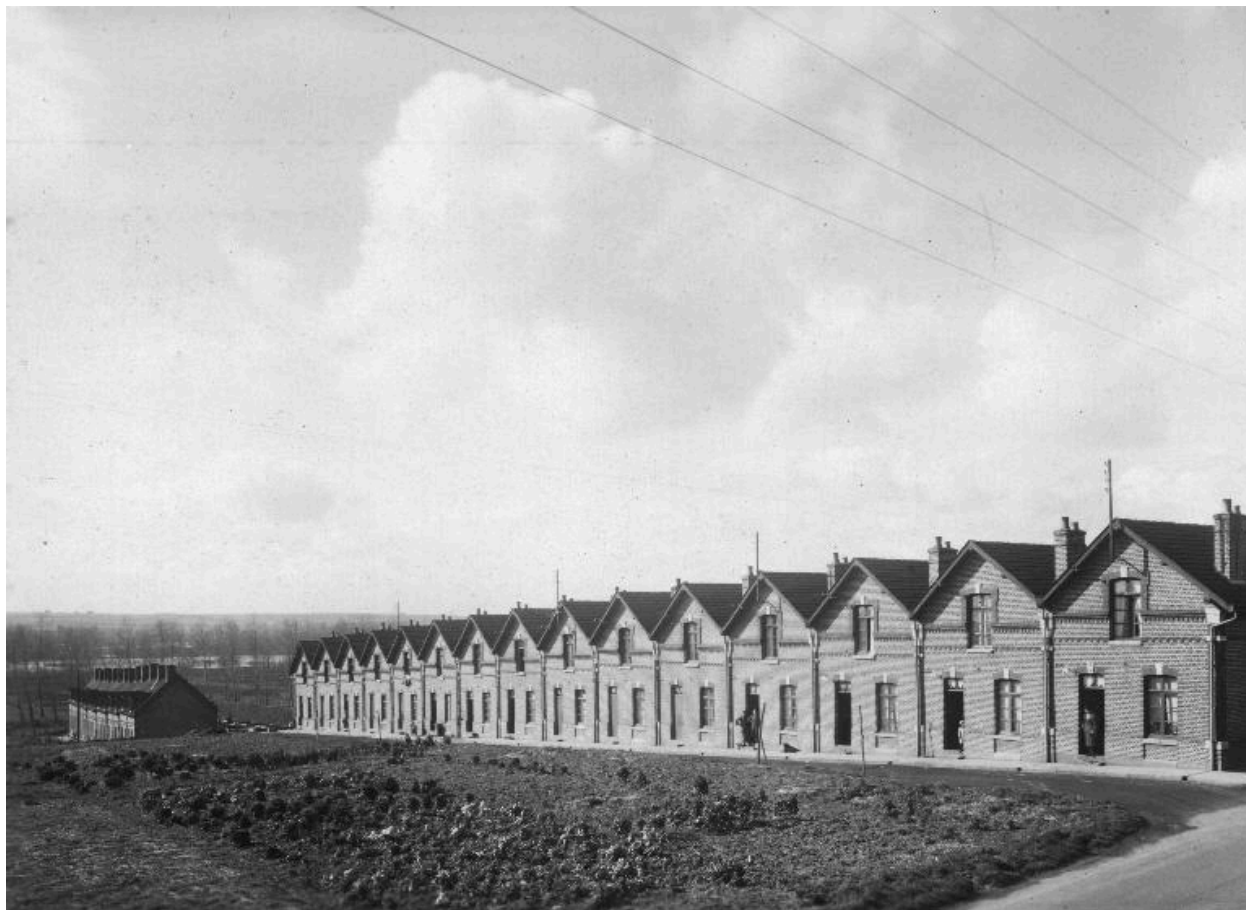
La cité Neuve vers 1937.