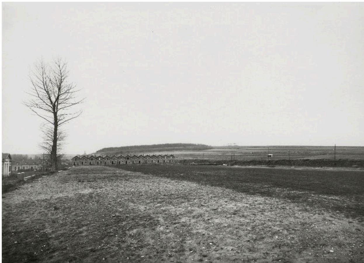
Vue d'ensemble de la cité Neuve, en 1937.