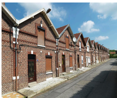
Vue d'ensemble de la cité Victor Hugo.