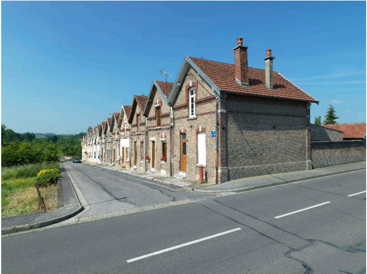
Vue d'ensemble de la cité Anthime Gigaut