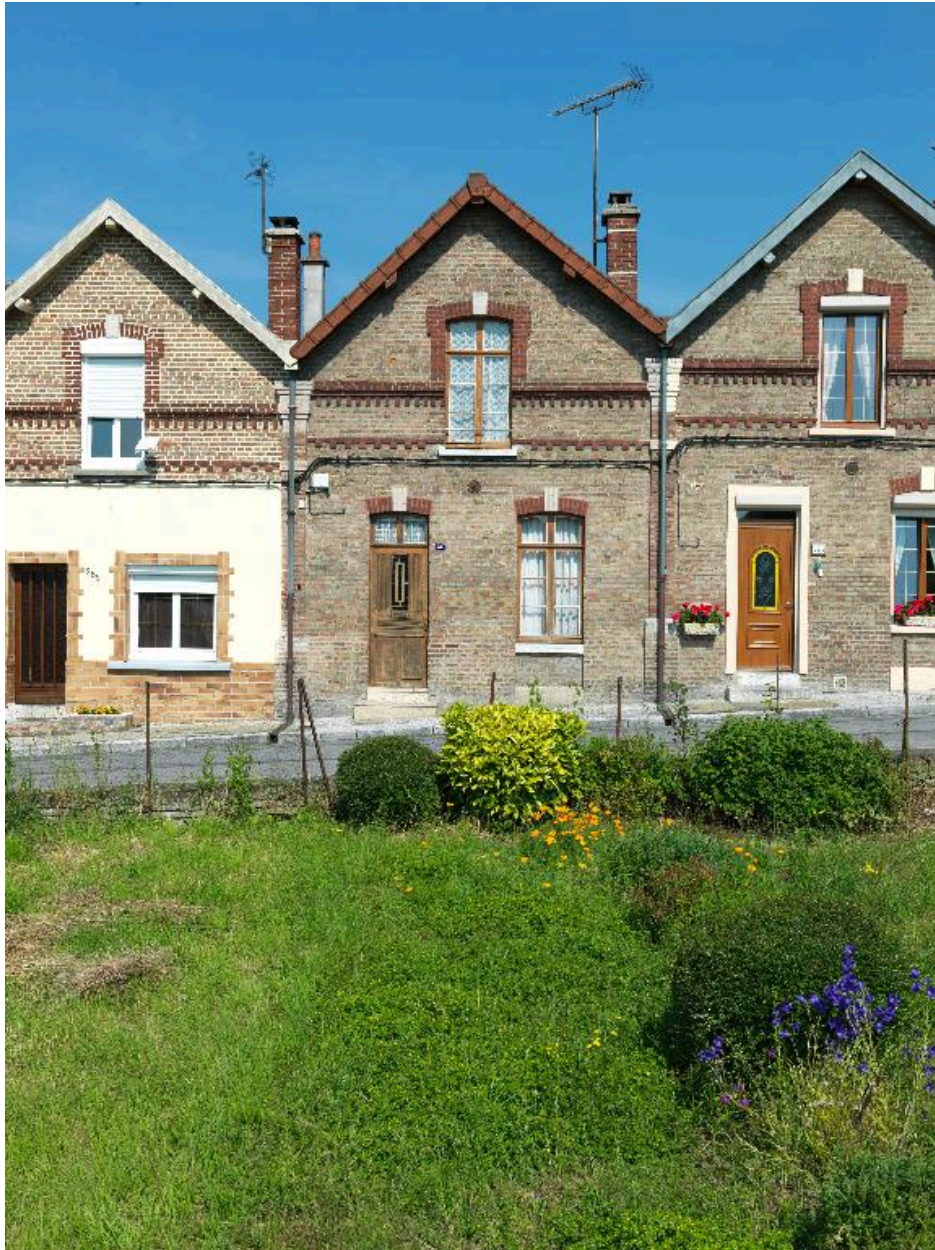
Logements de la cité Anthime Gigaut et des jardins dépendants de la cité Victor Hugo.