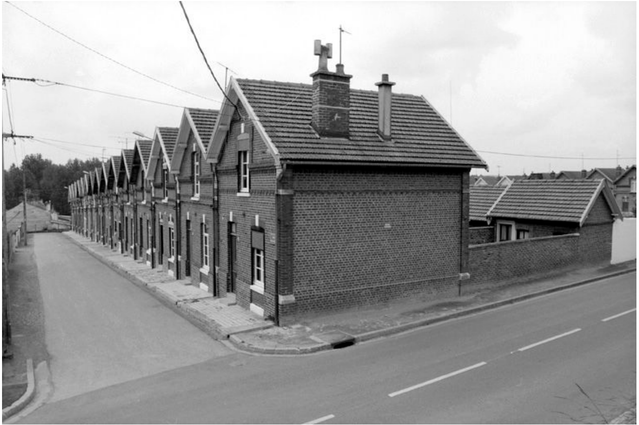
Vue d'ensemble de la cité Victor Hugo en 1991.