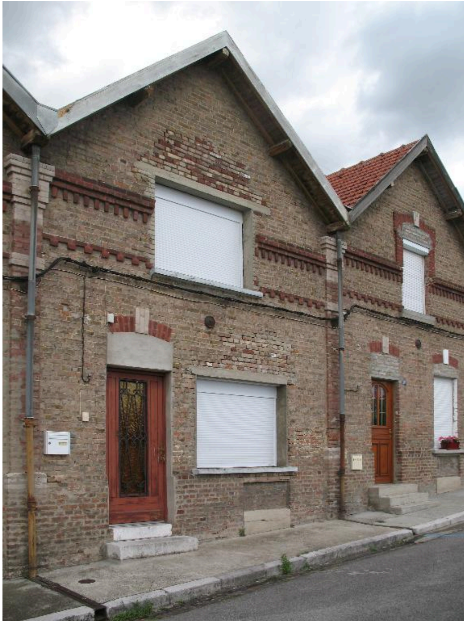
Façade sur rue du logement 285, rue Anthime Gigaut.