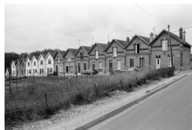
Vue d'ensemble de la cité Anthime Gigaut en 1991. IVR22_19918000078Z