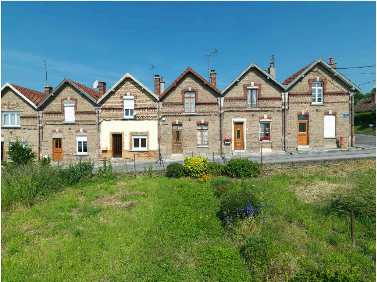
Façades sur rue des logements de la cité Anthime Gigaut et des jardins dépendants de la cité Victor Hugo.