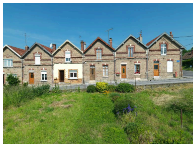
Façades sur rue des logements de la cité Anthime Gigaut et des jardins dépendants de la cité Victor Hugo. IVR22_20128000290NUC2A

Logements de la cité Anthime Gigaut et des jardins dépendants de la cité Victor Hugo. IVR22_20128000289NUC2A