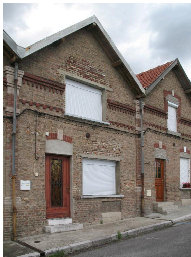
Façade sur rue du logement 285, rue Anthime Gigaut.