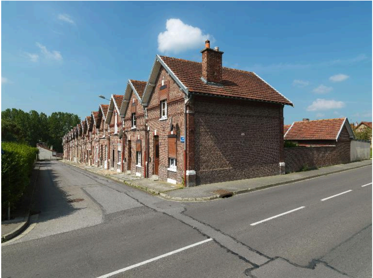
Vue d'ensemble de la cité Hugo