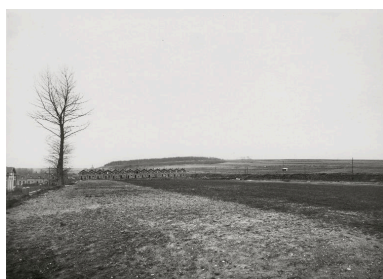
Vue d'ensemble de la cité Neuve, en 1937.