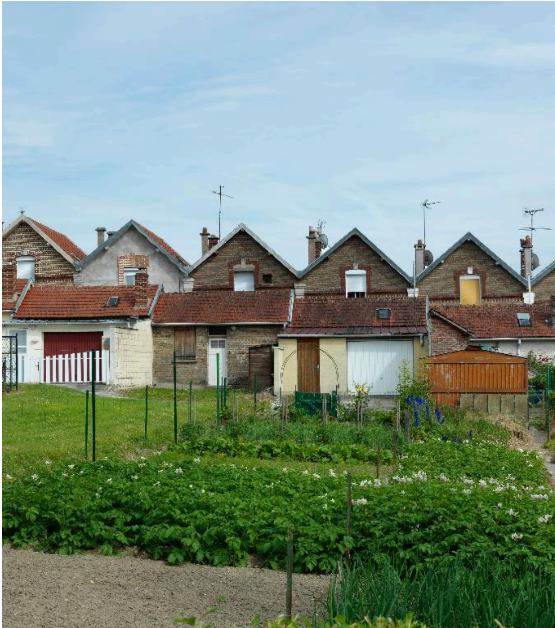
Vue des jardins situés à l'arrière des logements de la cité Anthime Gigaut.