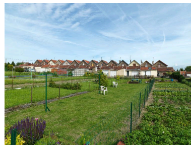
Jardins et remises de la cité ouvrière Anthime Gigaut. IVR22_20128000291NUC2A