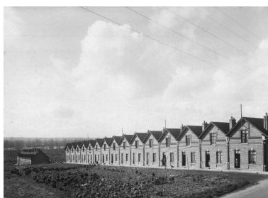
La cité Neuve vers 1937.