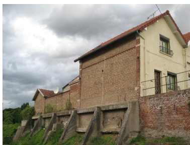
Contrefort de terrasse en béton armé rachatant le dénivelé à l'aplomb du logement.