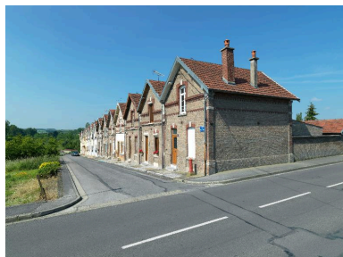
Vue d'ensemble de la cité Anthime Gigaut IVR22_20128000288NUC2A