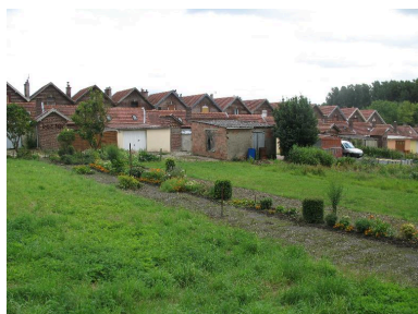
Jardins et remises de la cité ouvrière Victor Hugo.