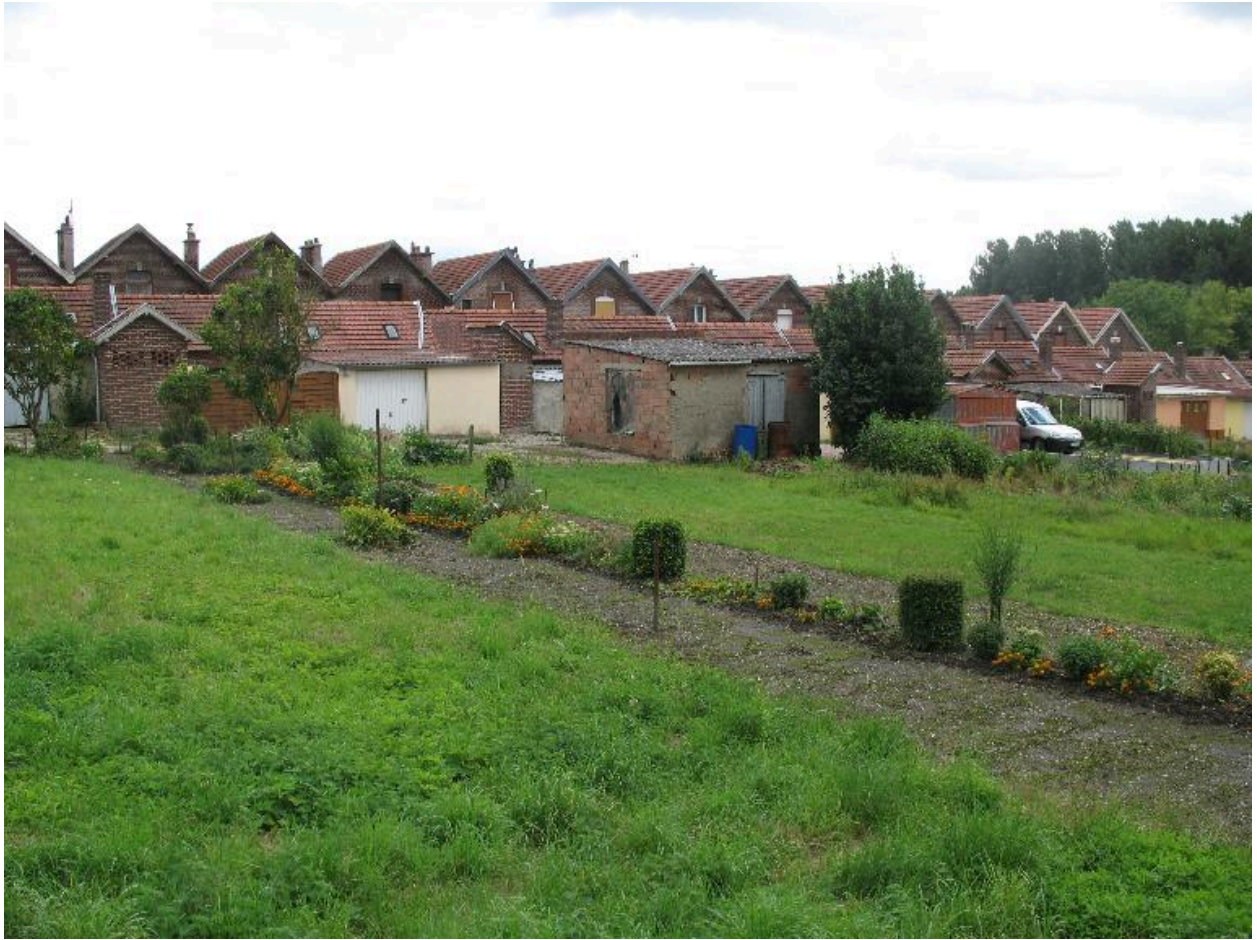
Jardins et remises de la cité ouvrière Victor Hugo.