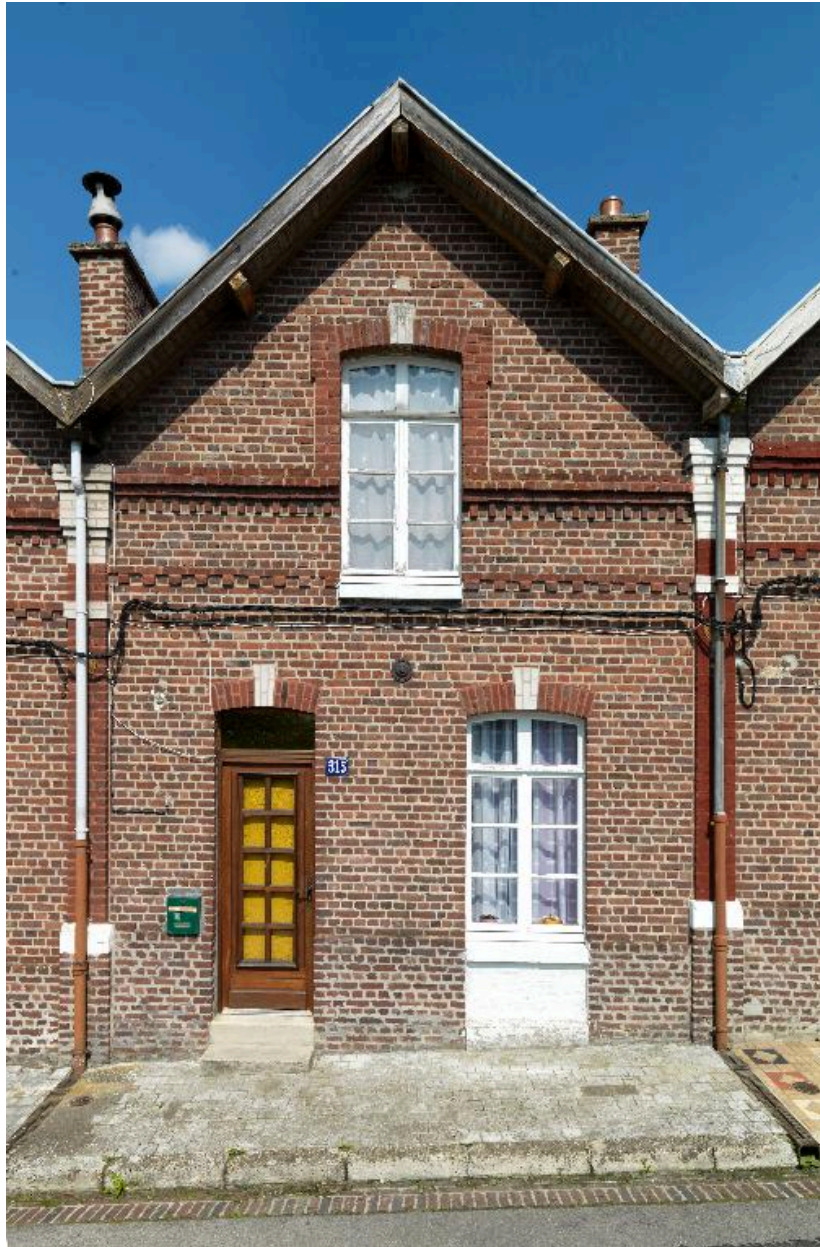
Façade sur rue du logement 315 rue Victor Hugo.