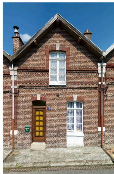
Façade sur rue du logement 315 rue Victor Hugo. IVR22_20128000287NUC2A