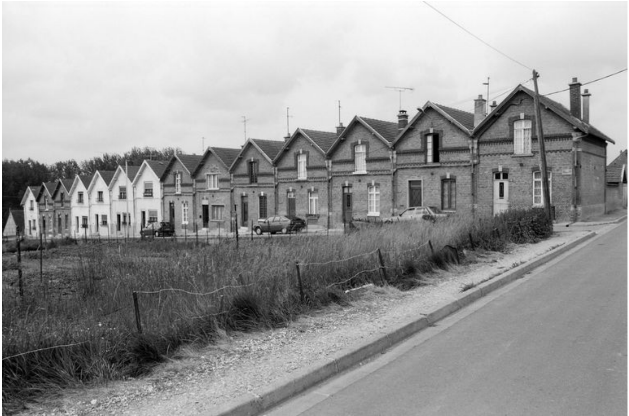
Vue d'ensemble de la cité Anthime Gigaut en 1991.