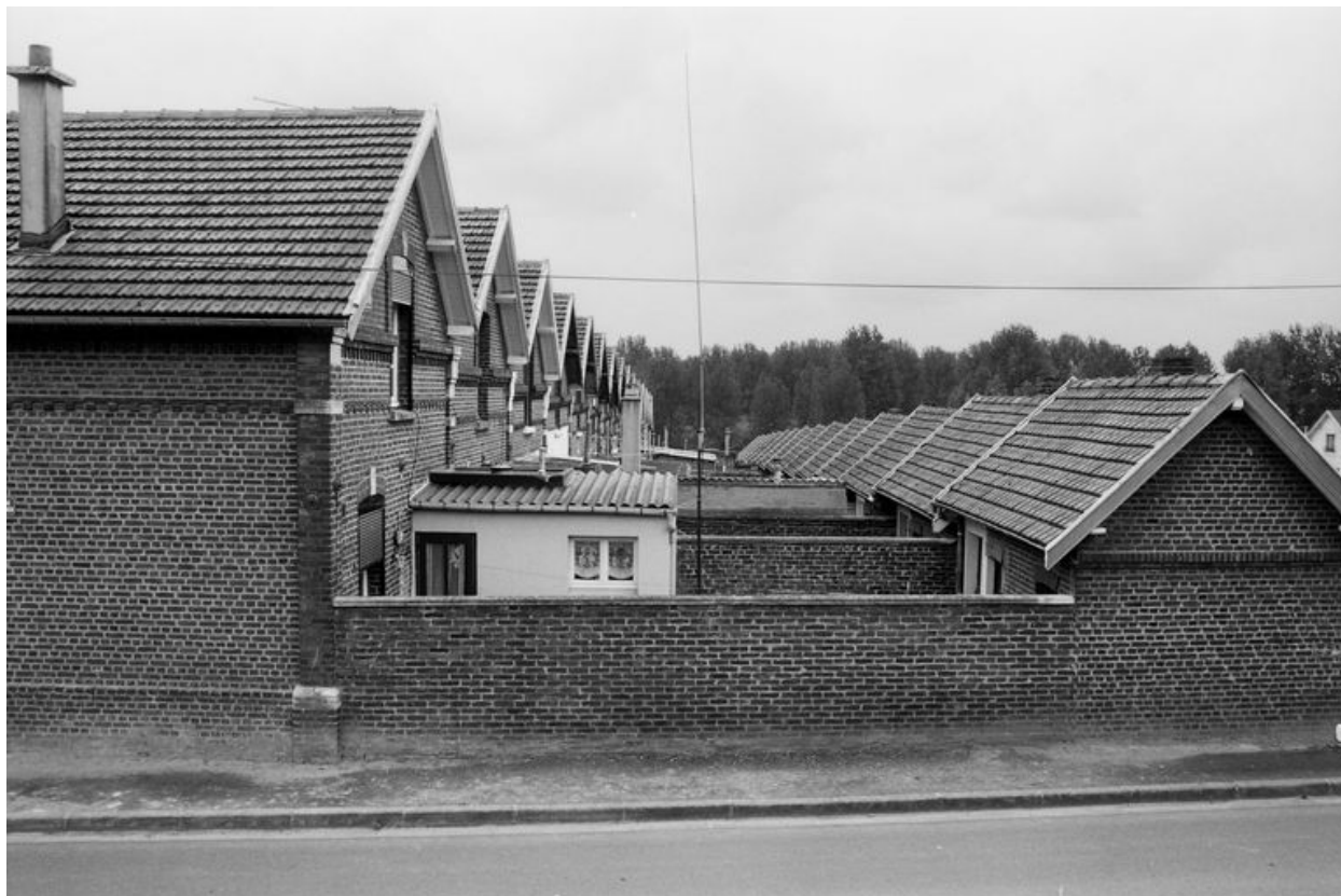
Vue d'ensemble postérieur de la cité Victor Hugo en 1991.