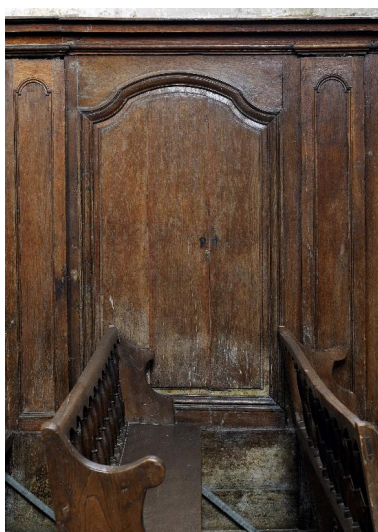
Panneau du lambris de la nef, mur nord.

IVR22_20148000087NUC2A