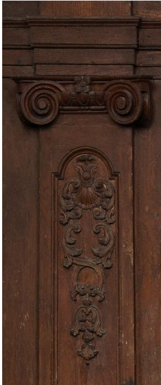
Pilastre corinthien du mur sud du chœur, orné d'une coquille et de rinceaux végétaux.