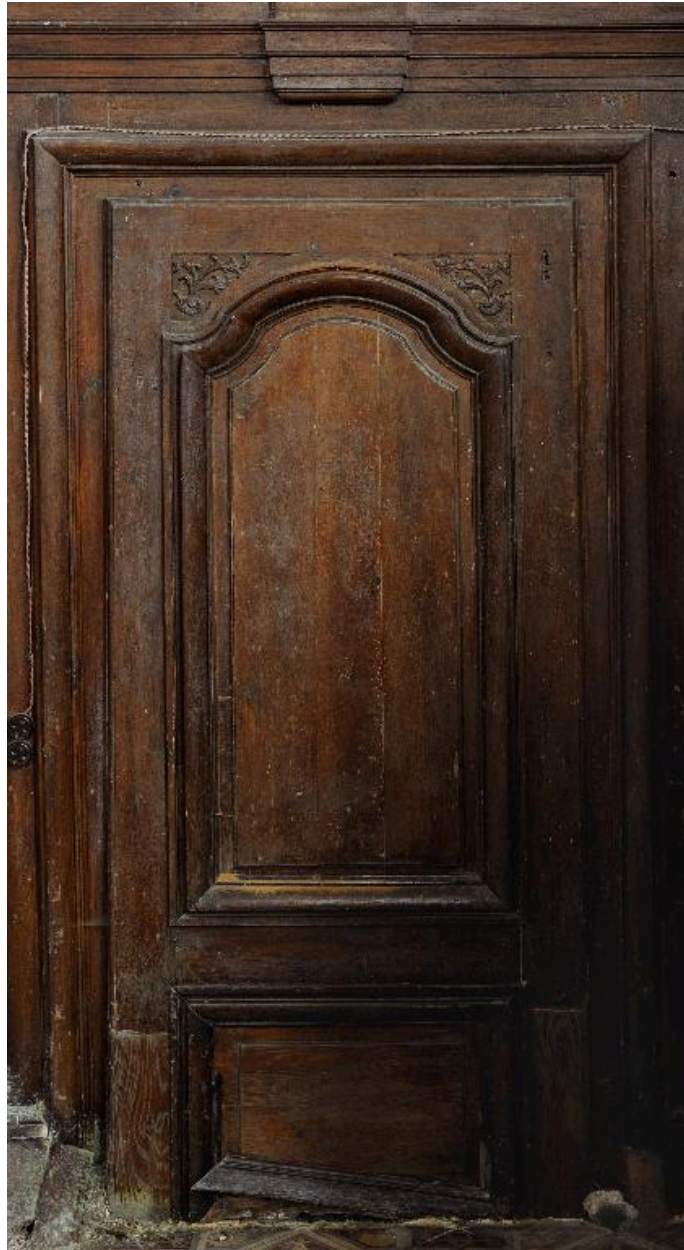
Fausse-porte de l'abside, mur nord.