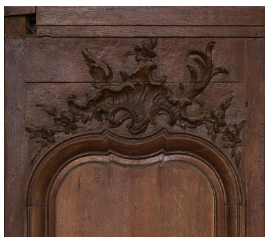
Partie supérieure d'un panneau du mur nord du chœur, couronné d'une rocaille.

IVR22_20148000081NUC2A