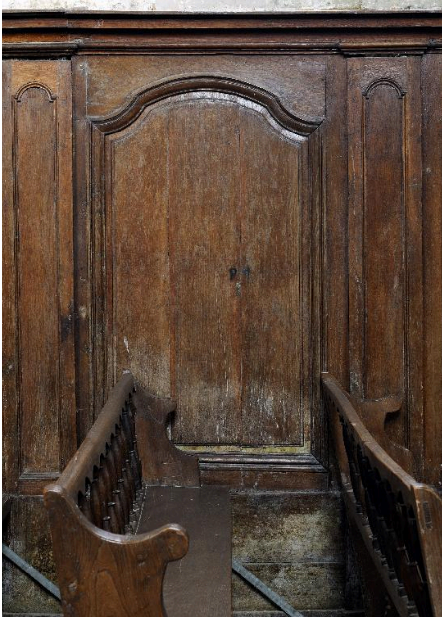
Panneau du lambris de la nef, mur nord.