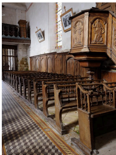
Vue générale du lambris, des bancs de fidèles et de la chaire à prêcher, côté nord de la nef.

IVR22_20148000087NUC2A