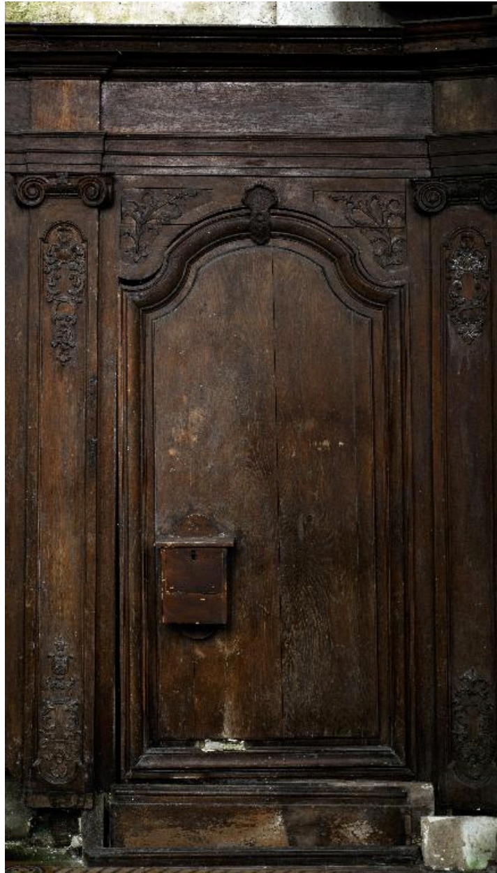
Panneau de lambris de l'abside, mur nord.