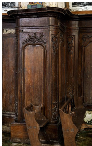
Panneau de lambris de l'arc triomphal, piedroit nord.

Phot. Marie-Laure Monnehay-Vulliet IVR22_20148000089NUC2A