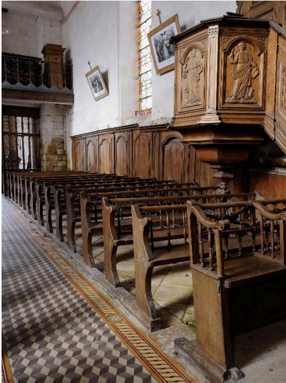
Vue générale du lambris, des bancs de fidèles et de la chaire à prêcher, côté nord de la nef.