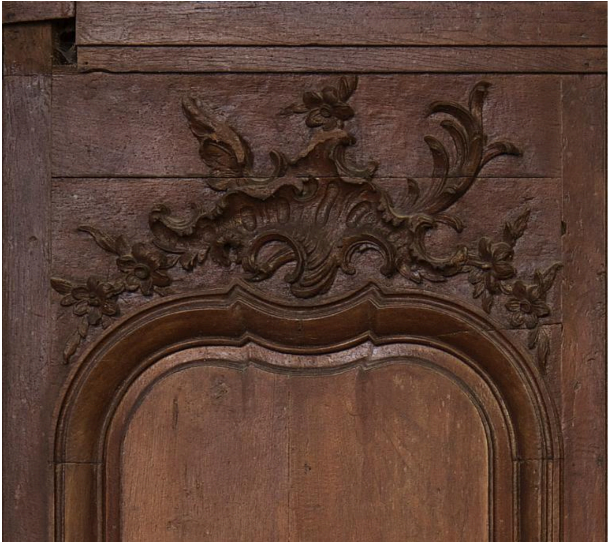
Partie supérieure d'un panneau du mur nord du chœur, couronné d'une rocaille.