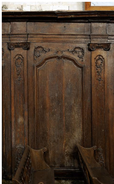
Panneau de lambris du chœur, mur nord.

IVR22_20148000078NUC2A