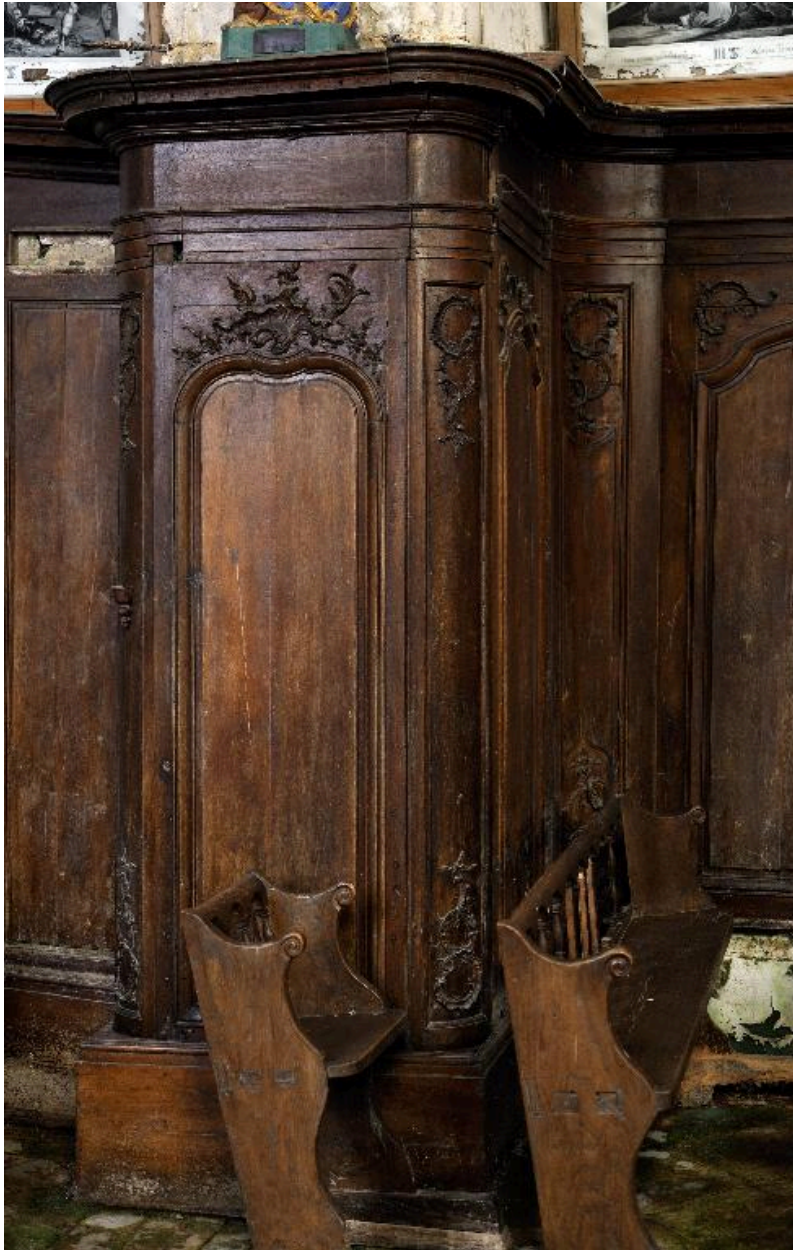
Panneau de lambris de l'arc triomphal, piédroit nord.