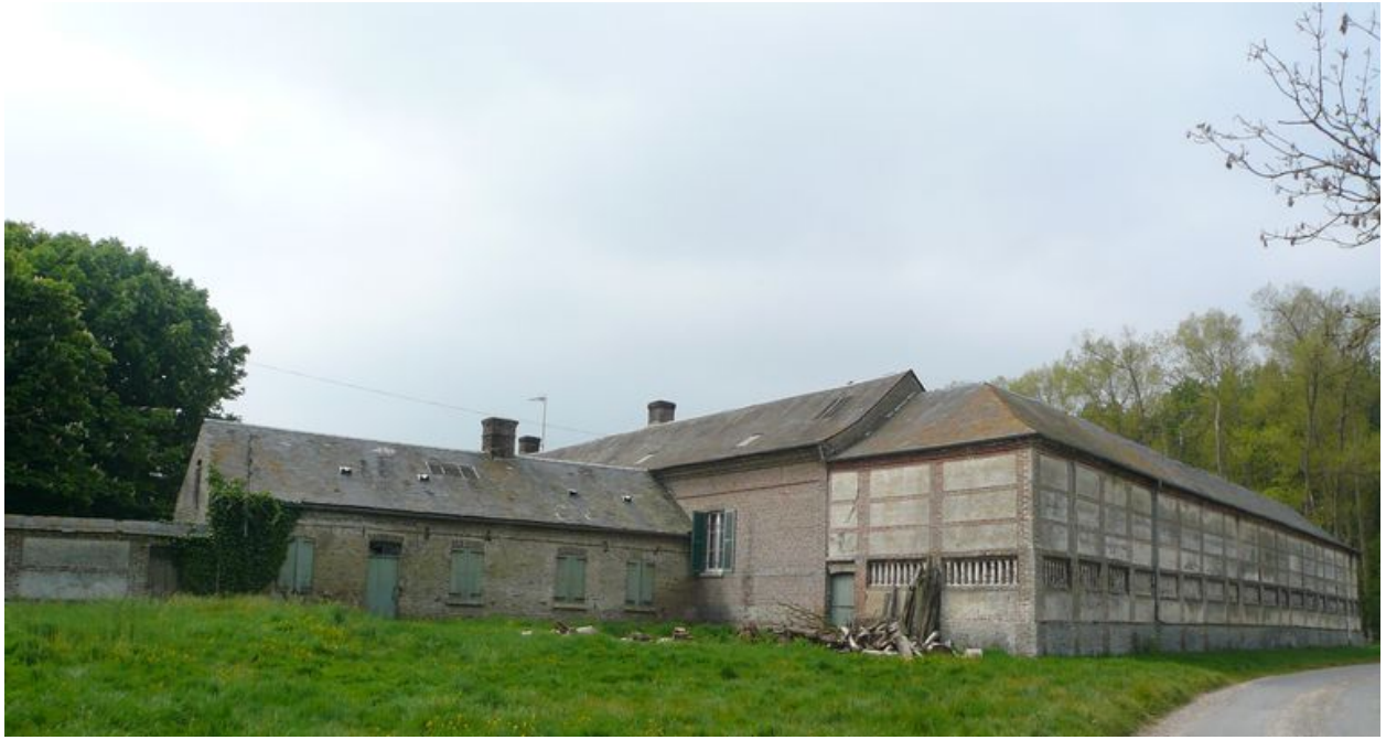
Vue générale depuis la rue.