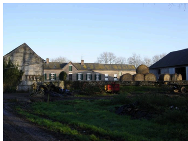
Vue générale sur la cour intérieure de la ferme.