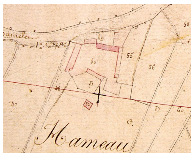
Extrait du cadastre napoléonien présentant le plan de la ferme en 1828.

Phot. Monnehay-Vulliet Marie-Laure IVR22_20078005787XAB