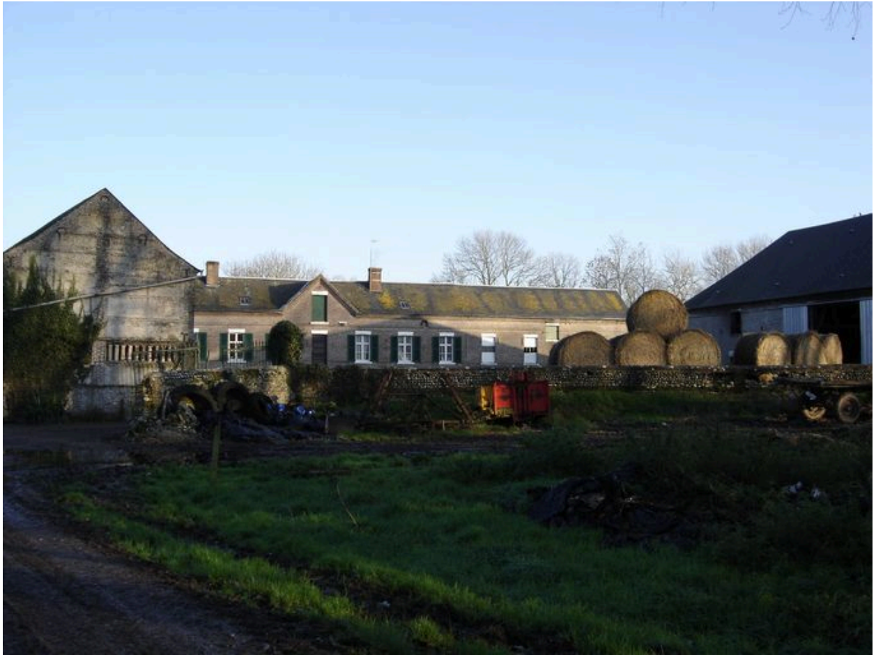
Vue générale sur la cour intérieure de la ferme.