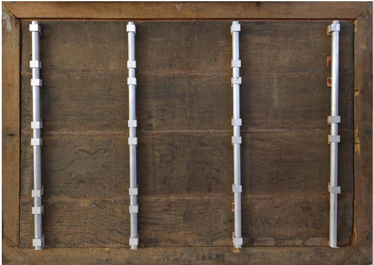
Vue du revers.