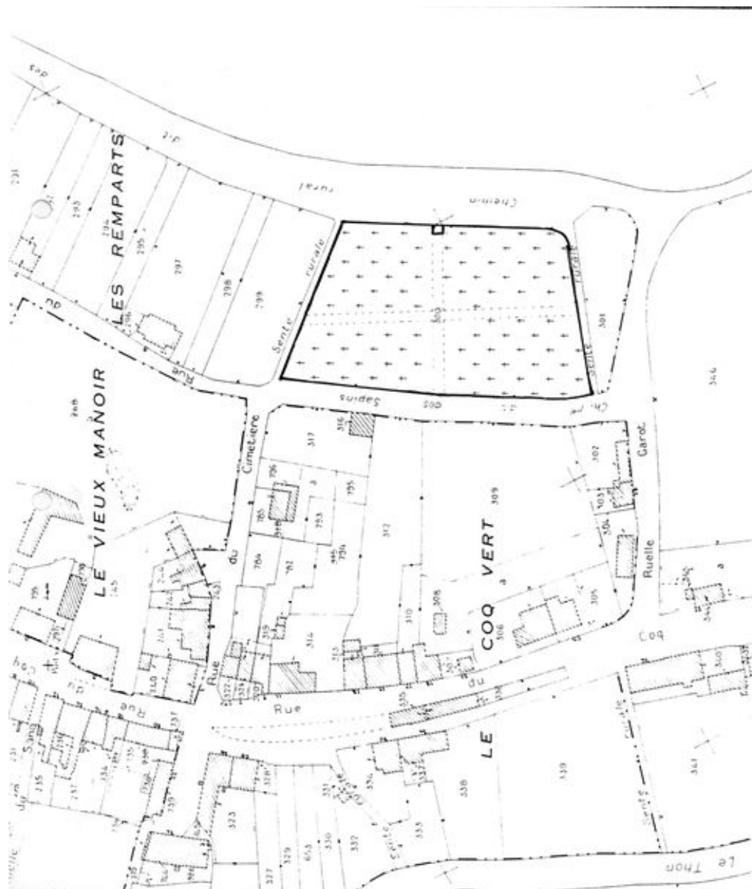
Plan de situation. Extrait du plan cadastral de 1986, section B.