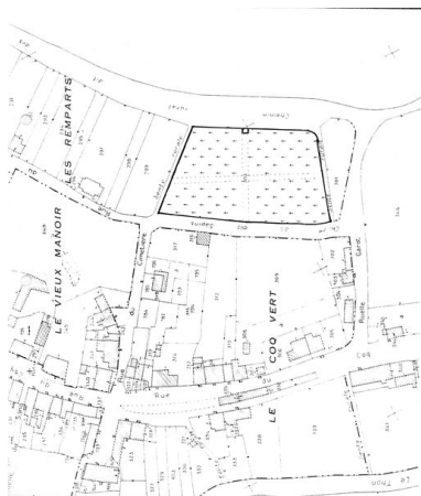
Plan de situation. Extrait du plan cadastral de 1986, section B. IVR22_20080290186NUCA