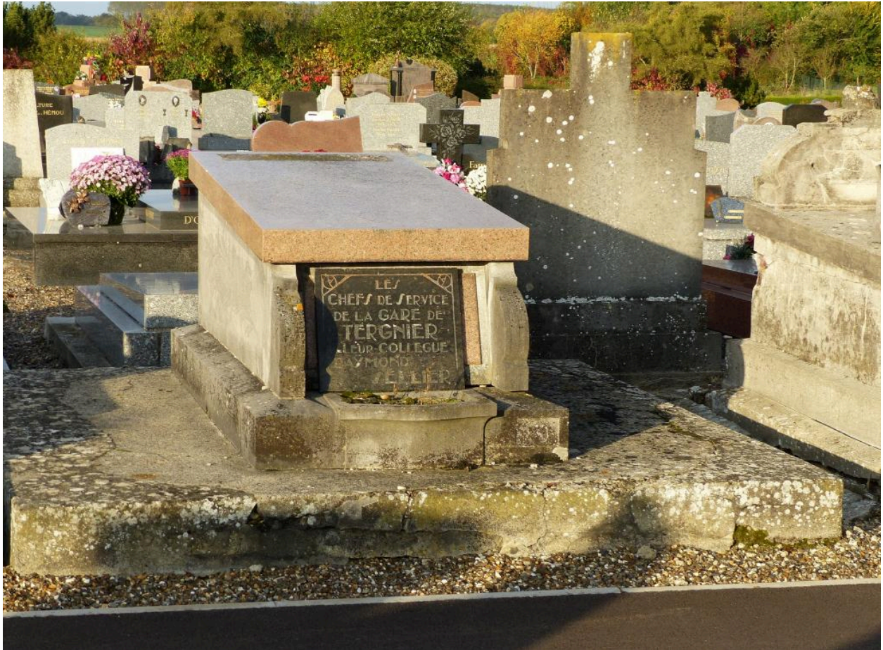
Tombeau (sarcophage) de Raymond Sellier.