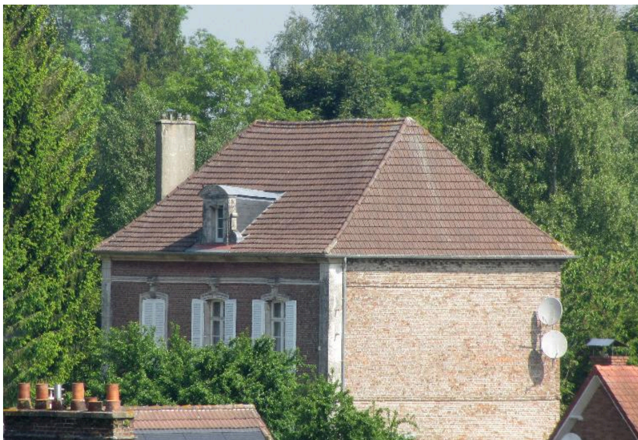
Vue de la maison depuis les hauteurs du village.