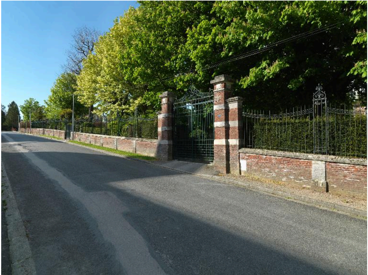
Mur de clôture de la propriété.