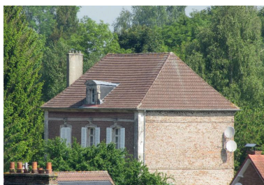
Vue de la maison depuis les hauteurs du village.