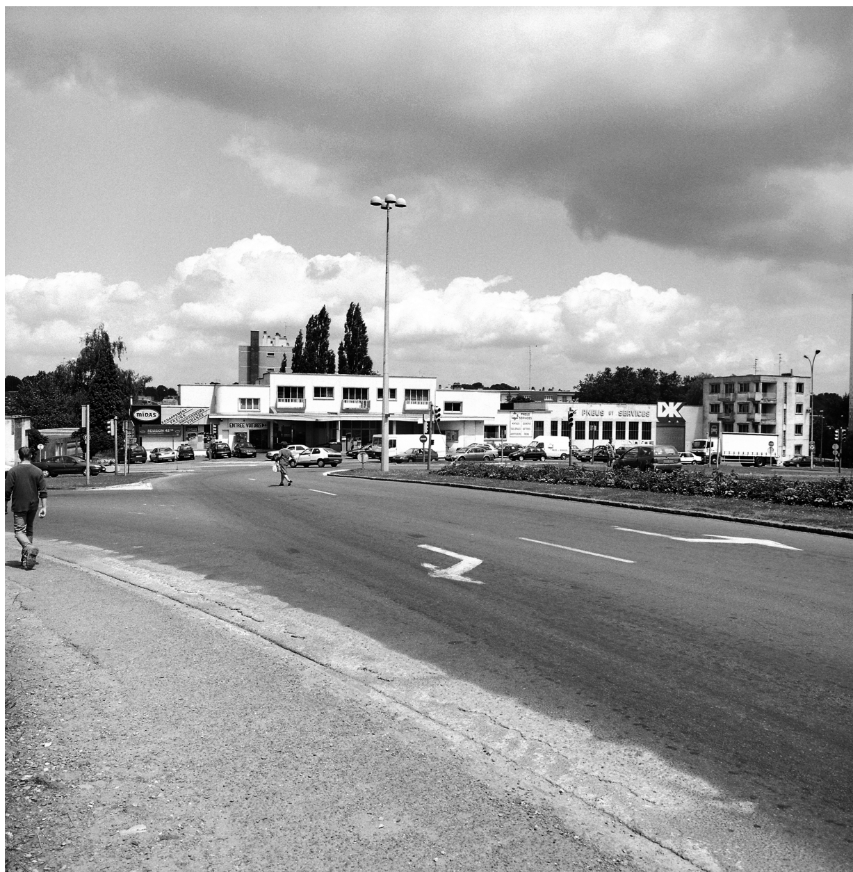
Vue générale du garage, de l'atelier et de l'immeuble à logements.