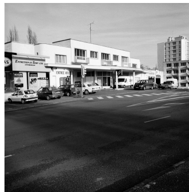
Vue générale du garage. IVR31_20025902922X