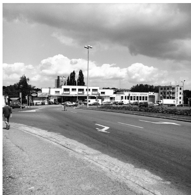
Vue générale du garage, de l'atelier et de l'immeuble à logements. IVR31_20025902032X