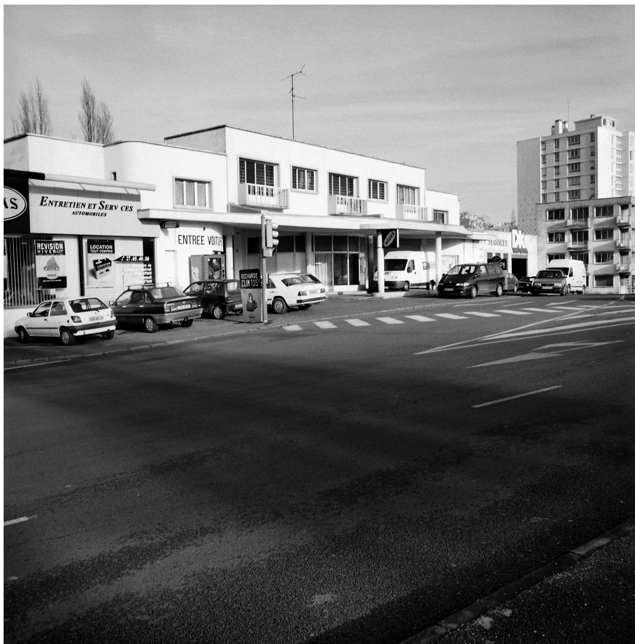
Vue générale du garage.