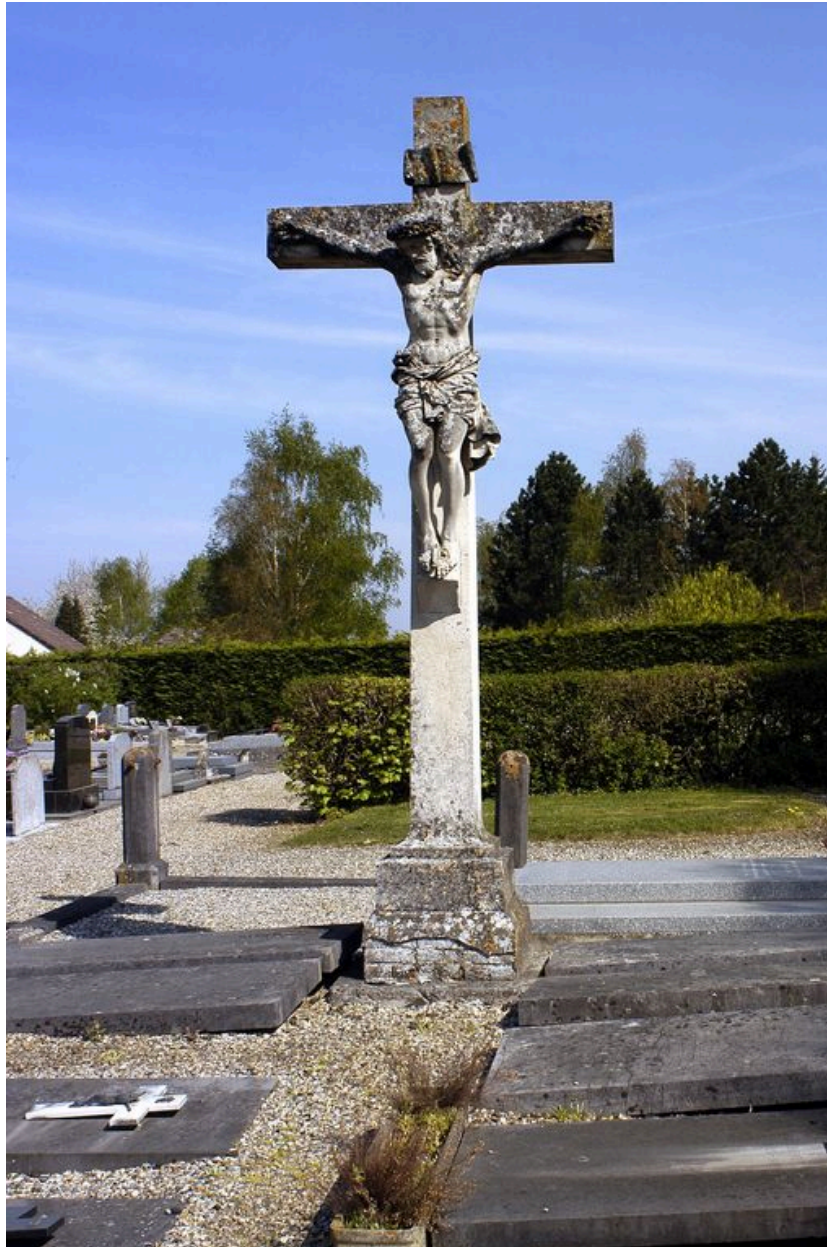
Christ en croix.