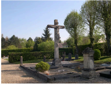
Vue générale. IVR22_20078010010NUCA