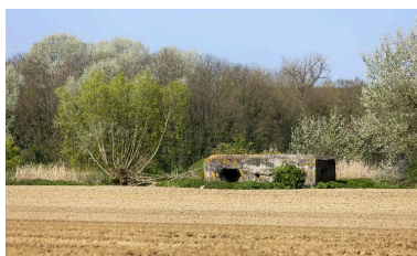
Vue générale vers le nord-ouest IVR31_20145904811NUCA