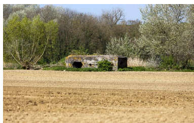
Vue générale vers le nord-ouest IVR31_20145904810NUCA