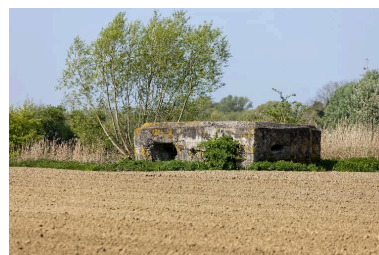
Vue générale vers le nord-ouest IVR31_20145904812NUCA