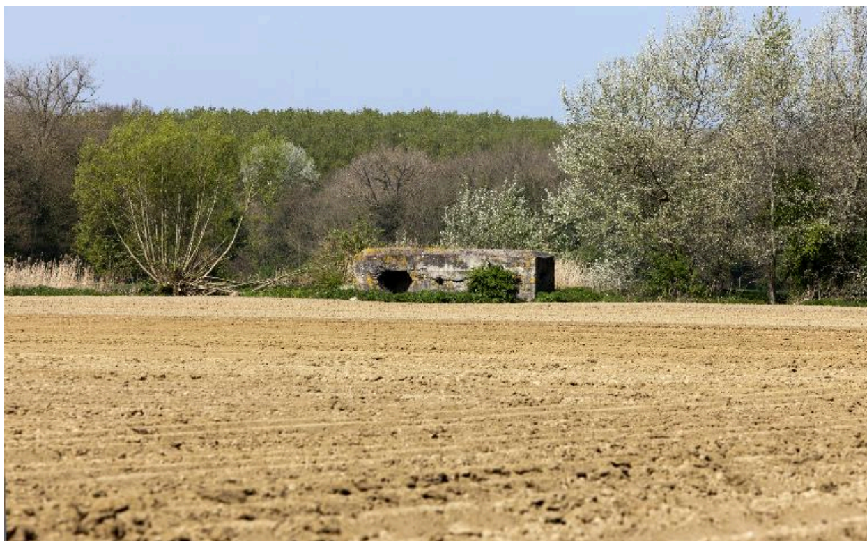
Vue générale vers le nord-ouest