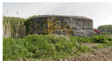
Vue latérale vers le nord-est IVR31_20145904813NUCA