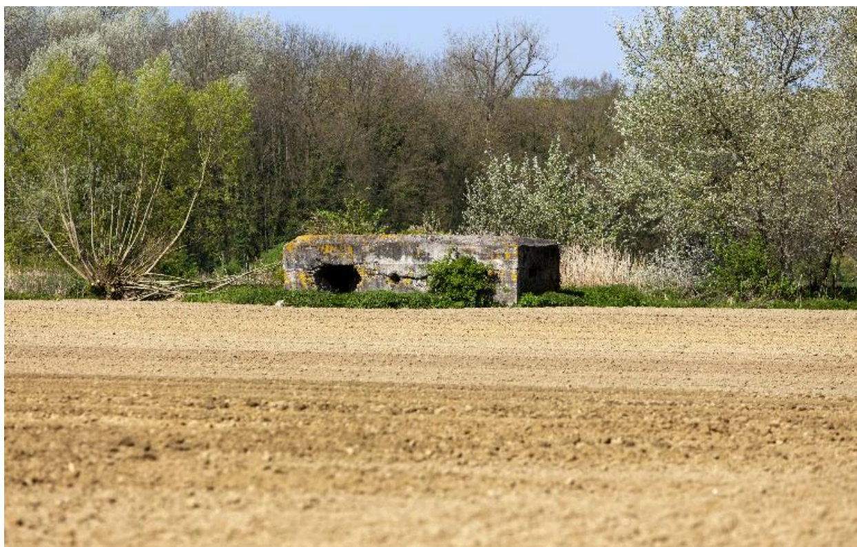
Vue générale vers le nord-ouest