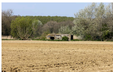
Vue générale vers le nord-ouest IVR31_20145904809NUCA