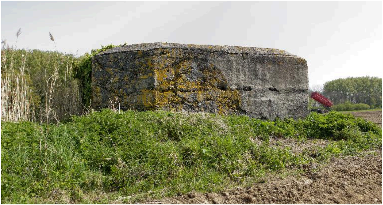
Vue latérale vers le nord-est