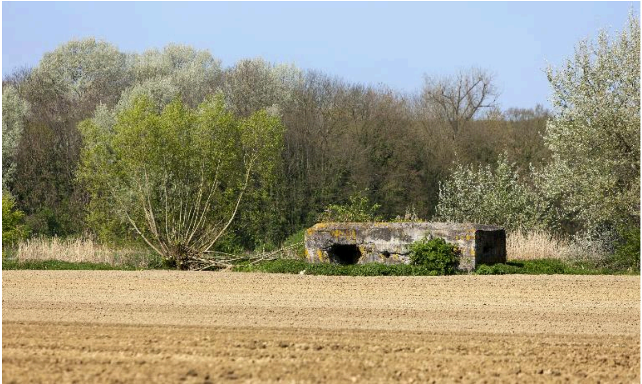
Vue générale vers le nord-ouest