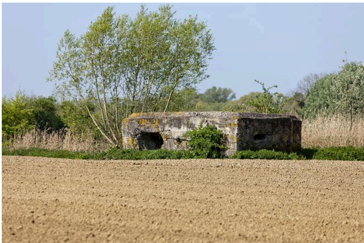
Vue générale vers le nord-ouest