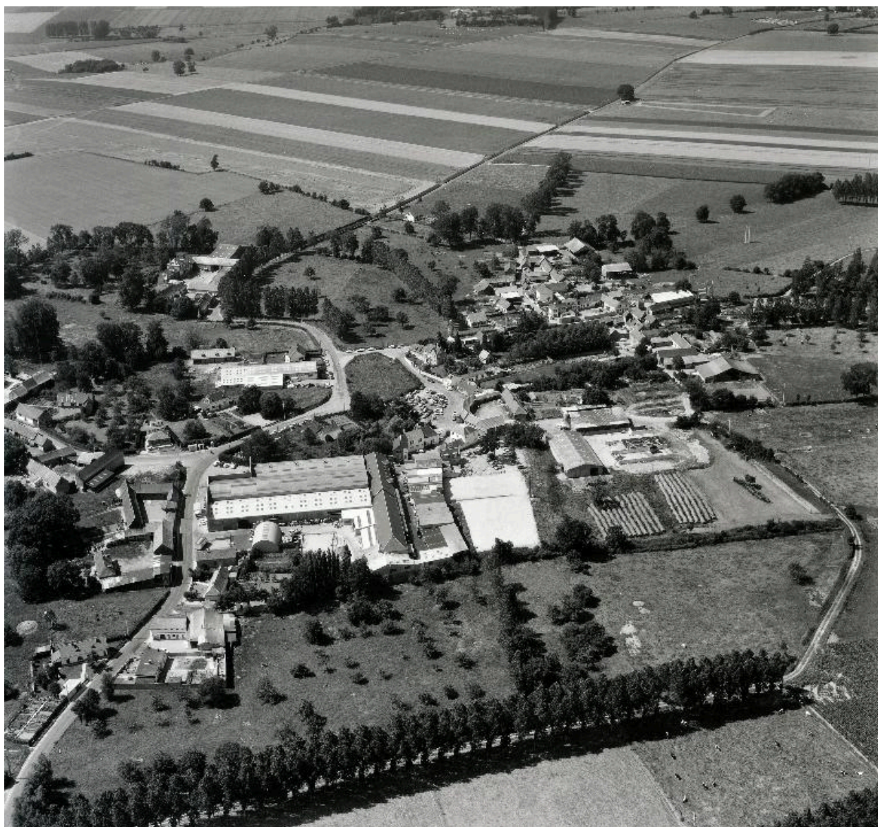
Vue aérienne de l'usine et du hameau de Saucourt depuis le sud-est, en 1988.