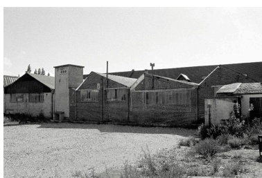
Vue partielle de l'atelier de fabrication, en 1990.