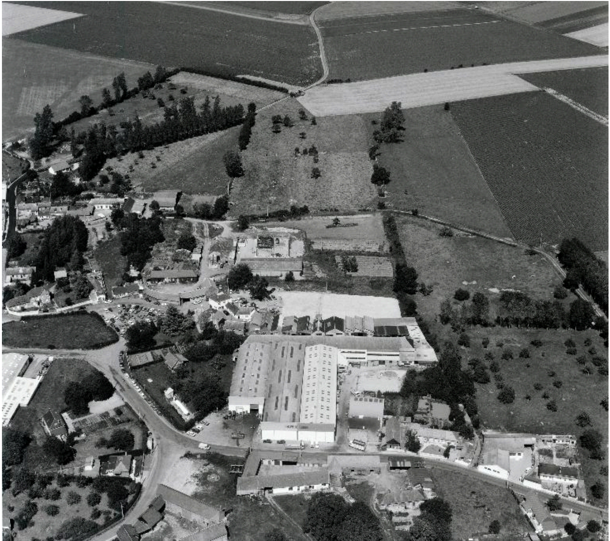
Vue aérienne de l'usine depuis le sud-ouest, en 1990.