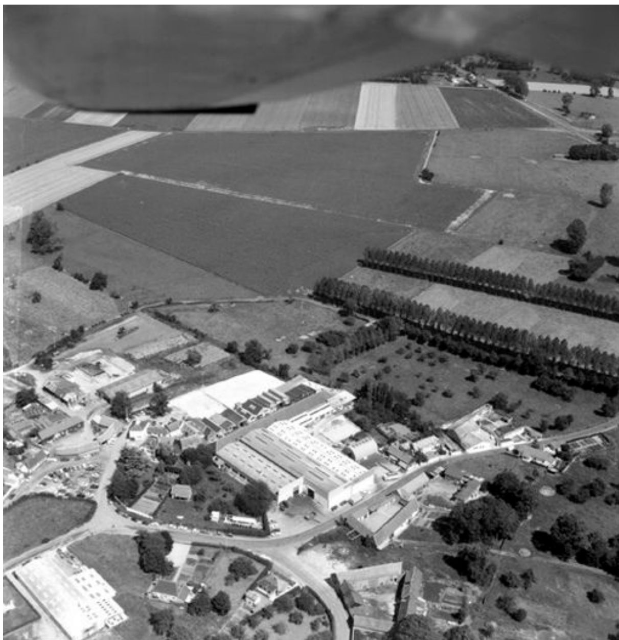
Vue aérienne de l'usine et du hameau de Saucourt depuis le nord, en 1990.