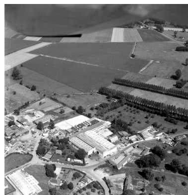
Vue aérienne de l'usine et du hameau de Saucourt depuis le nord, en 1990.