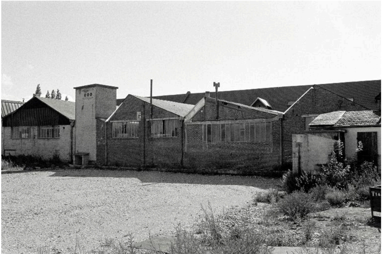
Vue partielle de l'atelier de fabrication, en 1990.