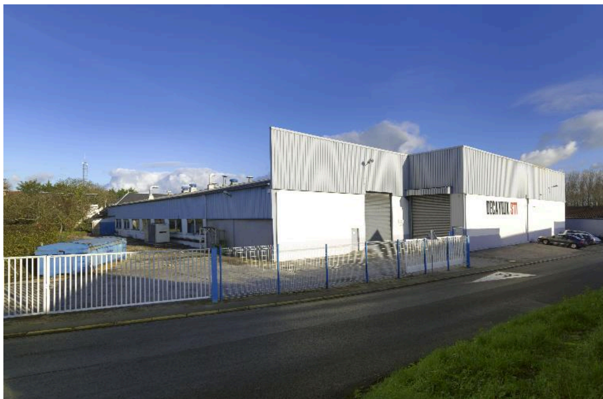
Vue des ateliers de fabrication.