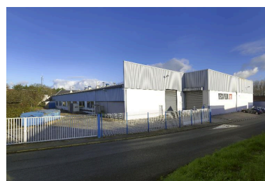
Vue des ateliers de fabrication.