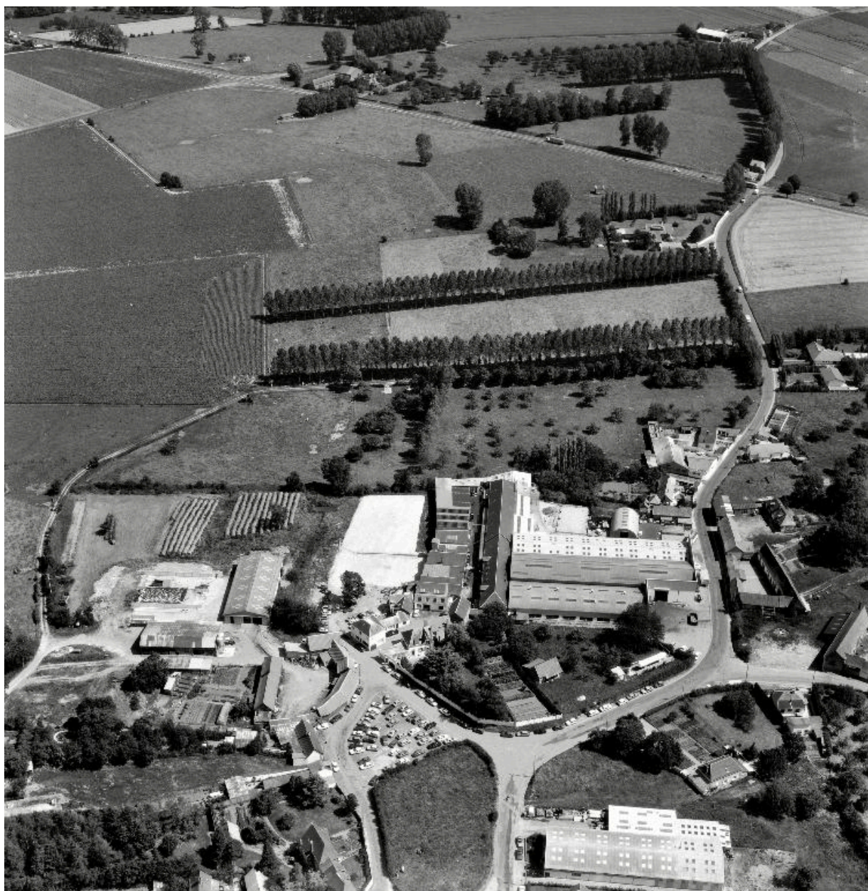
Vue aérienne depuis le nord-ouest, en 1988.