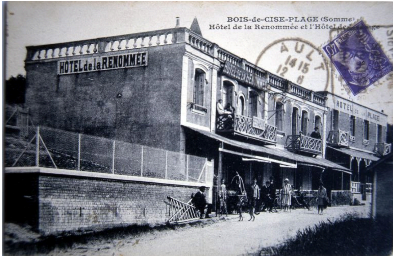
Carte postale, 1er quart 20e siècle (coll. part).