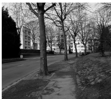
Vue générale des immeubles. IVR31_20035900305X