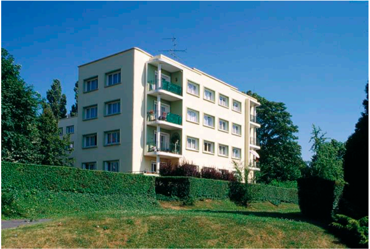
Vue générale de l'immeuble situé à droite du boulevard, élévation sud.