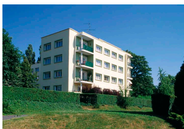
Vue générale de l'immeuble situé à droite du boulevard, élévation sud.