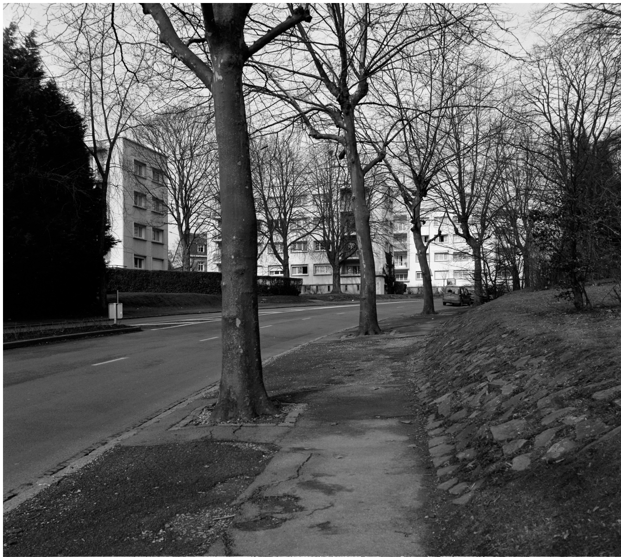
Vue générale des immeubles.