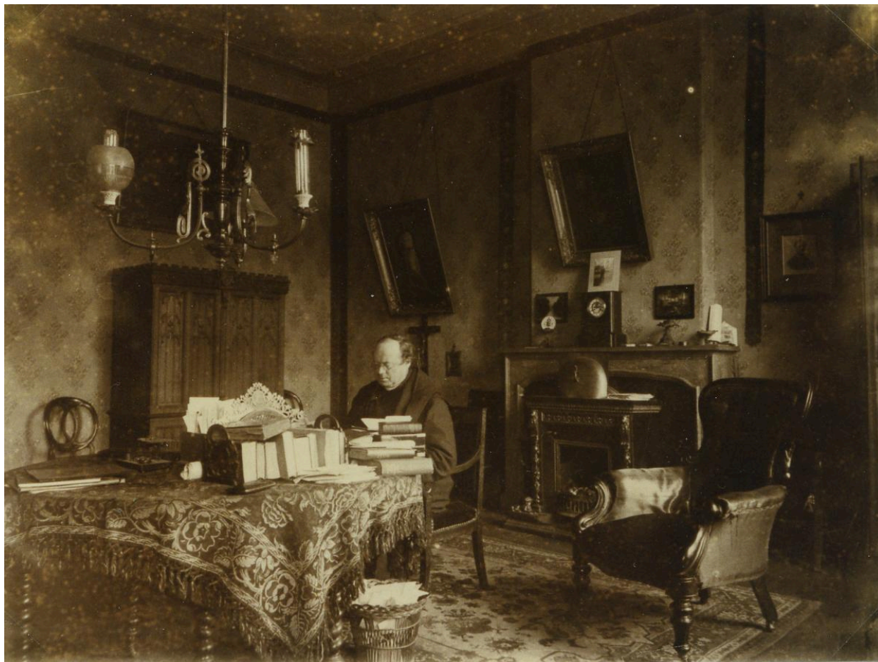
Bureau du directeur. Photographie, avant 1903. On aperçoit au fond à gauche l'armoire qui est toujours conservée dans le lycée.