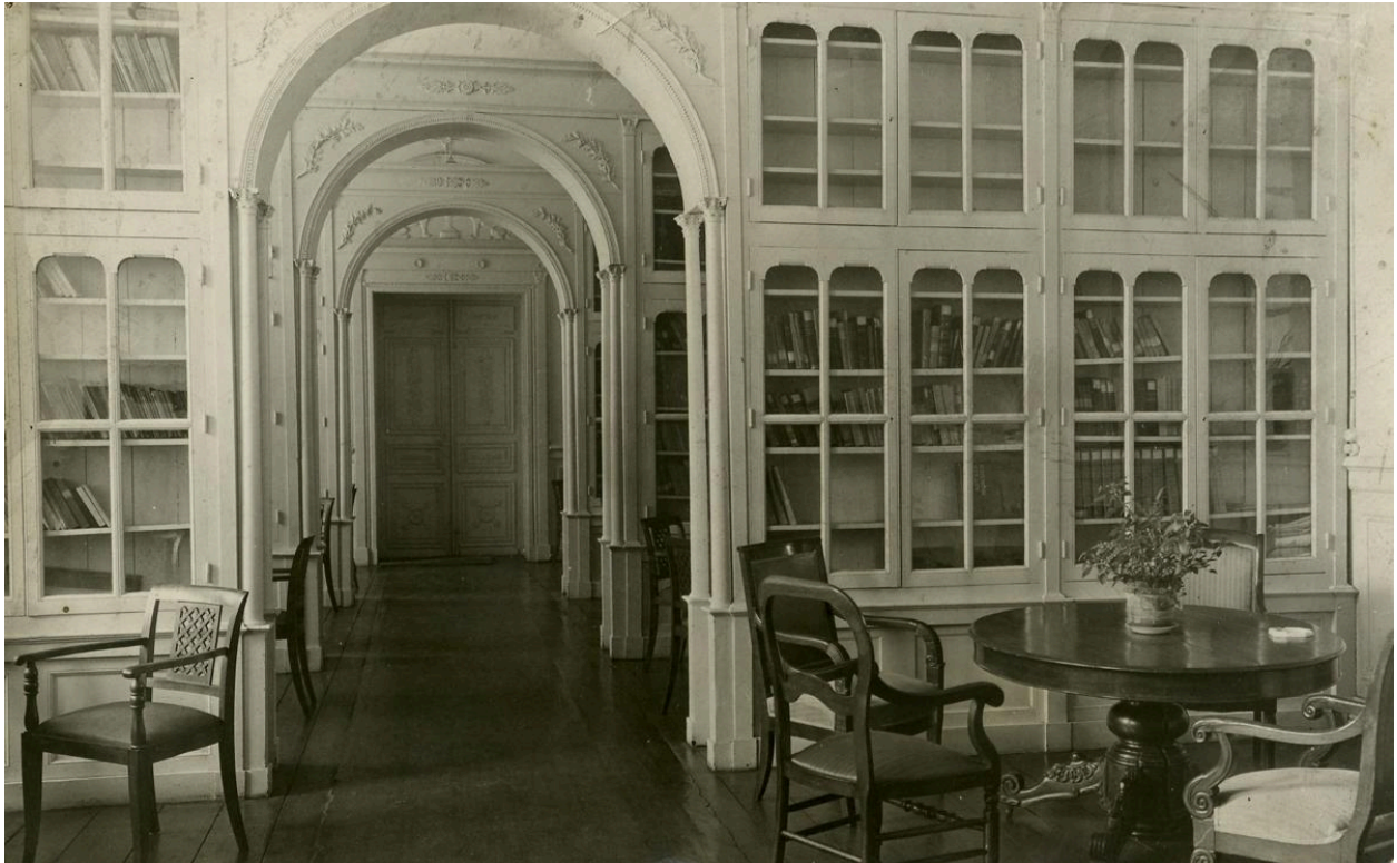
Bibliothèque meublée. Photographie, sans date (vers 1904 ?).