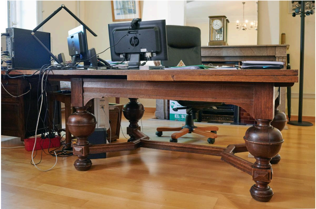
Table servant du bureau.