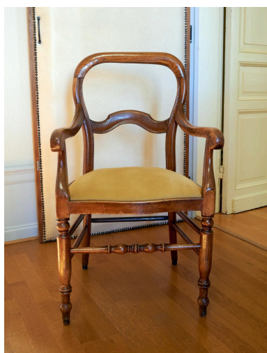
Fauteuil provenant de l'ancienne bibliothèque. Ce meuble est visible sur la photographie de la bibliothèque produite vers 1904.