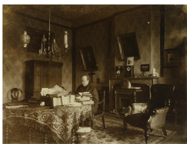
Bureau du directeur. Photographie, avant 1903. On aperçoit au fond à gauche l'armoire qui est toujours conservée dans le lycée.