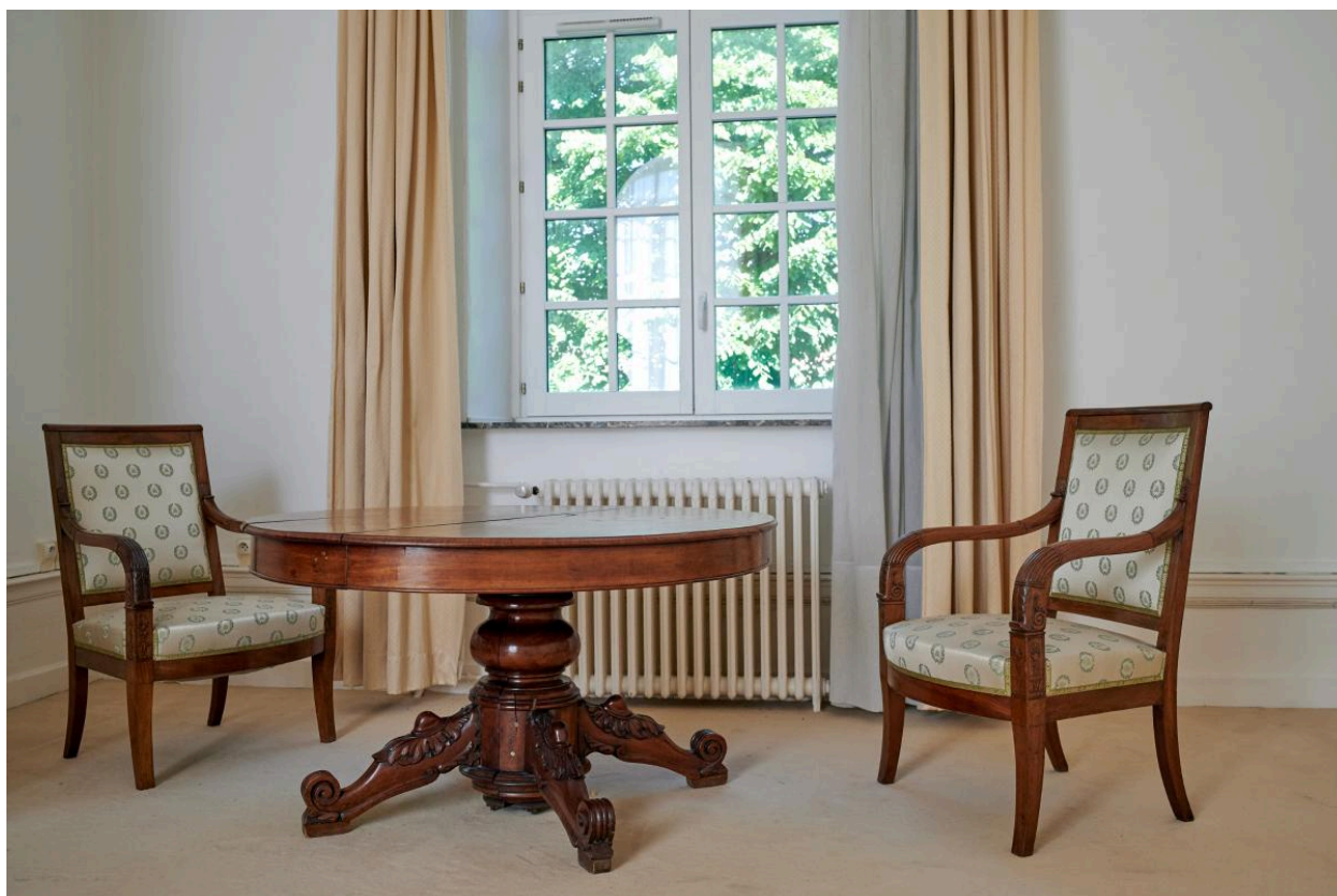
Table ronde à piètement central et deux fauteuils provenant de l'ancienne bibliothèque. Ce mobilier est visible sur la photographie de la bibliothèque produite vers 1904.