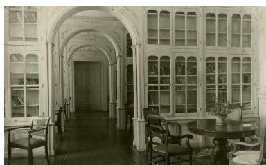
Bibliothèque meublée. Photographie, sans date (vers 1904 ?).