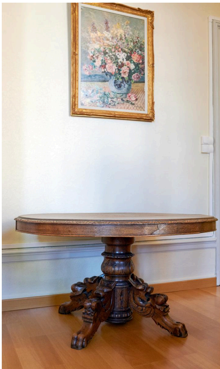
Table ronde avec piètement cental provenant de l'ancienne bibliothèque.