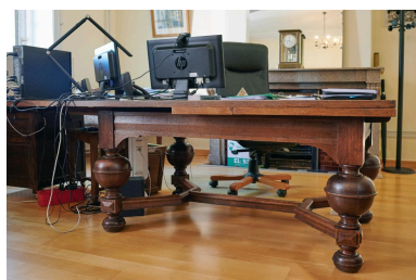
Table servant du bureau. IVR32_20225900281NUCA