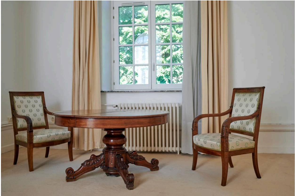
Table ronde à piètement central et deux fauteuils provenant de l'ancienne bibliothèque. Ce mobilier est visible sur la photographie de la bibliothèque produite vers 1904.