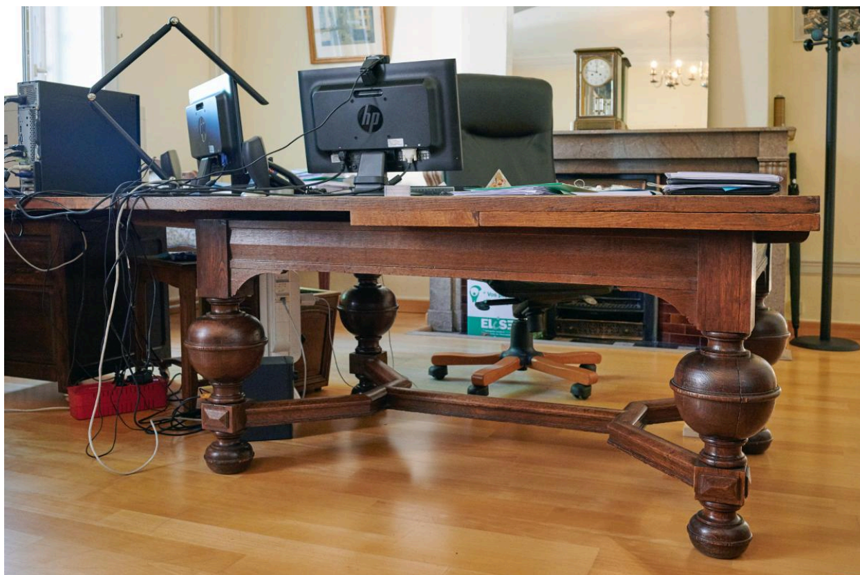
Table servant du bureau.