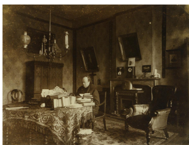
Bureau du directeur. Photographie, avant 1903. On aperçoit au fond à gauche l'armoire qui est toujours conservée dans le lycée. IVR32_20225900206NUCAB