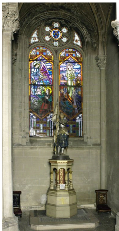
Vue générale. IVR22_20058001870NUCA