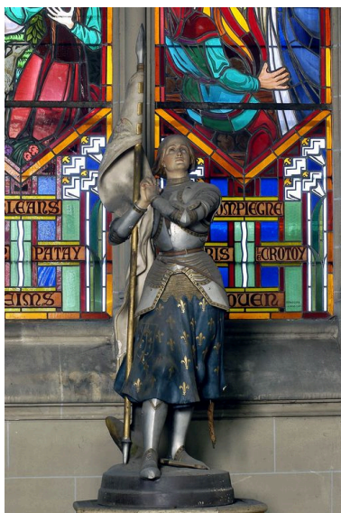
Vue générale. IVR22_20058001871NUCA