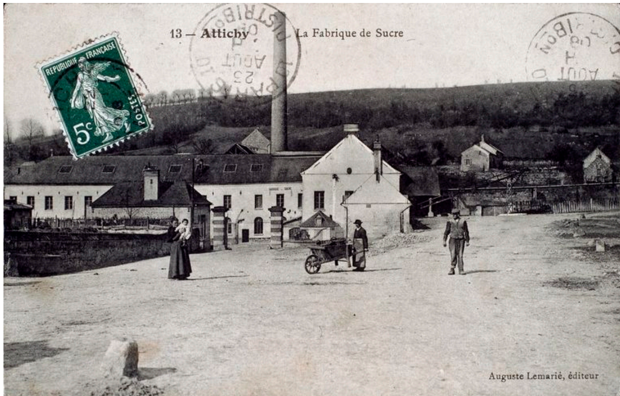
Vue générale de la sucrerie, vers 1900 (AP).