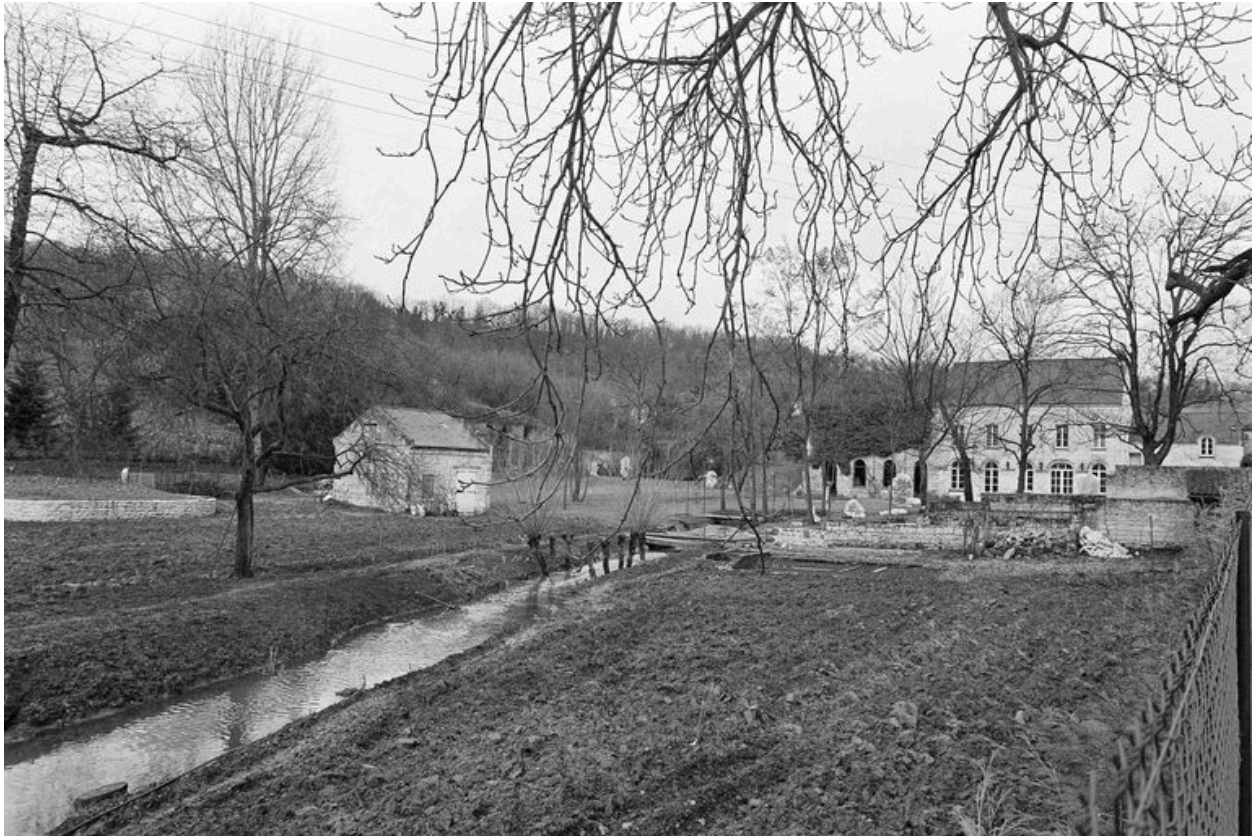
Vue générale sud.