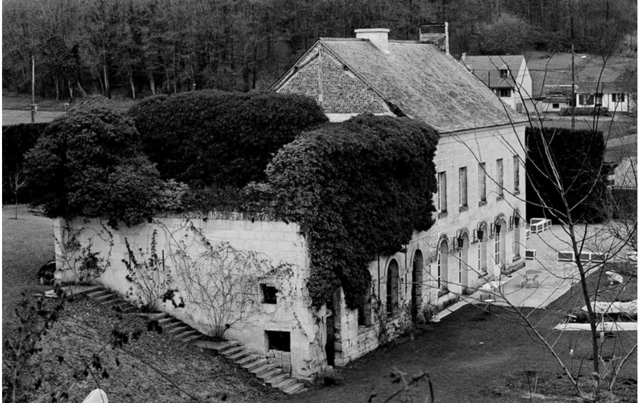
Atelier de fabrication, bâtiment d'eau et logement patronal.