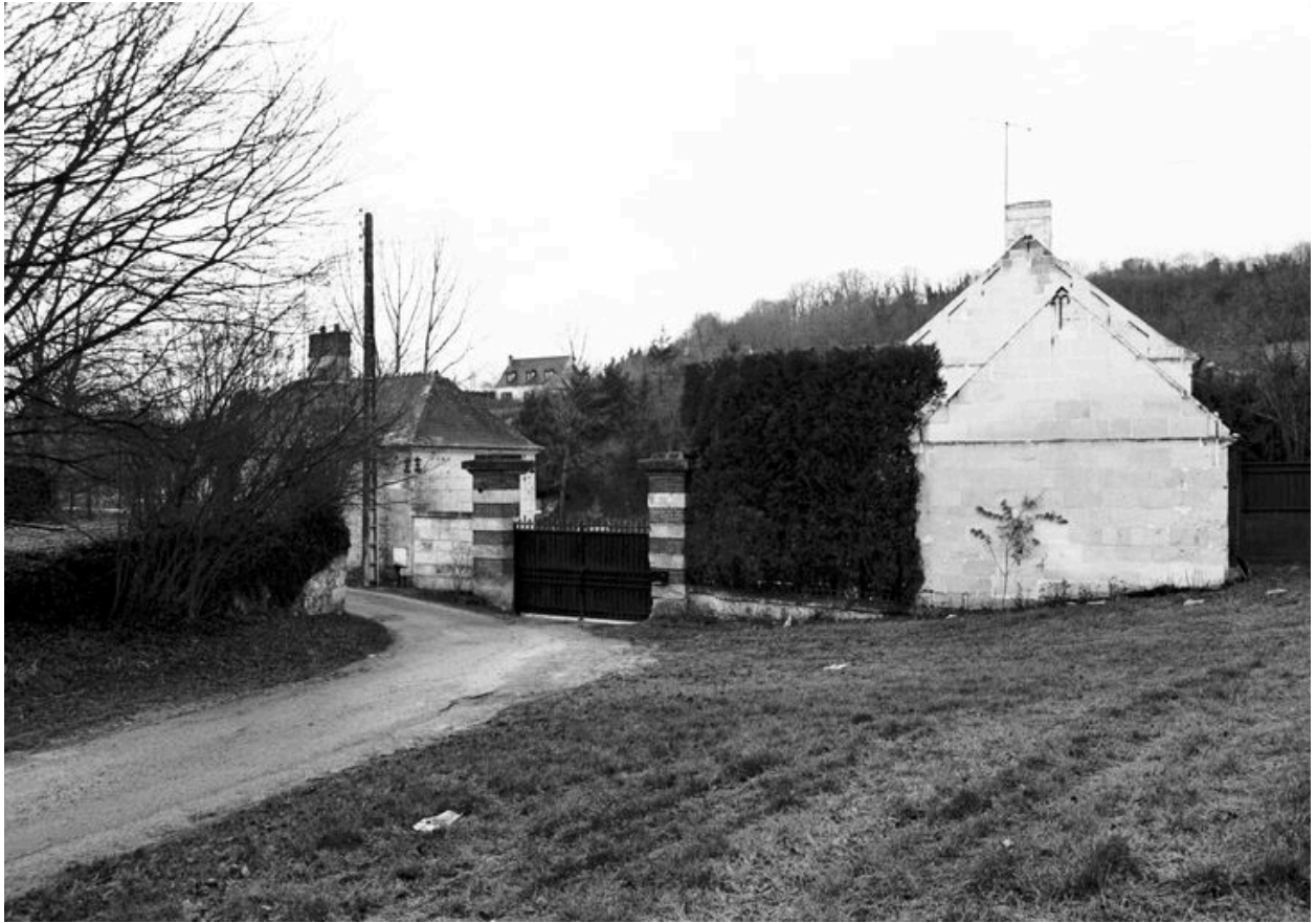
Vue générale de l'entrée de l'usine, avec la conciergerie et le bureau.