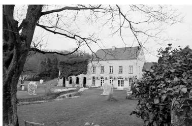
Atelier de fabrication, bâtiment d'eau et logement patronal, façade sud. IVR22_19936002473Z