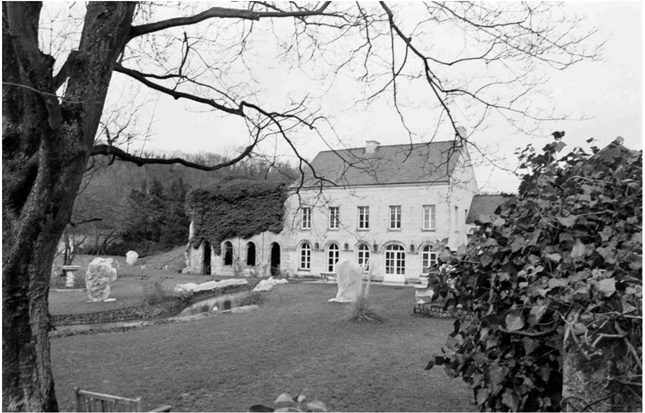
Atelier de fabrication, bâtiment d'eau et logement patronal, façade sud.