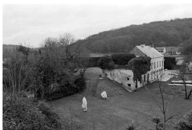
Vue générale. IVR22_19936002475Z