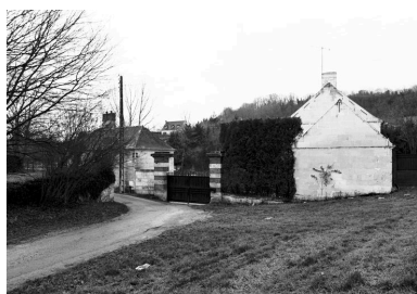
Vue générale de l'entrée de l'usine, avec la conciergerie et le bureau.