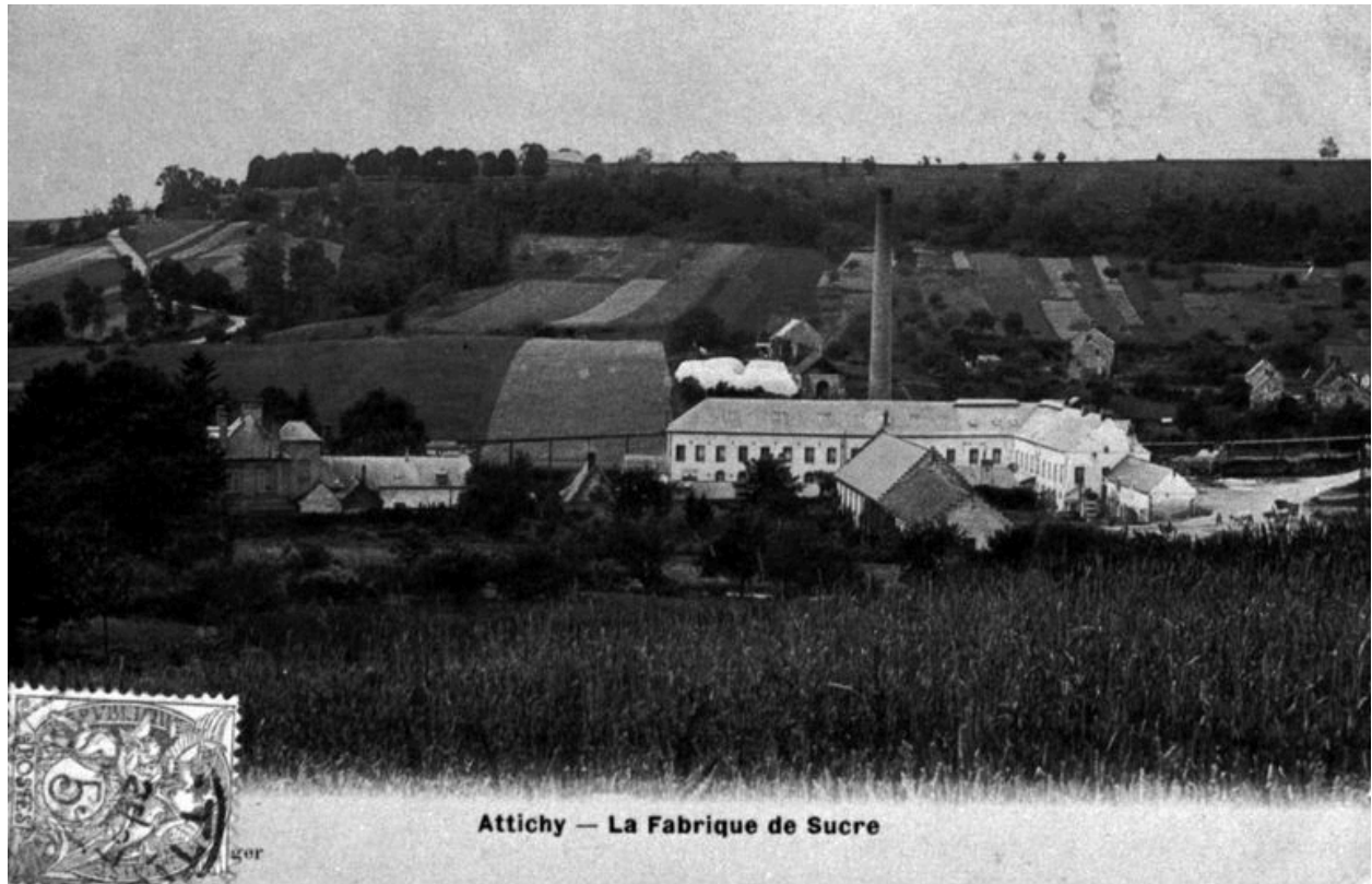
Vue générale de la sucrerie, vers 1900 (AP).