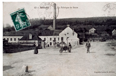
Vue générale de la sucrerie, vers 1900 (AP). IVR22_20106000154XA