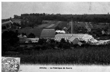
Vue générale de la sucrerie, vers 1900 (AP). IVR22_19936001738ZB