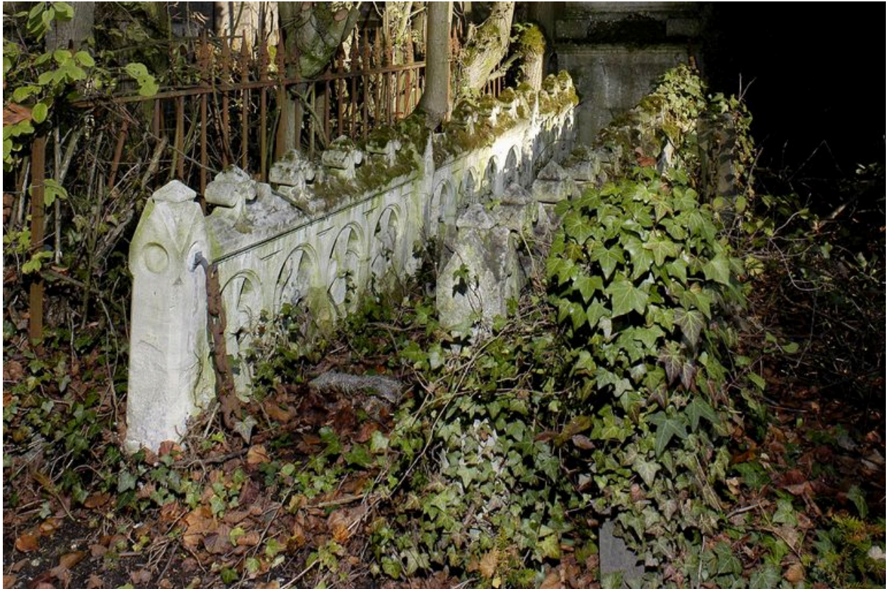
Vue de la clôture.