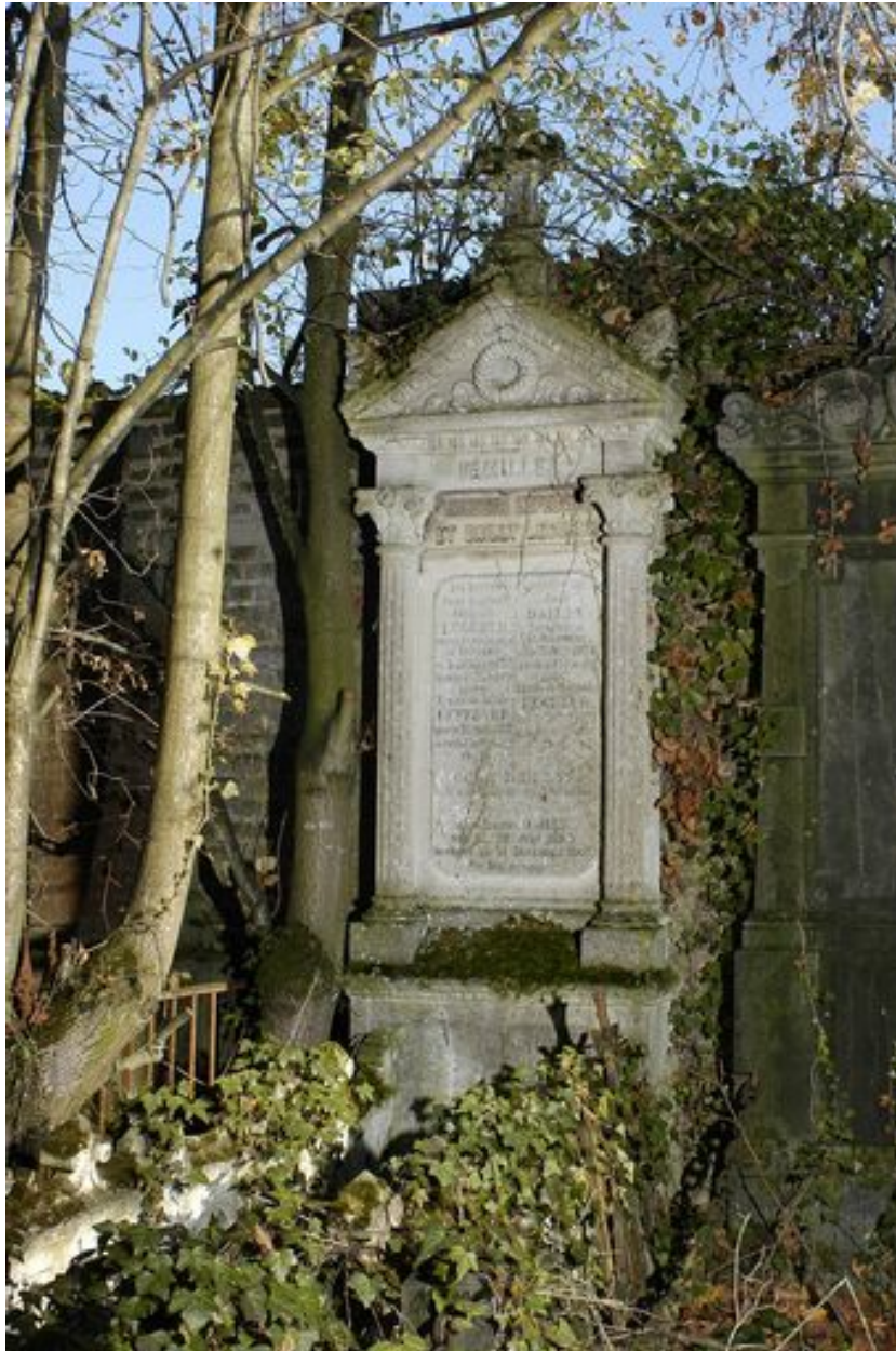
Vue de la stèle.