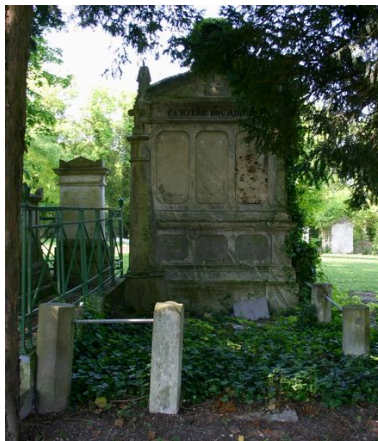
Vue générale. IVR22_20088000530NUCA

IVR22_20088000970NUCA