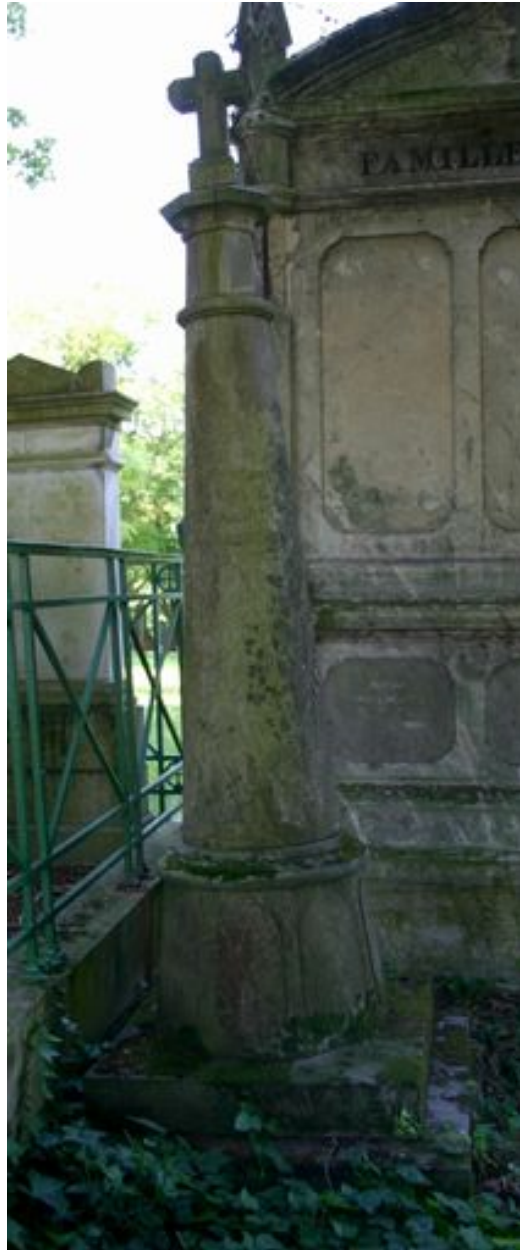
Obélisque, vers 1857.