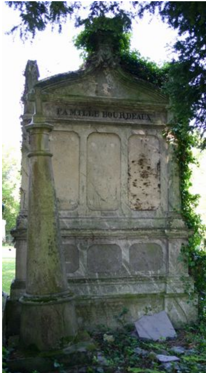
Stèle funéraire de style néogothique, Galempoix (entrepreneur).