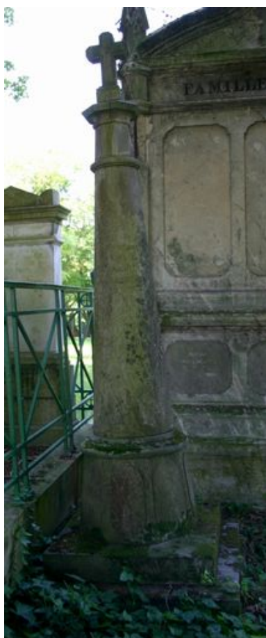
Obélisque, vers 1857.