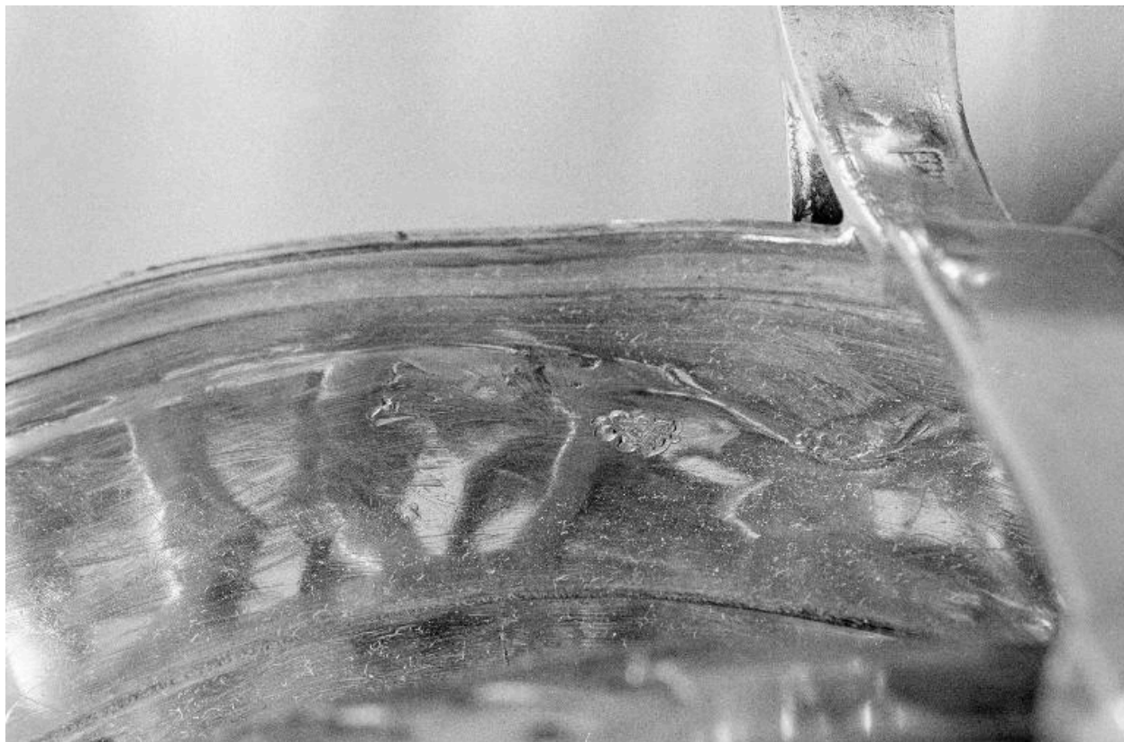
Détail d'un poinçon.