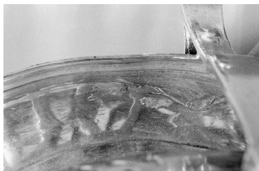
Détail d'un poinçon. IVR22_19956000347Z