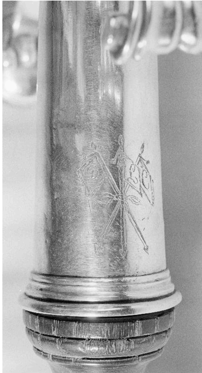
Détail du manche.