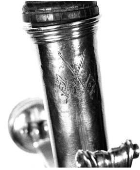
Détail du manche : oriflammes noués en trophée avec lettres DLC. IVR22_19966003905X