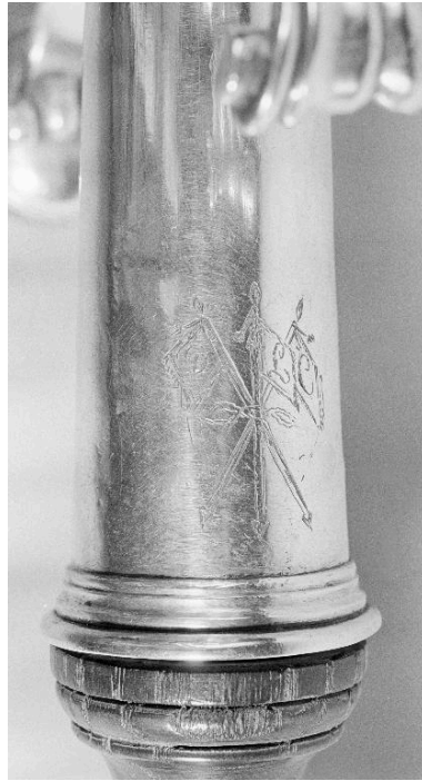
Détail du manche. IVR22_19956000349Z