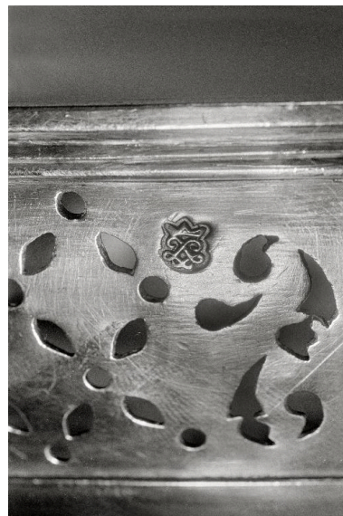
Détail d'un des poinçons. IVR22_19956000348Z