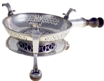
Vue d'ensemble. IVR22_19966003334ZA