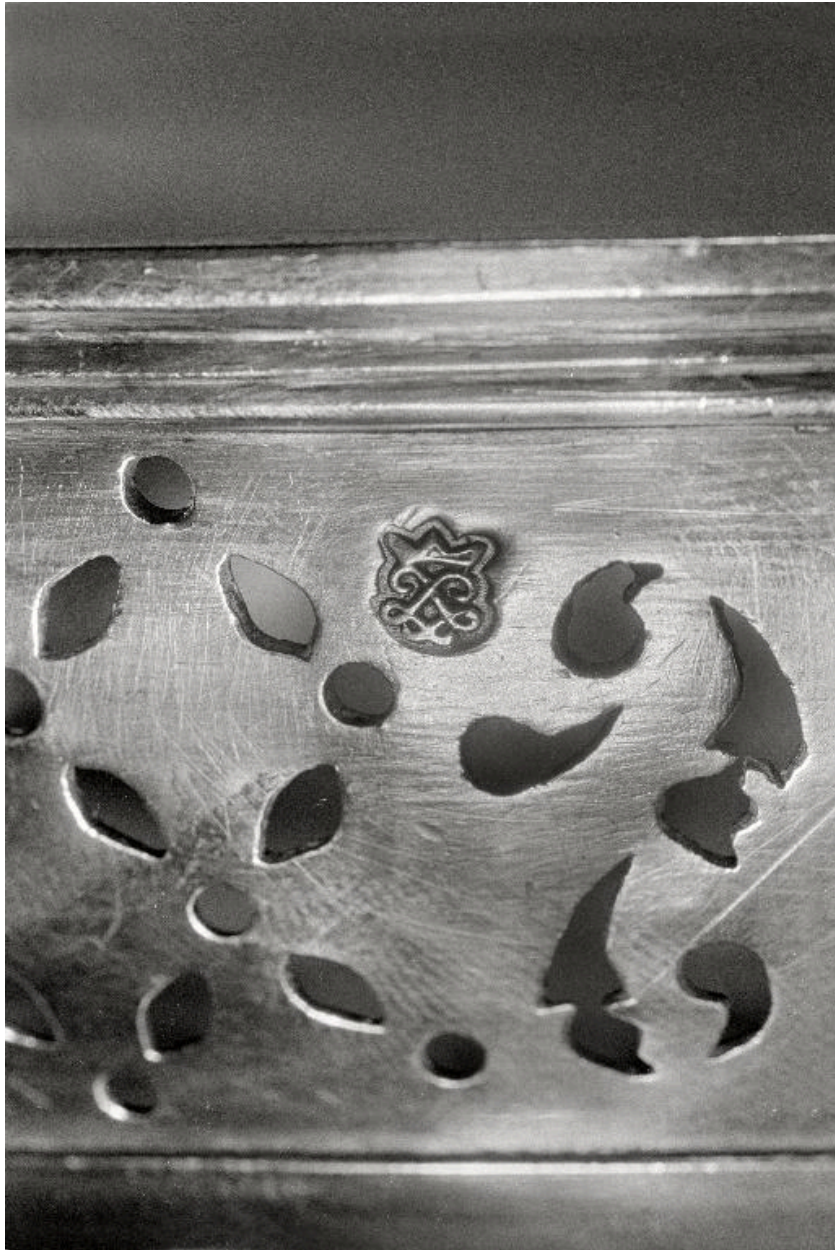
Détail d'un des poinçons.