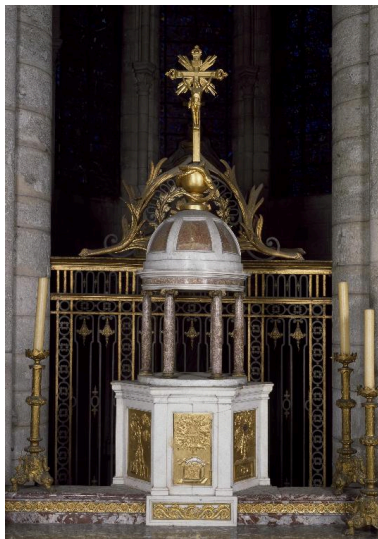
Vue générale du tabernacle et de son exposition.