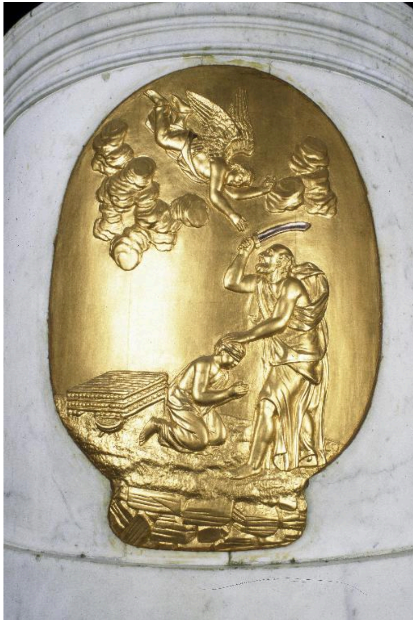
Décor de l'arrière du tabernacle : le sacrifice d'Abraham.