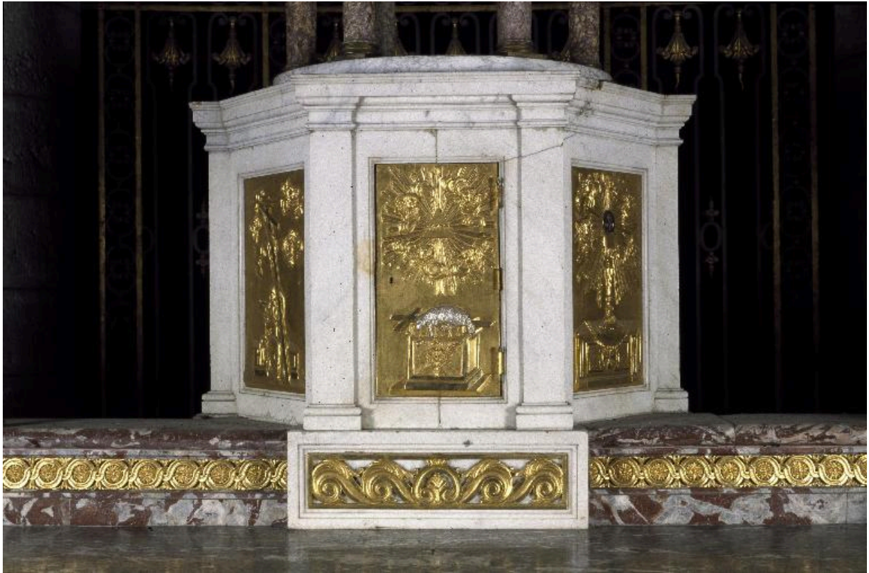
Vue générale du tabernacle.