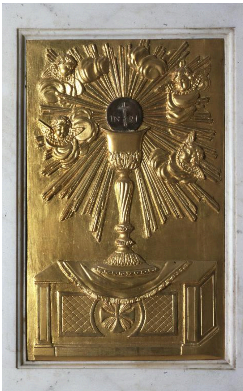
Décor de la partie droite du tabernacle.