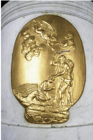
Décor de l'arrière du tabernacle : le sacrifice d'Abraham. IVR22_20010202318ZA