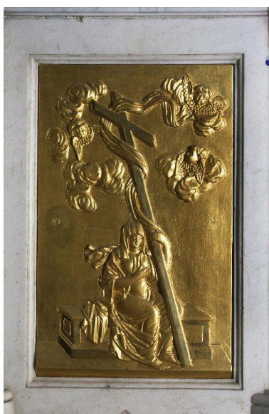
Décor de la partie gauche (nord) du tabernacle. IVR22_20010202316ZA