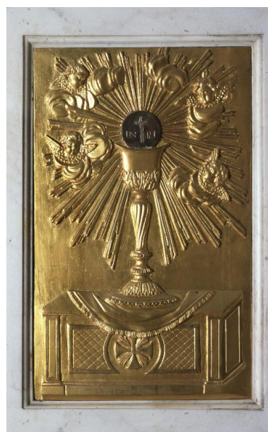
Décor de la partie droite du tabernacle.