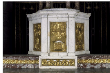
Vue générale du tabernacle. IVR22_20010202314ZA