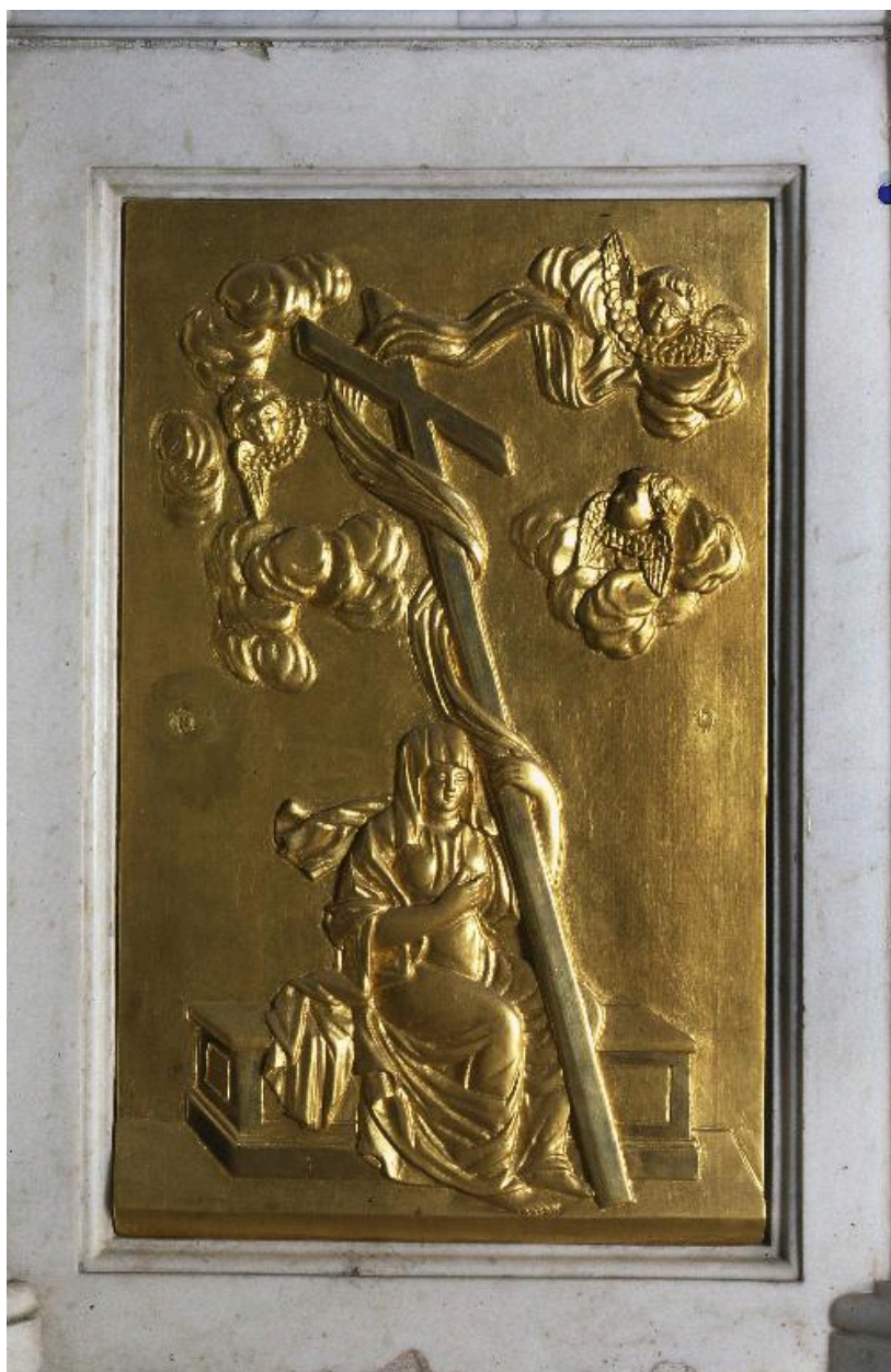
Décor de la partie gauche (nord) du tabernacle.