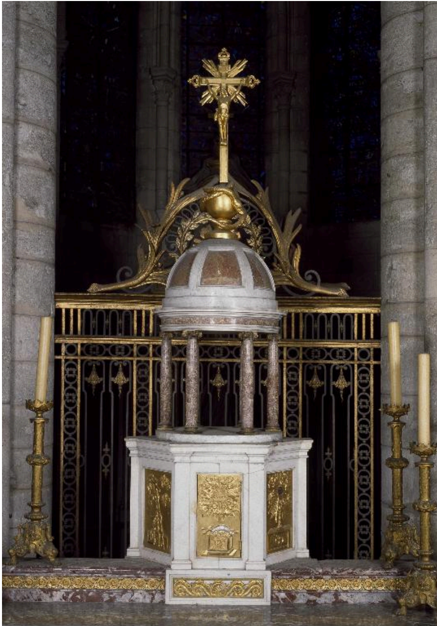
Vue générale du tabernacle et de son exposition.