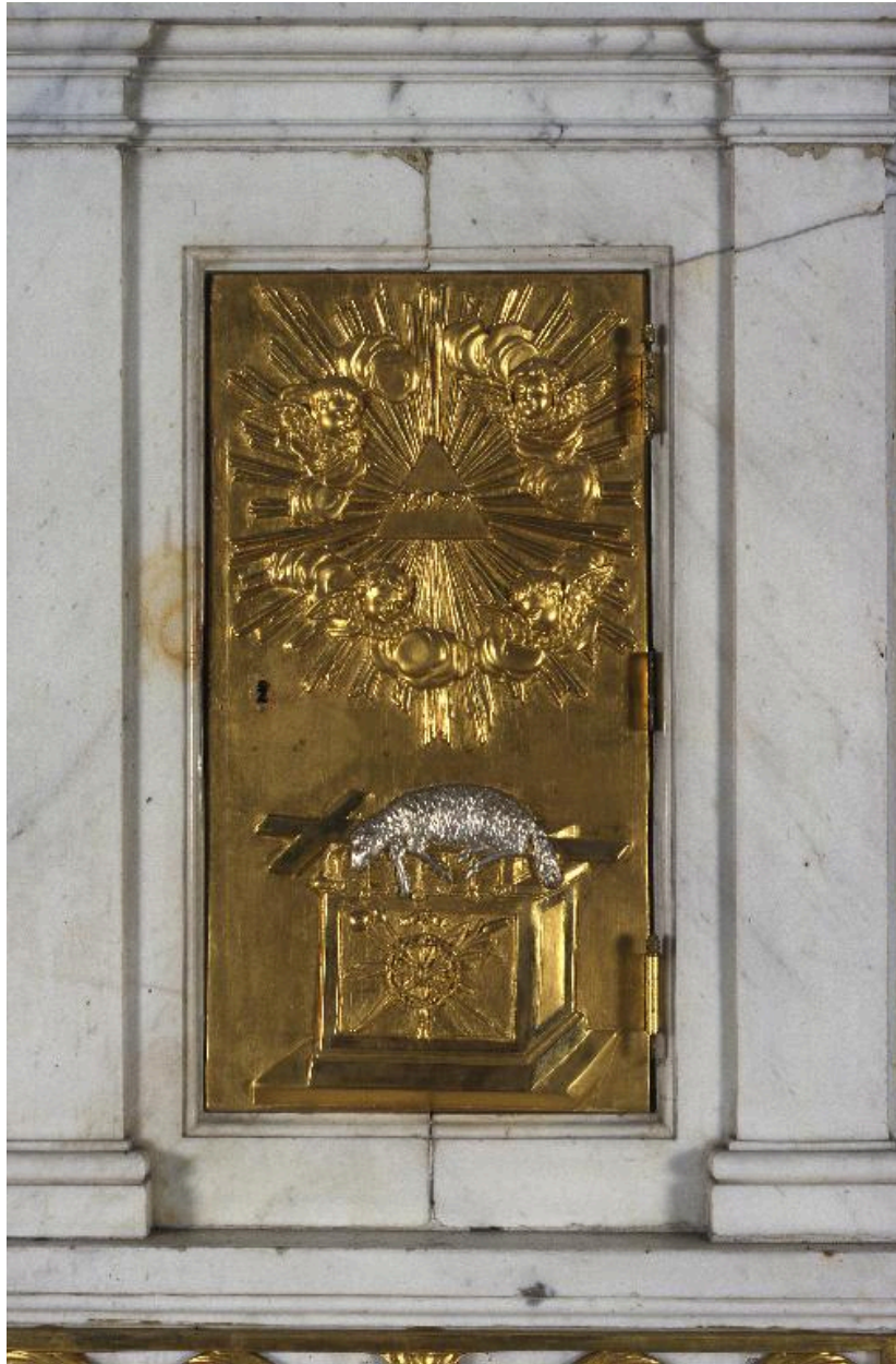
Décor de la porte du tabernacle.