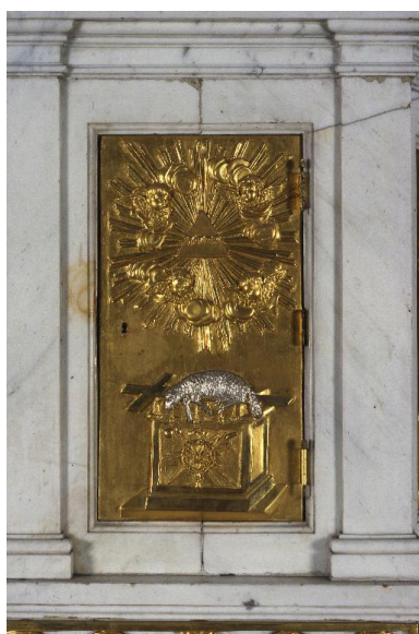
Décor de la porte du tabernacle. IVR22_20010202315ZA