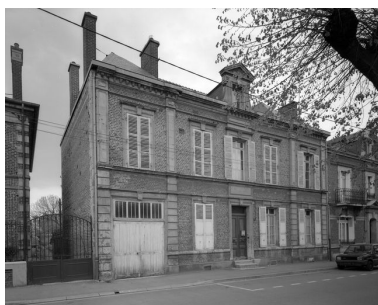
Elévation antérieure. IVR22_19866000061V

Plan de situation. Extrait du plan cadastral de 1974, section AM 160. IVR22_20096000490NUCA