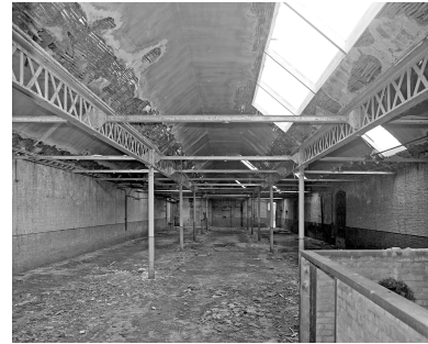
Magasin, vue intérieure.