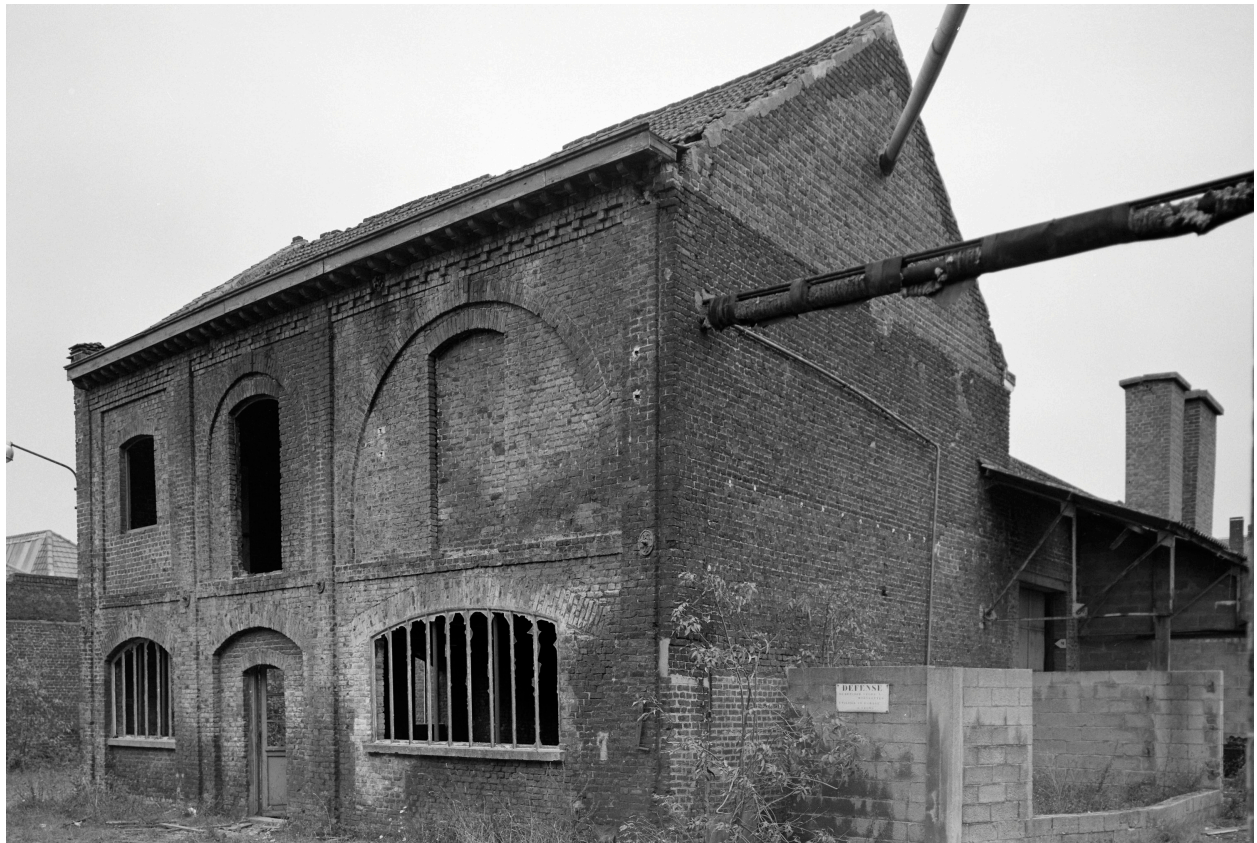
Remise, vue extérieure.