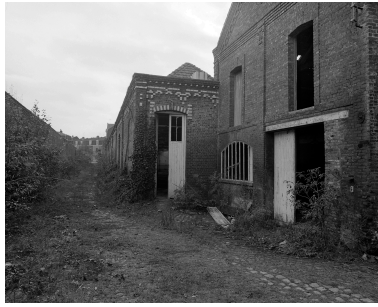
Enfilade entre le mur de clôture et l'atelier de fabrication, vers la rue Victor-Hugo.