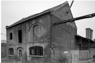
Remise, vue extérieure. IVR31_19885902242X