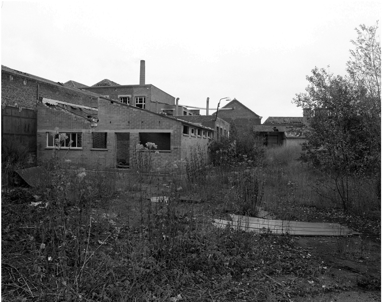
Vue générale vers l'est.