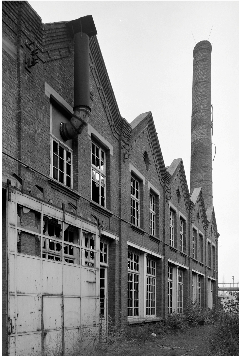
Tissage, élévation est.