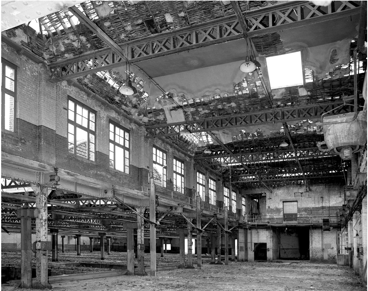
Tissage, vue intérieure.