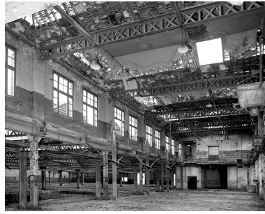
Tissage, vue intérieure. IVR31_19885902226X