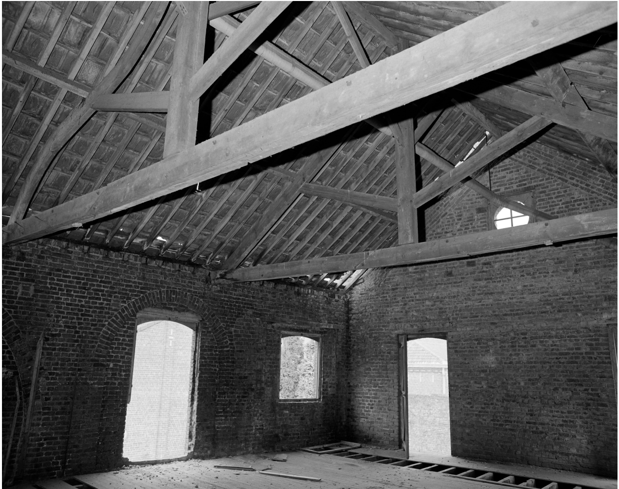
Remise, vue intérieure du premier étage, ferme.