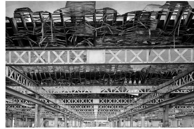
Tissage, détail de la poutraison métallique. IVR31_19885902239X