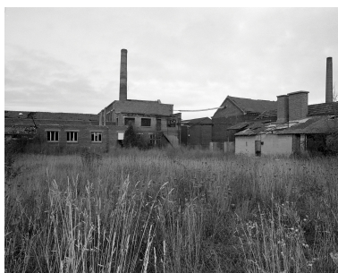
Vue générale vers le nord. IVR31_19885902227X