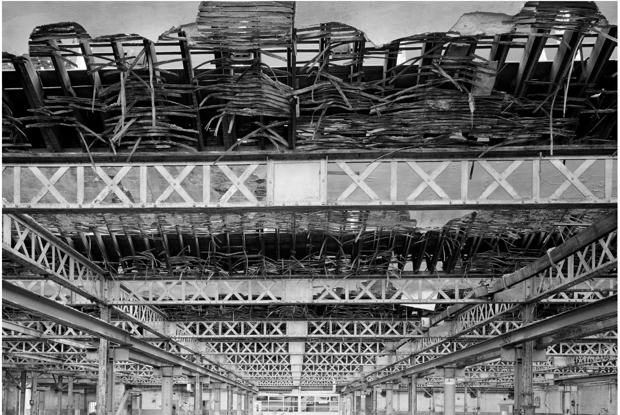
Tissage, détail de la poutraison métallique.