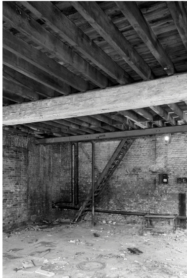
Remise, vue intérieure du rez-de-chaussée.