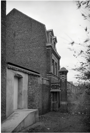
Entrée, conciergerie.