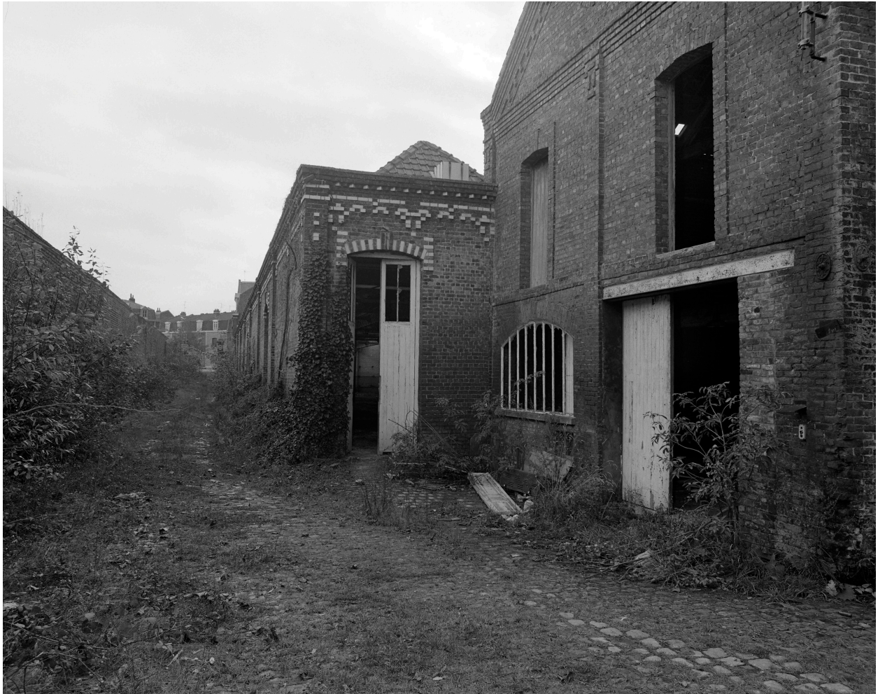
Enfilade entre le mur de clôture et l'atelier de fabrication, vers la rue Victor-Hugo.