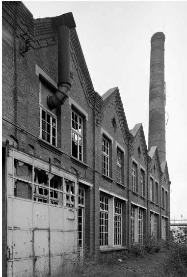
Tissage, élévation est.