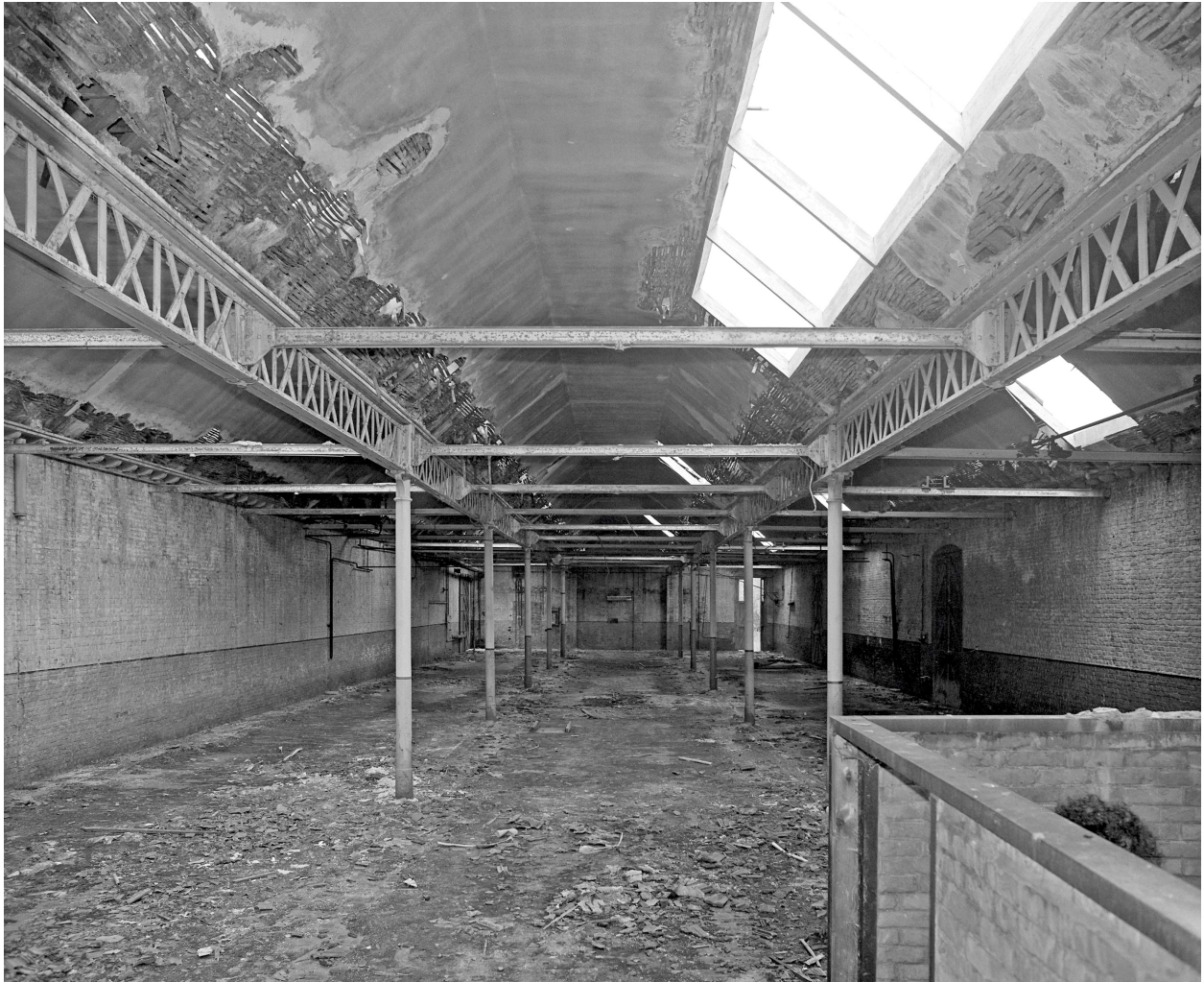
Magasin, vue intérieure.