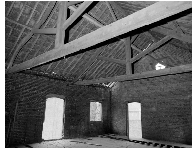
Remise, vue intérieure du premier étage, ferme. IVR31_19885902231X