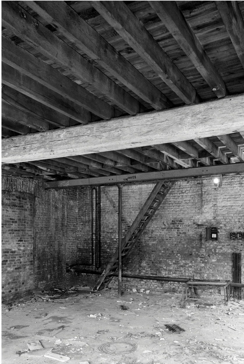
Remise, vue intérieure du rez-de-chaussée.