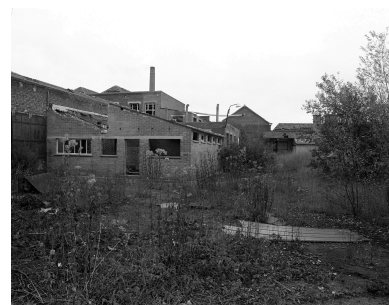
Vue générale vers l'est. IVR31_19885902228X