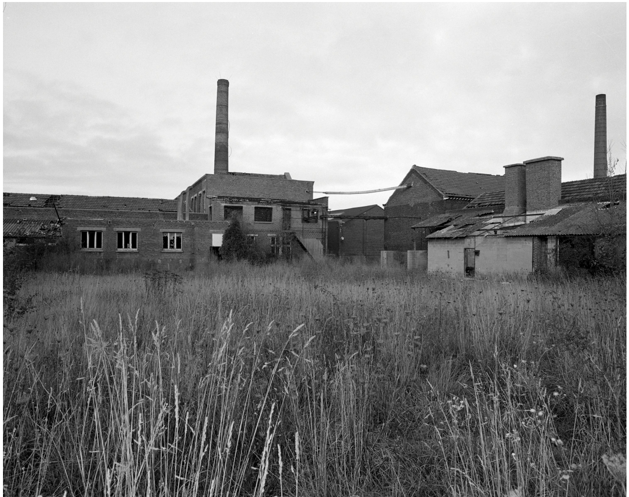
Vue générale vers le nord.