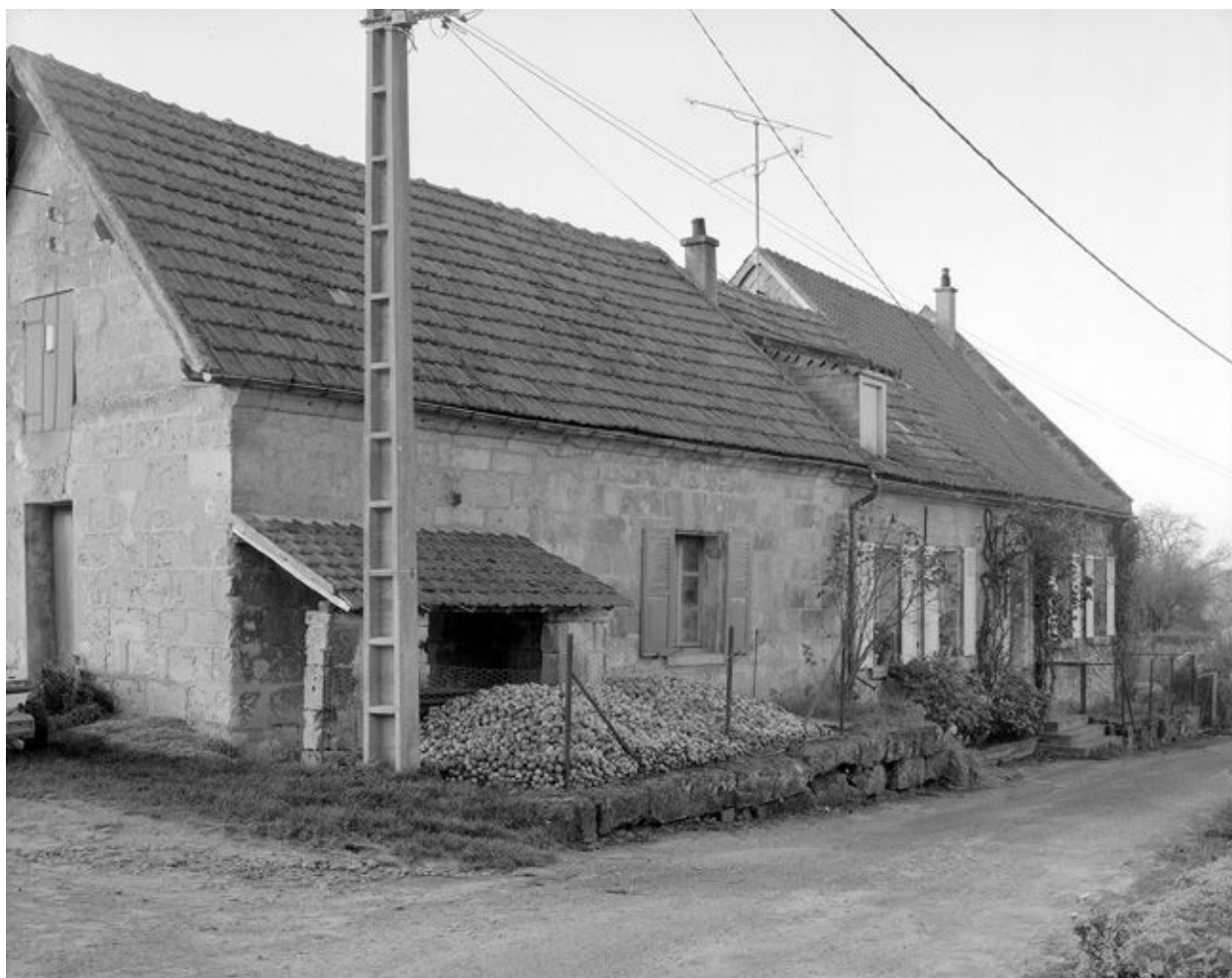
Logis. Vue générale.