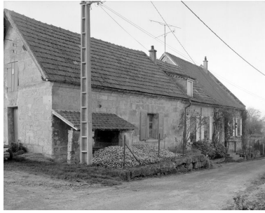
Logis. Vue générale. IVR22_19846001398V

Plan de situation. Extrait du plan cadastral de 1982, section A3 533. IVR22_20096000063NUCA