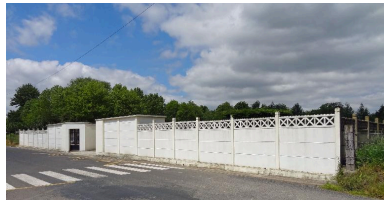
Vue générale depuis la rue de l'Egalité.