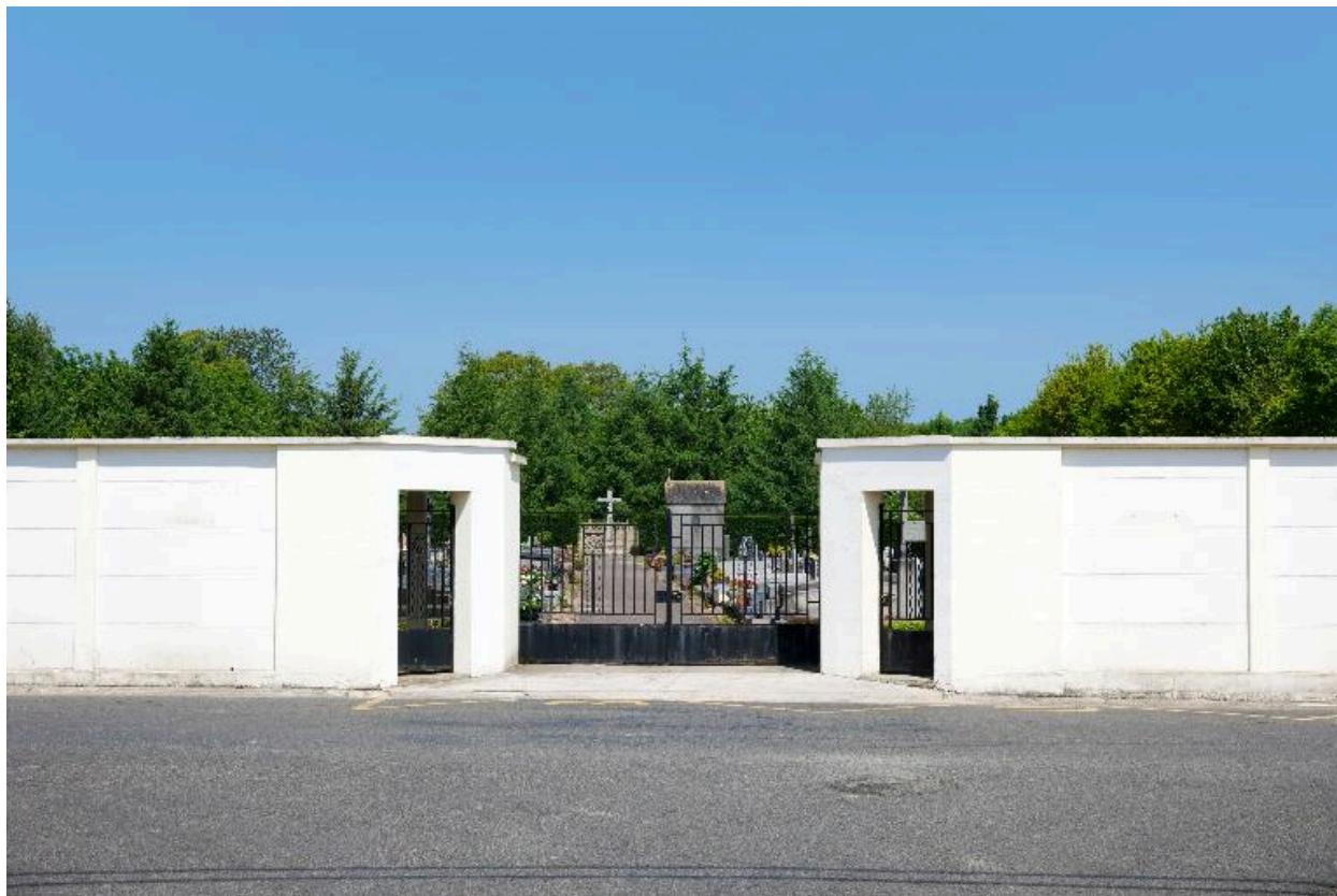
Le portail d'entrée du cimetière depuis la rue de l'Egalité.