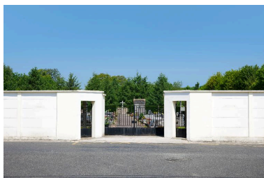
Le portail d'entrée du cimetière depuis la rue de l'Egalité. IVR22_20138000289NUC2A