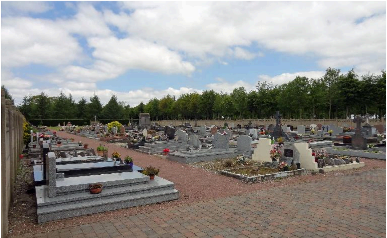
Vue générale du cimetière depuis le sud-ouest.