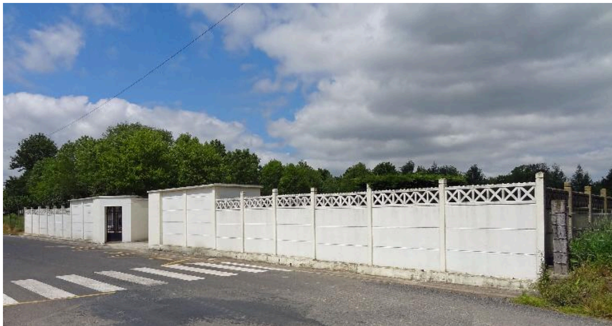
Vue générale depuis la rue de l'Egalité.