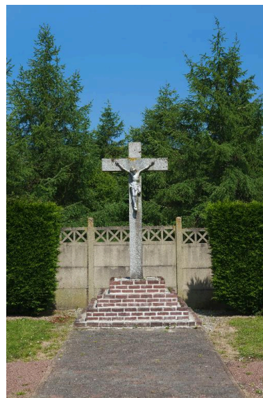
Croix de cimetière située à l'extrémité de l'allée principale. IVR22_20138000291NUC2A