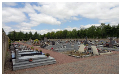
Vue générale du cimetière depuis le sud-ouest. IVR22_20138015717NUCA