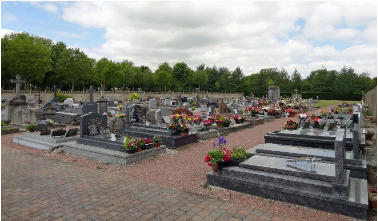
Vue générale du cimetière depuis l'est.