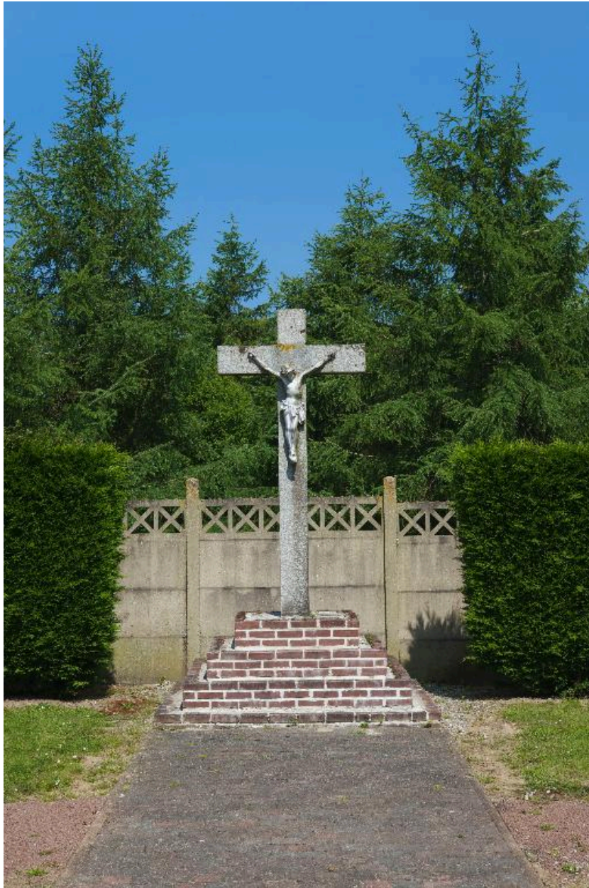
Croix de cimetière située à l'extrémité de l'allée principale.