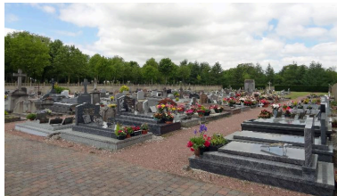
Vue générale du cimetière depuis l'est.