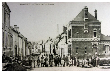
La rue de la Poste, chaussée Brunehaut, avec le nouveau bâtiment de Poste, à droite, vers 1905 (coll. part.). IVR22_20138016021NUC2A