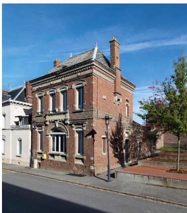
Vue générale. IVR22_20128001016NUC2A