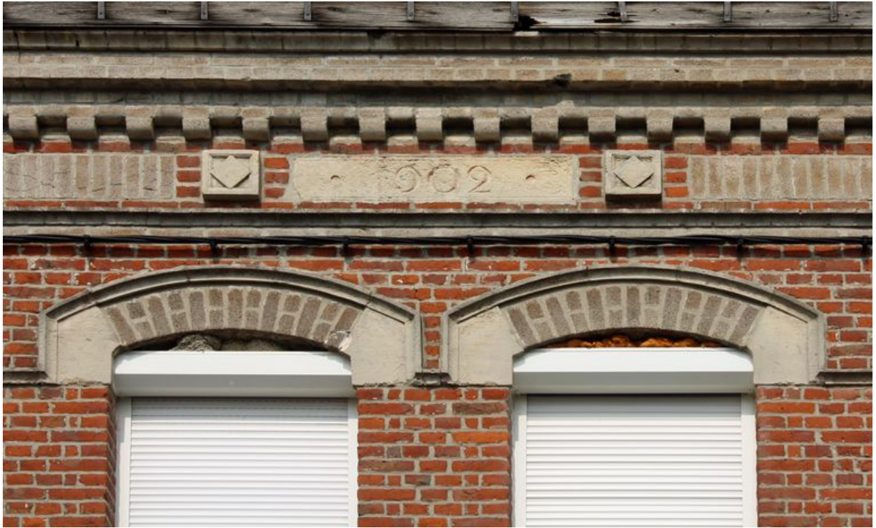
Détail du chronogramme : 1902.