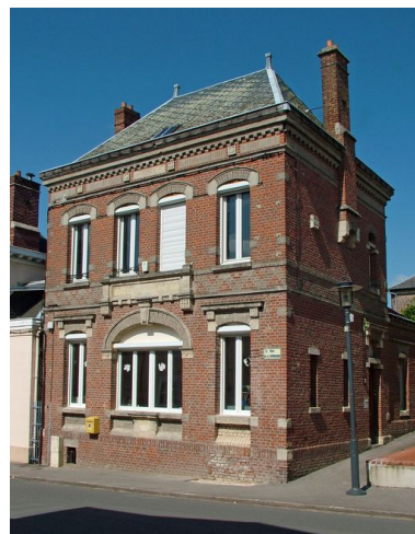
Vue générale. IVR22_20098005823NUCA