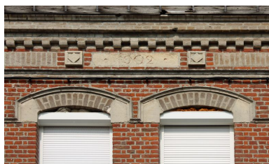
Détail du chronogramme : 1902. IVR22_20098005824NUCA