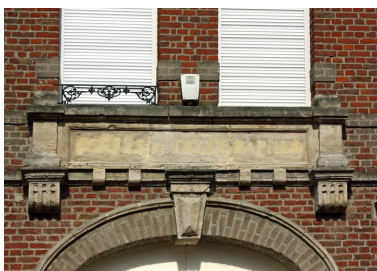
Ancienne poste. Inscription sur la façade : Poste et Télégraphes. IVR22_20098005825NUCA