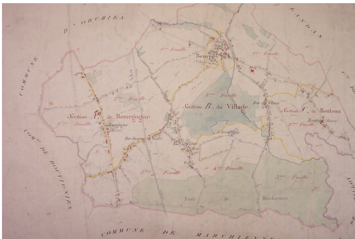
Situation sur le tableau d'assemblage du cadastre de 1875 (AD Nord : Série P (cadastre) : P31/419).