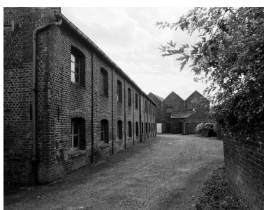
Vue intérieure de la cour, partie originelle des bâtiments industriels.