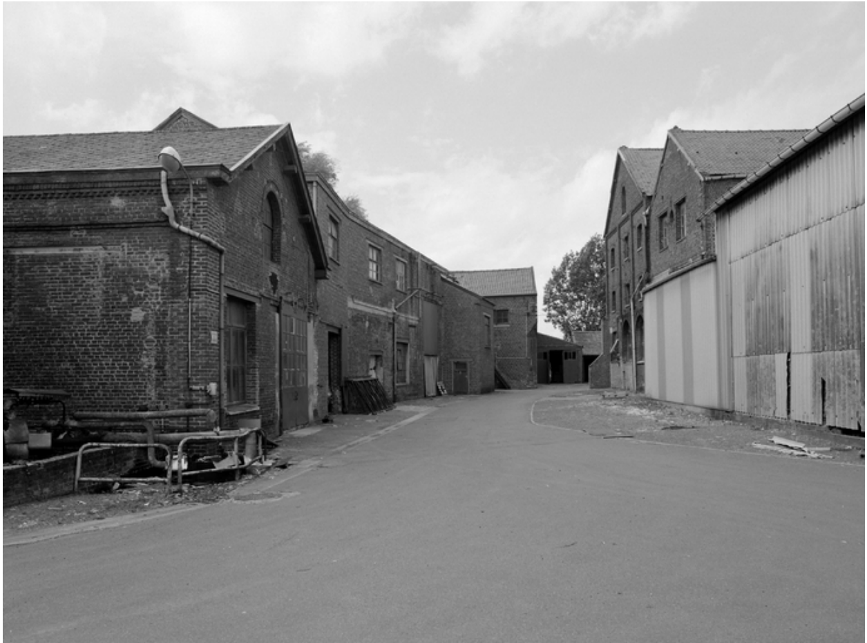
Vue intérieure de la cour, bâtiments industriels.