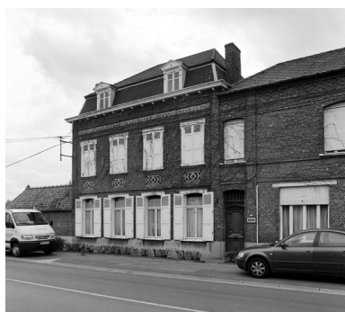
Façade sur rue de la maison patronale.