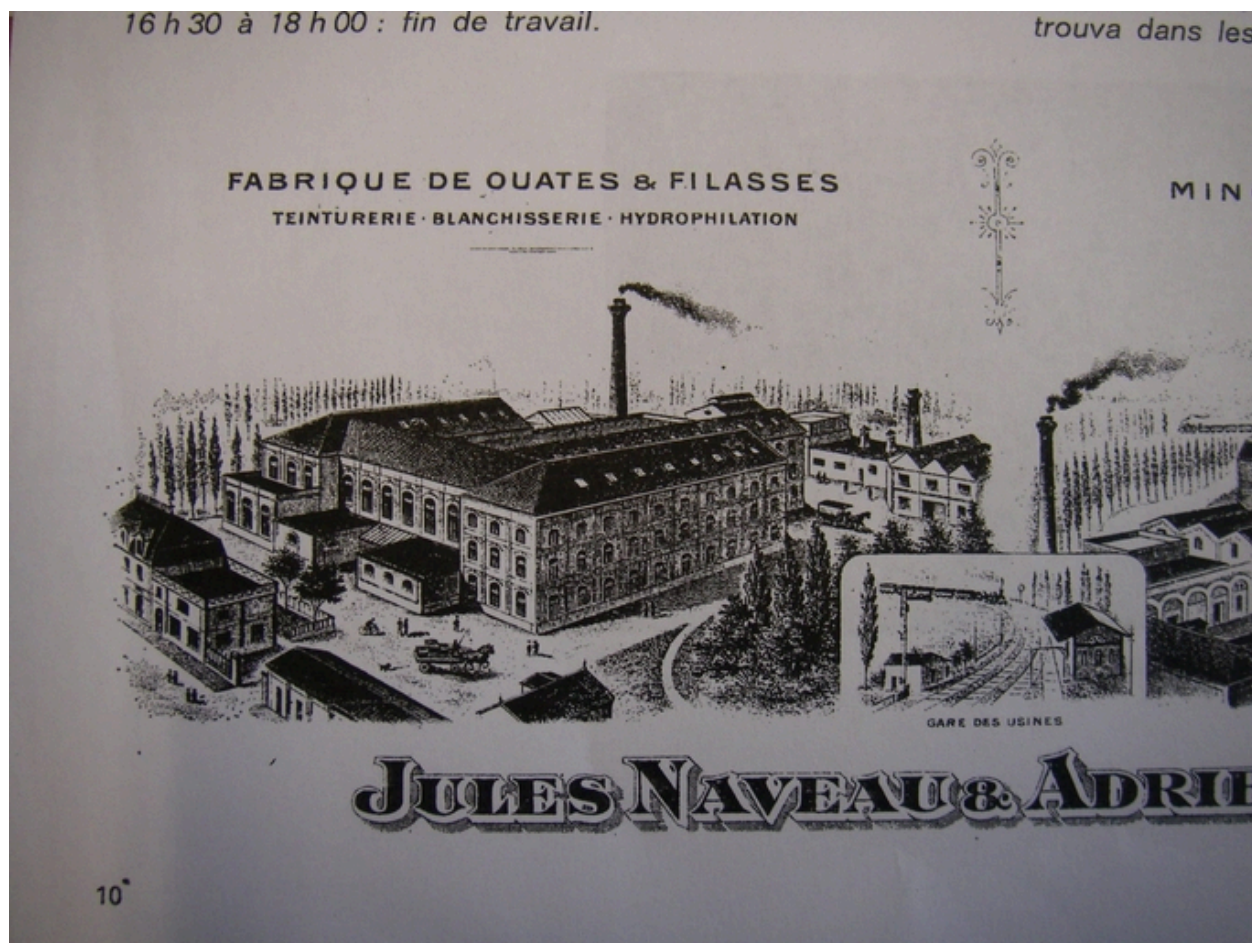
Papier à entête, détail représentant l'usine, fin 19e siècle (AD Nord M 417 / pièce n° 1033).