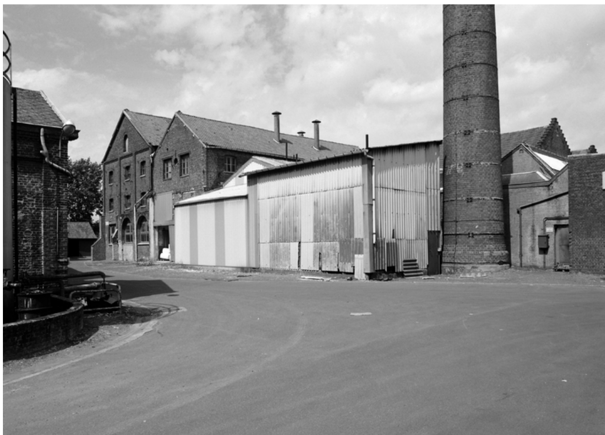
Vue intérieure de la cour, bâtiments industriels et cheminée.