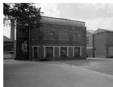
Vue intérieure de la cour, travée originelle des bâtiments industriels.