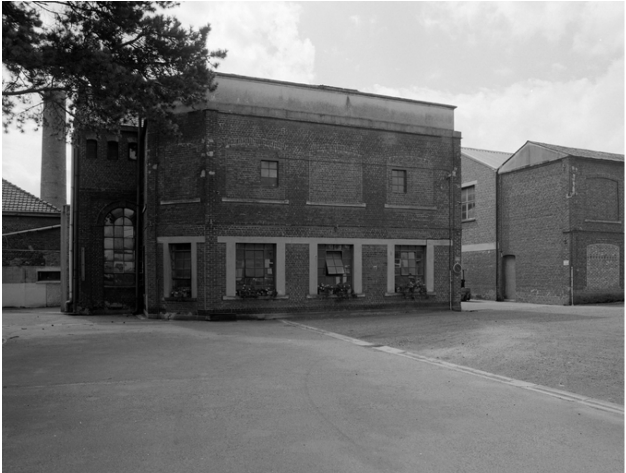
Vue intérieure de la cour, travée originelle des bâtiments industriels.