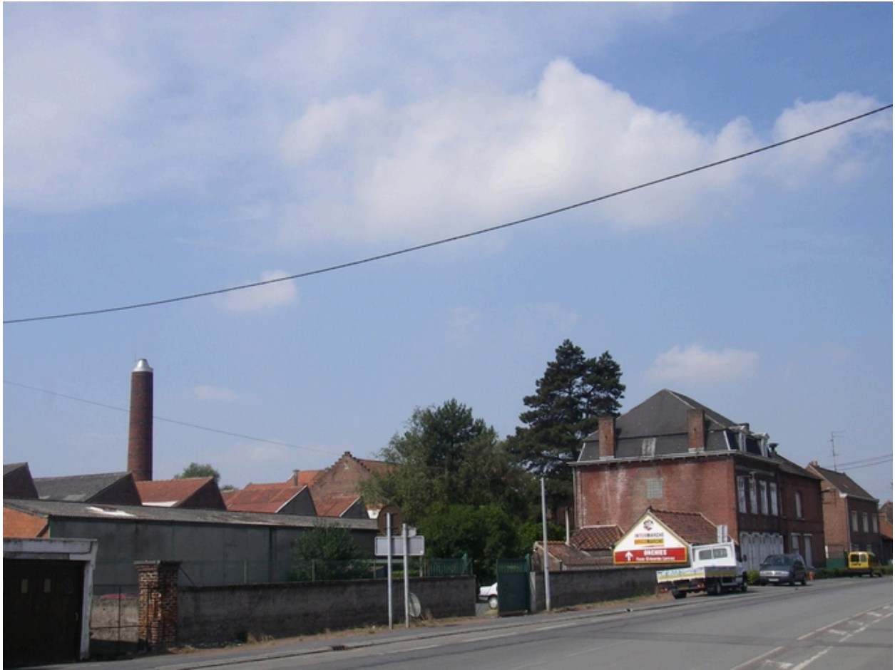
Vue générale de l'usine depuis la rue.