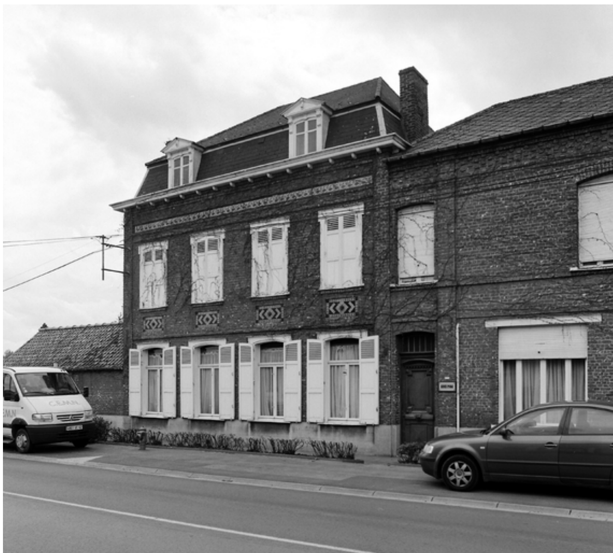
Façade sur rue de la maison patronale.