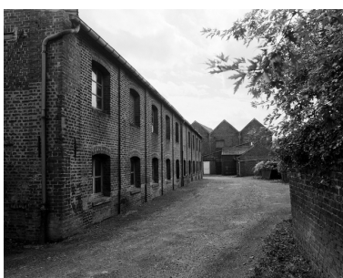
Vue intérieure de la cour, partie originelle des bâtiments industriels. IVR31_20045900395X