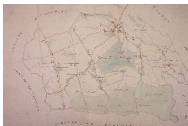
Situation sur le tableau d'assemblage du cadastre de 1875 (AD Nord : Série P (cadastre) : P31/419).