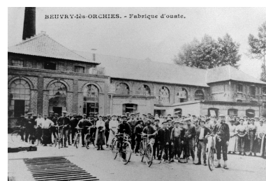
Carte postale de l'usine vers 1900 (Archives privées). Phot. Philippe Dapvril