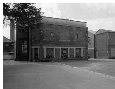
Vue intérieure de la cour, travée originelle des bâtiments industriels.