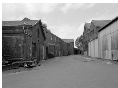
Vue intérieure de la cour, bâtiments industriels. IVR31_20045900394X