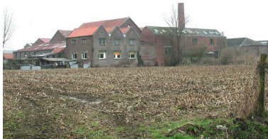
Vue générale arrière de l'usine. IVR31_20055907376NUCA

Papier à entête, détail représentant l'usine, fin 19e siècle (AD Nord M 417 / pièce n° 1033). IVR31_20055907374NUCA