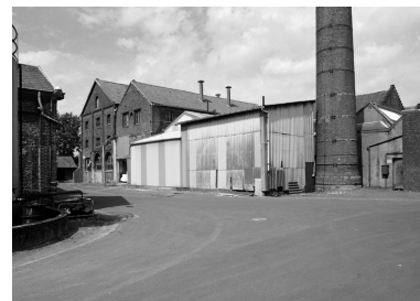
Vue intérieure de la cour, bâtiments industriels et cheminée.