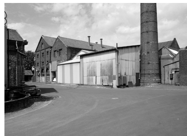
Vue intérieure de la cour, bâtiments industriels et cheminée.