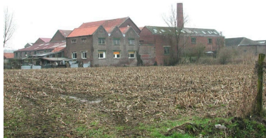
Vue générale arrière de l'usine. IVR31_20055907376NUCA

Papier à entête, détail représentant l'usine, fin 19e siècle (AD Nord M 417 / pièce n° 1033). IVR31_20055907374NUCA