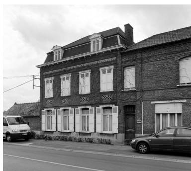
Façade sur rue de la maison patronale. IVR31_20045900524X