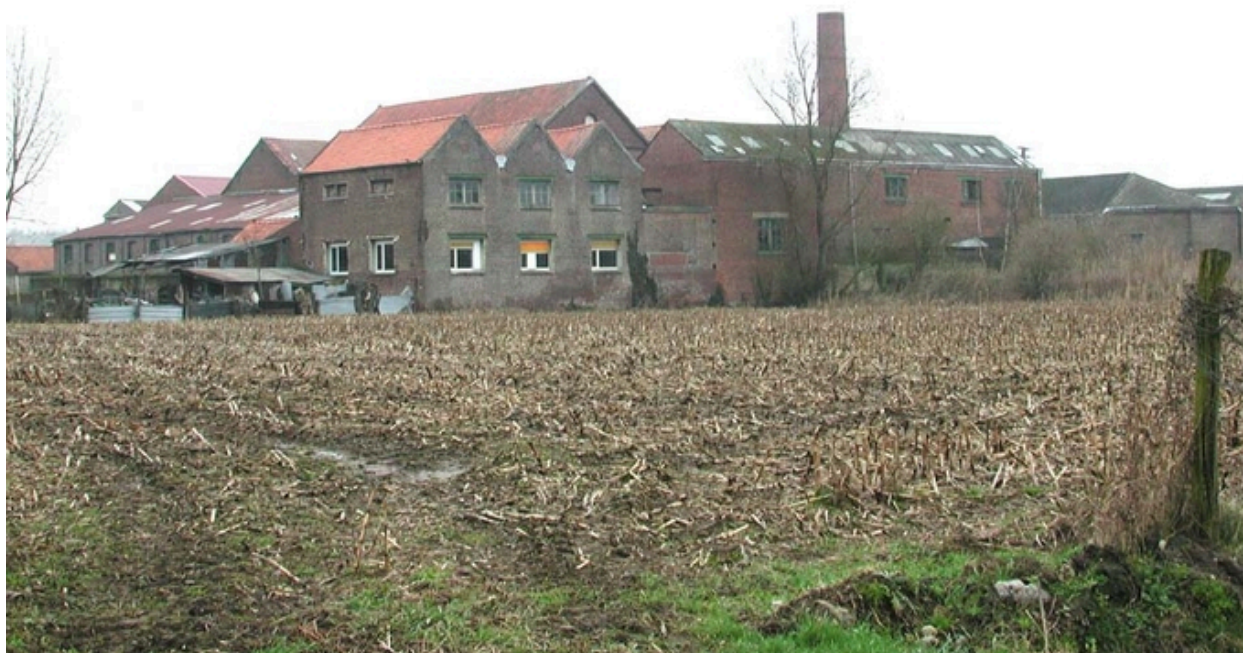
Vue générale arrière de l'usine.