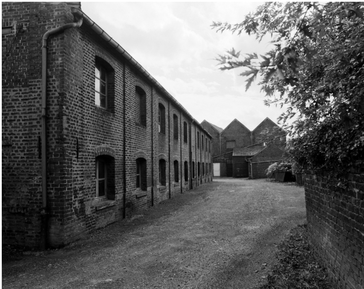
Vue intérieure de la cour, partie originelle des bâtiments industriels.