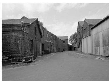
Vue intérieure de la cour, bâtiments industriels.