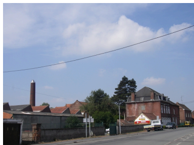
Vue générale de l'usine depuis la rue. IVR31_20055907375NUCA

IVR31_20055907359NUCA