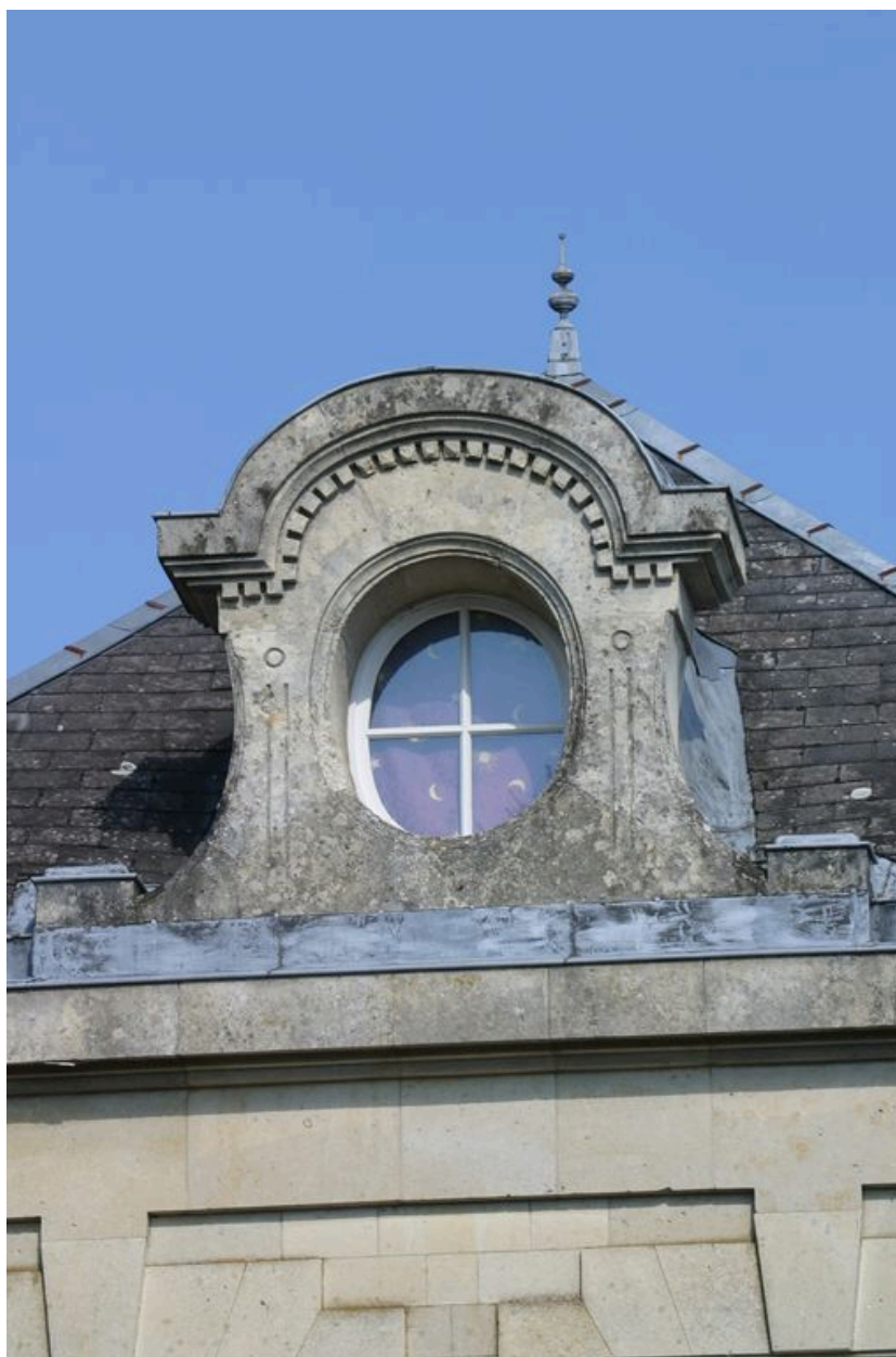
Détail d'une lucarne.