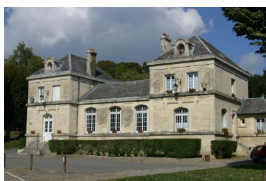
Vue générale. IVR22_20030202046NUCA