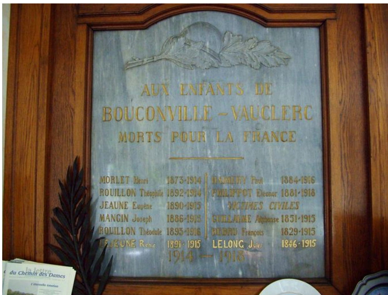
Vue de la plaque commémorative située dans la salle de la mairie.