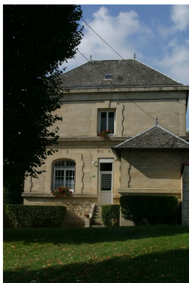
Vue latérale. IVR22_20030202049NUCA