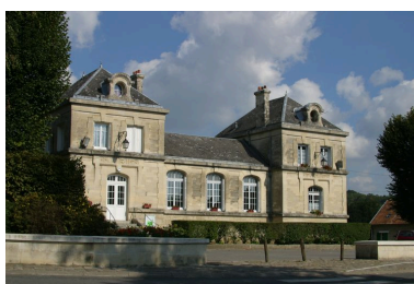
Vue générale. IVR22_20030202047NUCA