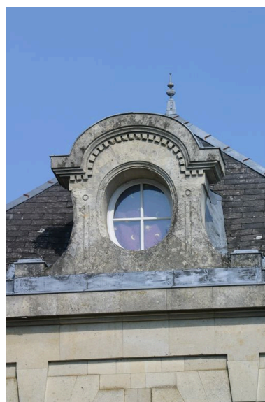
Détail d'une lucarne.