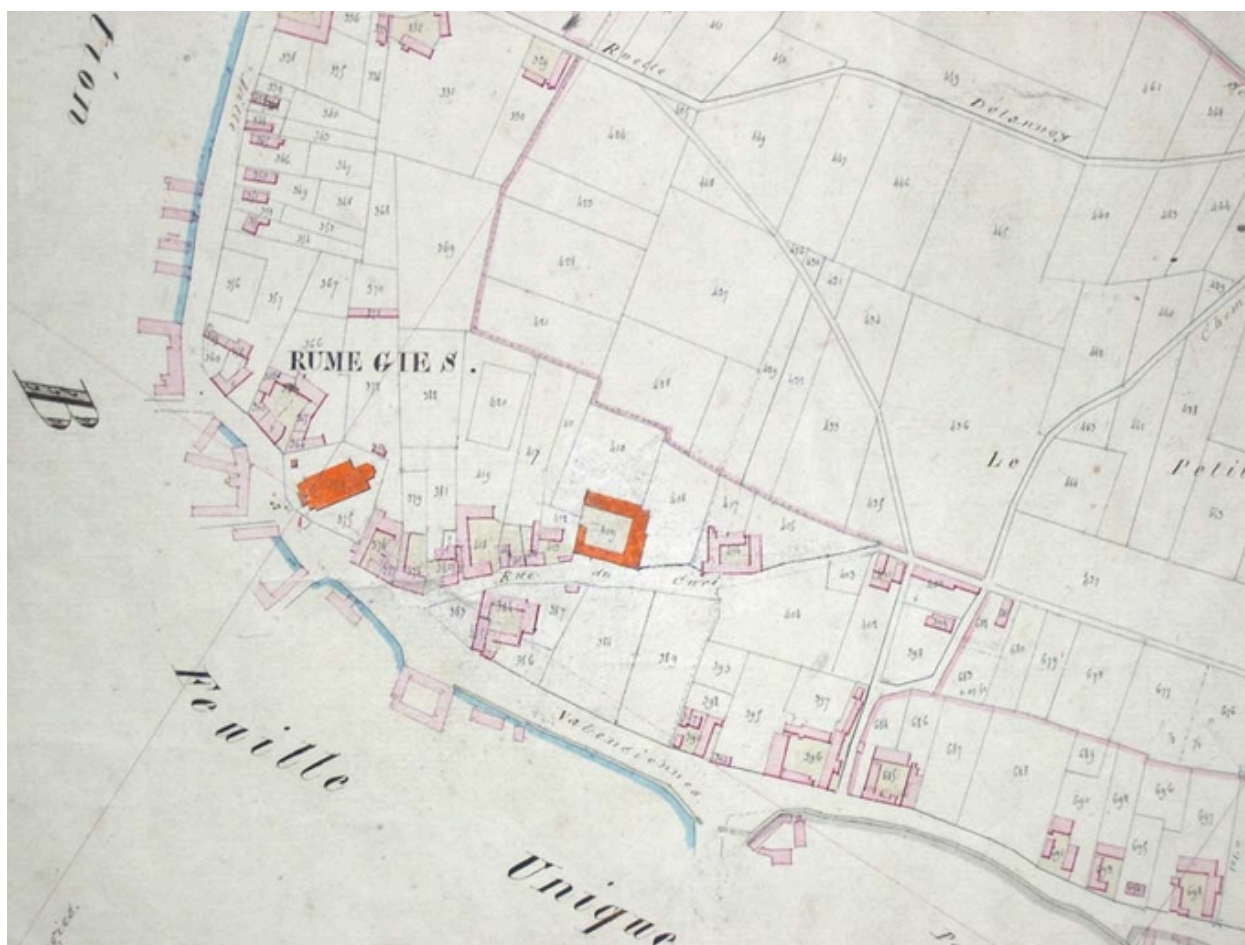
Cadastre de 1830, détail de la feuille D2 (AD Nord : P31/626).