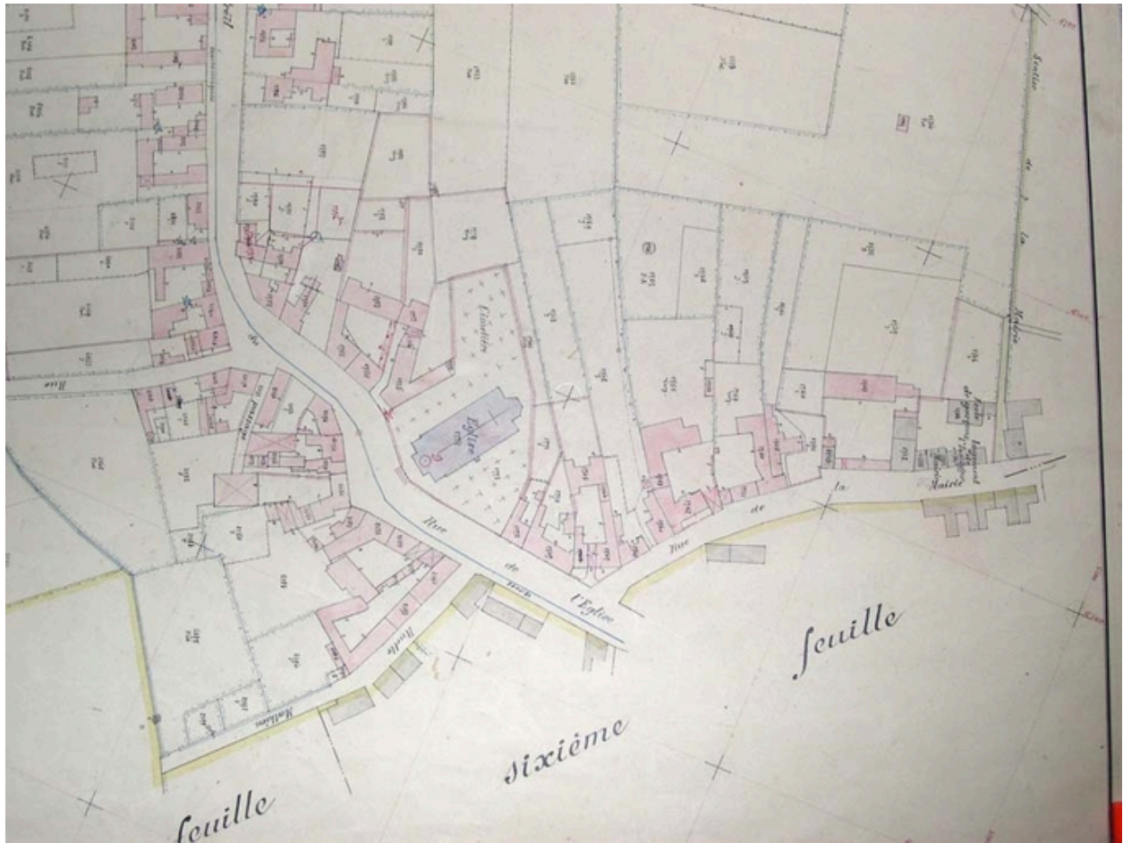
Plan de situation. Cadastre de 1913, 5e feuille, extrait (AD Nord : P31/626).