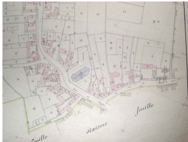
Plan de situation. Cadastre de 1913, 5e feuille, extrait (AD Nord : P31/626). IVR31_20045905501NUCA