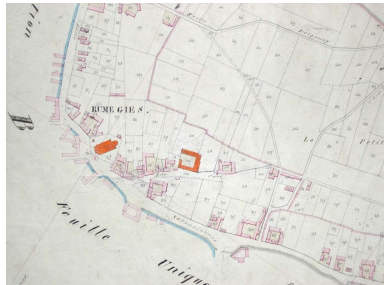
Cadastré de 1830, détail de la feuille D2 (AD Nord : P31/626). IVR31_20045905491NUCA