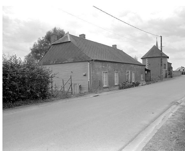
Vue générale. IVR22_19980202894X