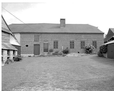
Vue générale. IVR22_19980202925X