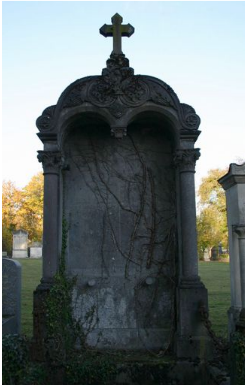
Tombeau en forme de niche monumentale, de style néoclassique.