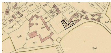
Plan-masse et de situation de l'édifice, extrait de la section B du plan cadastral de 1835 (AD Aisne : 3P0915_03).