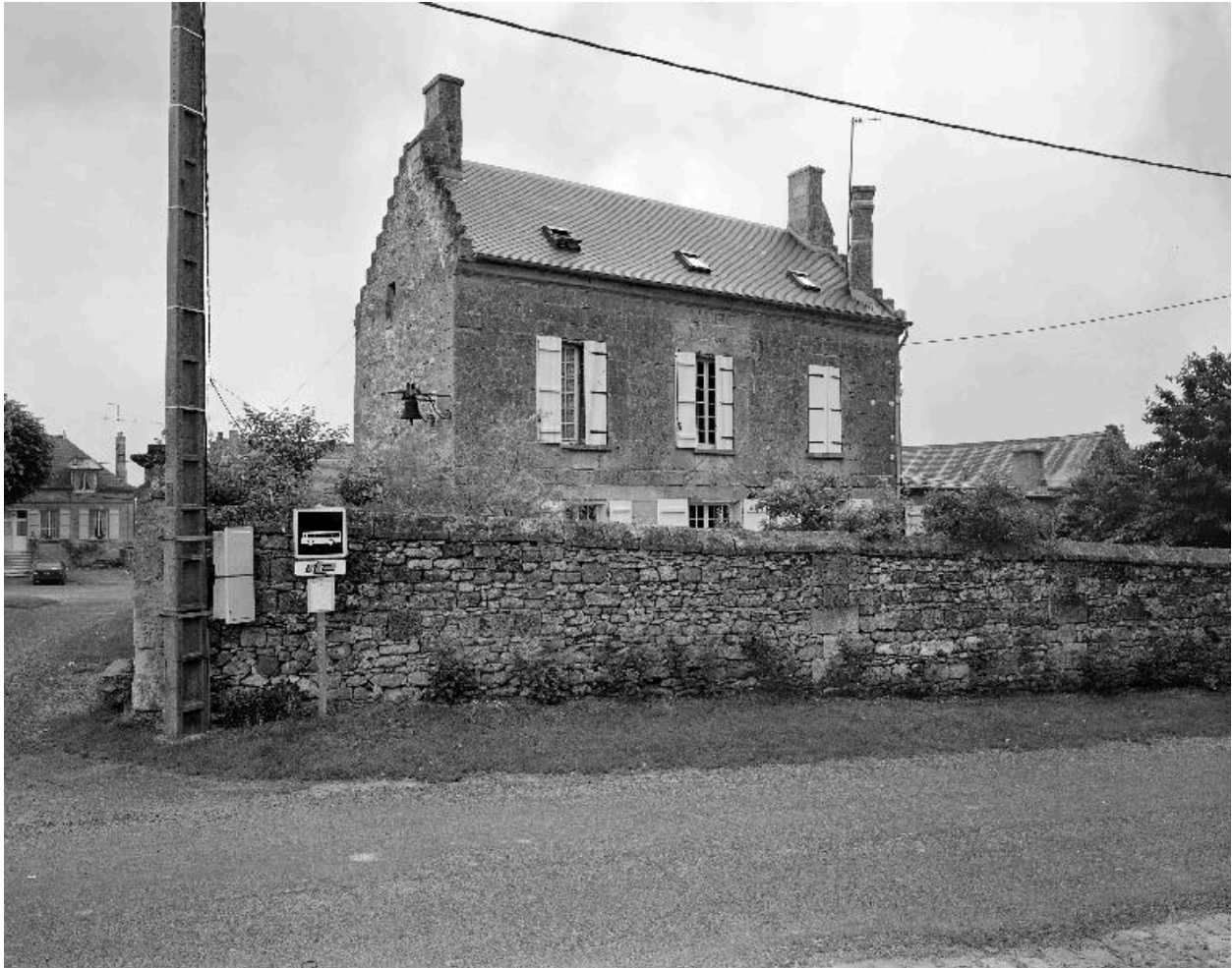
Vue générale depuis l'ouest.