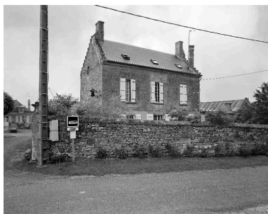
Vue générale depuis l'ouest. IVR22_19900201116V