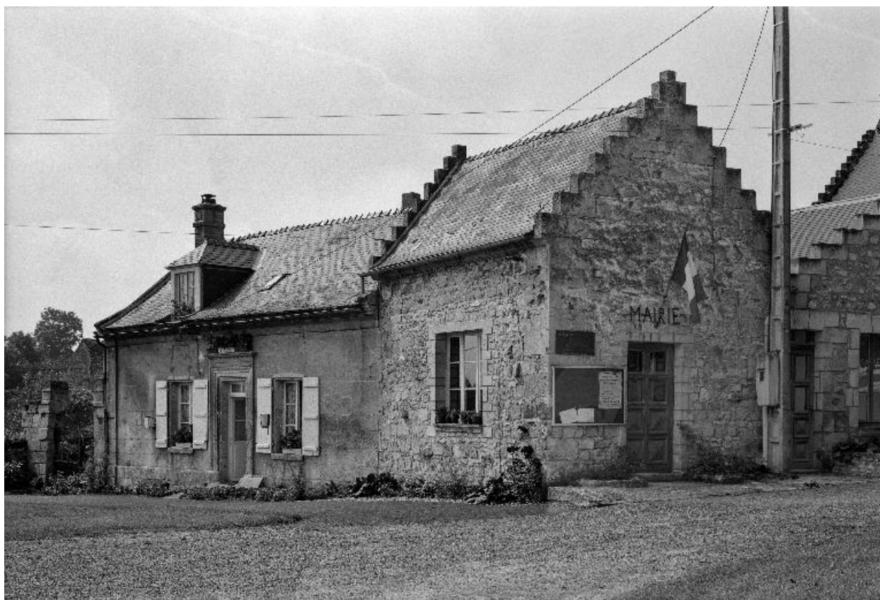
Vue de la mairie actuelle, depuis le nord.