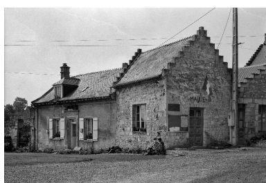
Vue de la mairie actuelle, depuis le nord. IVR22_19880200696X