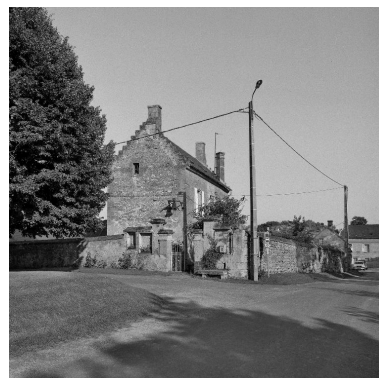
Vue générale de l'ancienne mairie-école, depuis le nord-ouest. IVR22_19880200935X