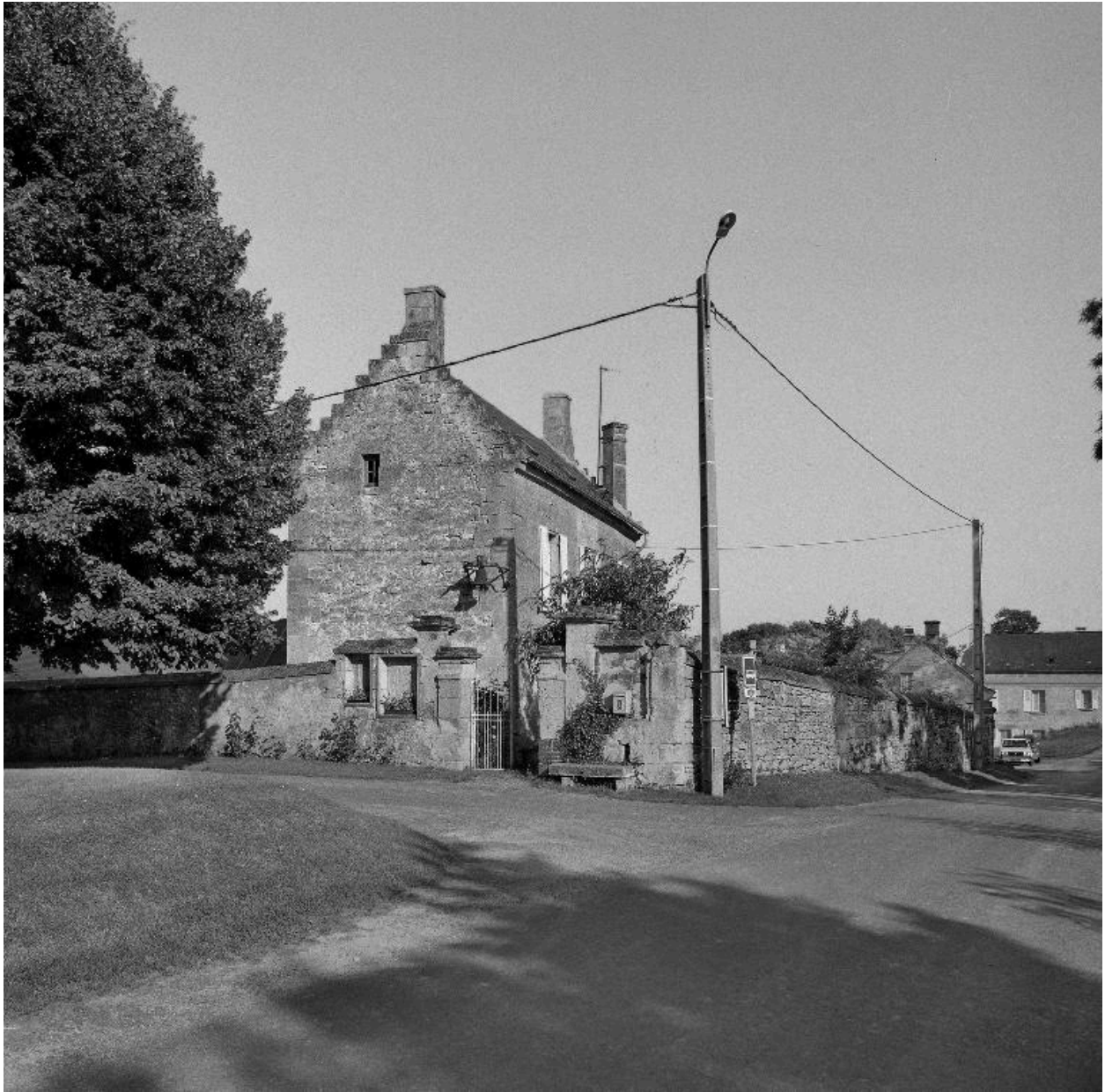
Vue générale de l'ancienne mairie-école, depuis le nord-ouest.