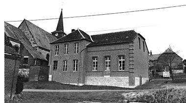
Elévation postérieure de la mairie-école. IVR22_19980200789Z