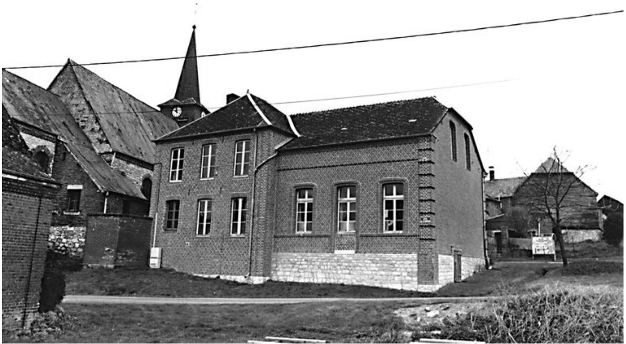
Elévation postérieure de la mairie-école.