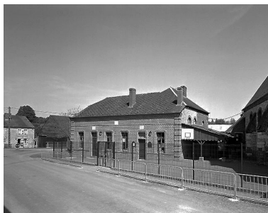
Vue générale depuis le sud-ouest. IVR22_20010201710V

IVR22_20080290102NUCA