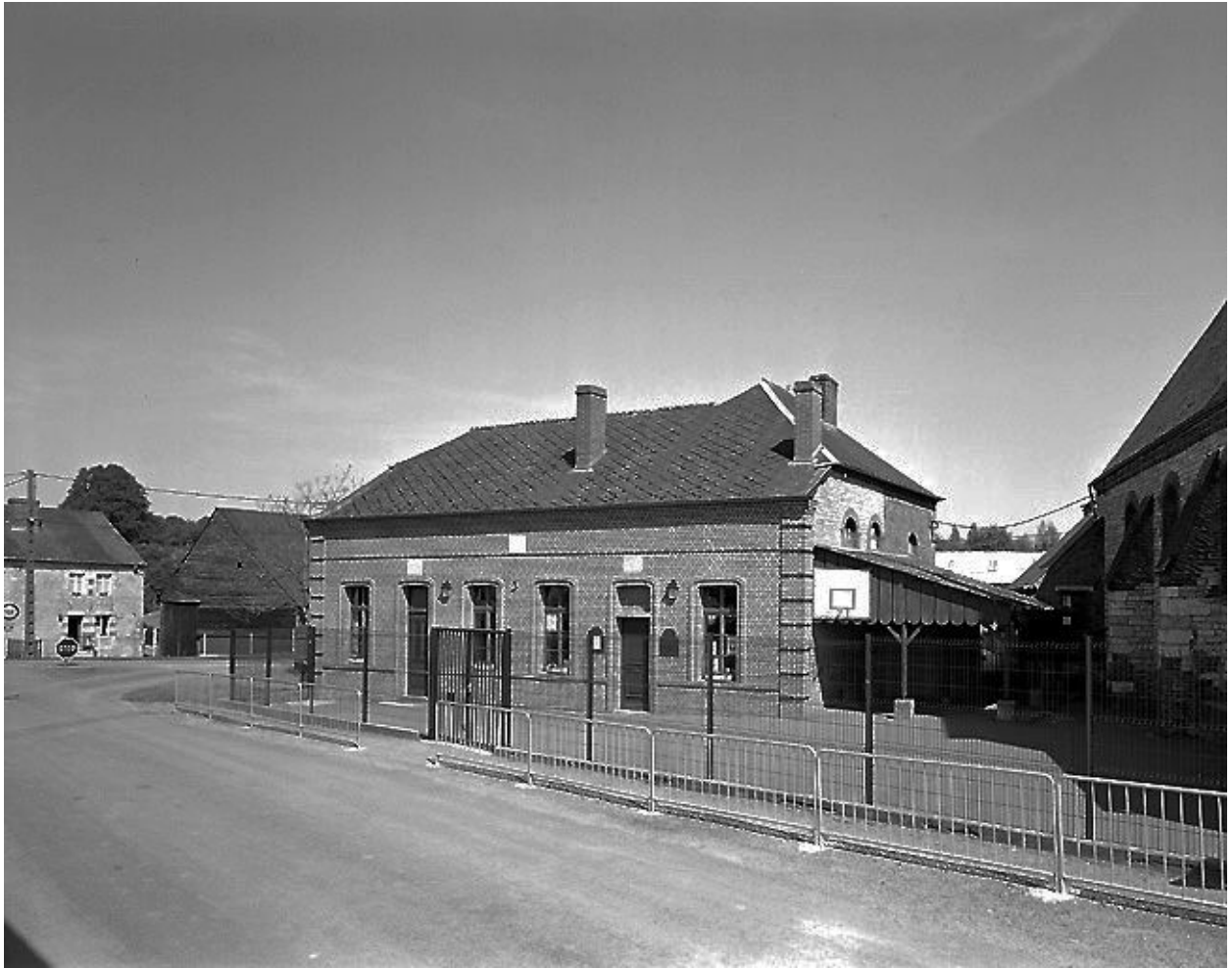
Vue générale depuis le sud-ouest.