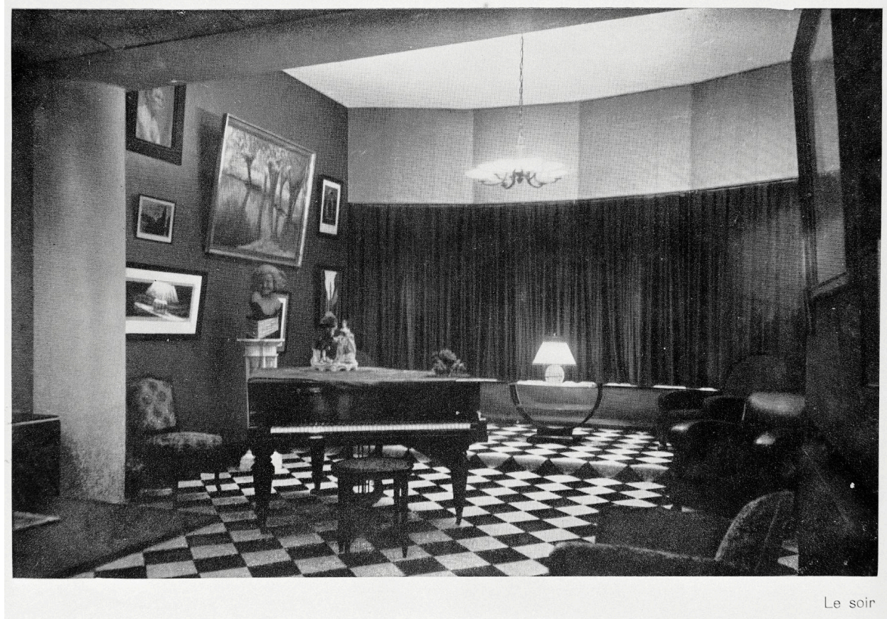
Vue de la salle de musique le soir, vers 1930, Danis architecte, in Travaux d'Architecture (AP Dieux).