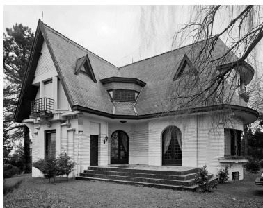
Elévation occidentale.