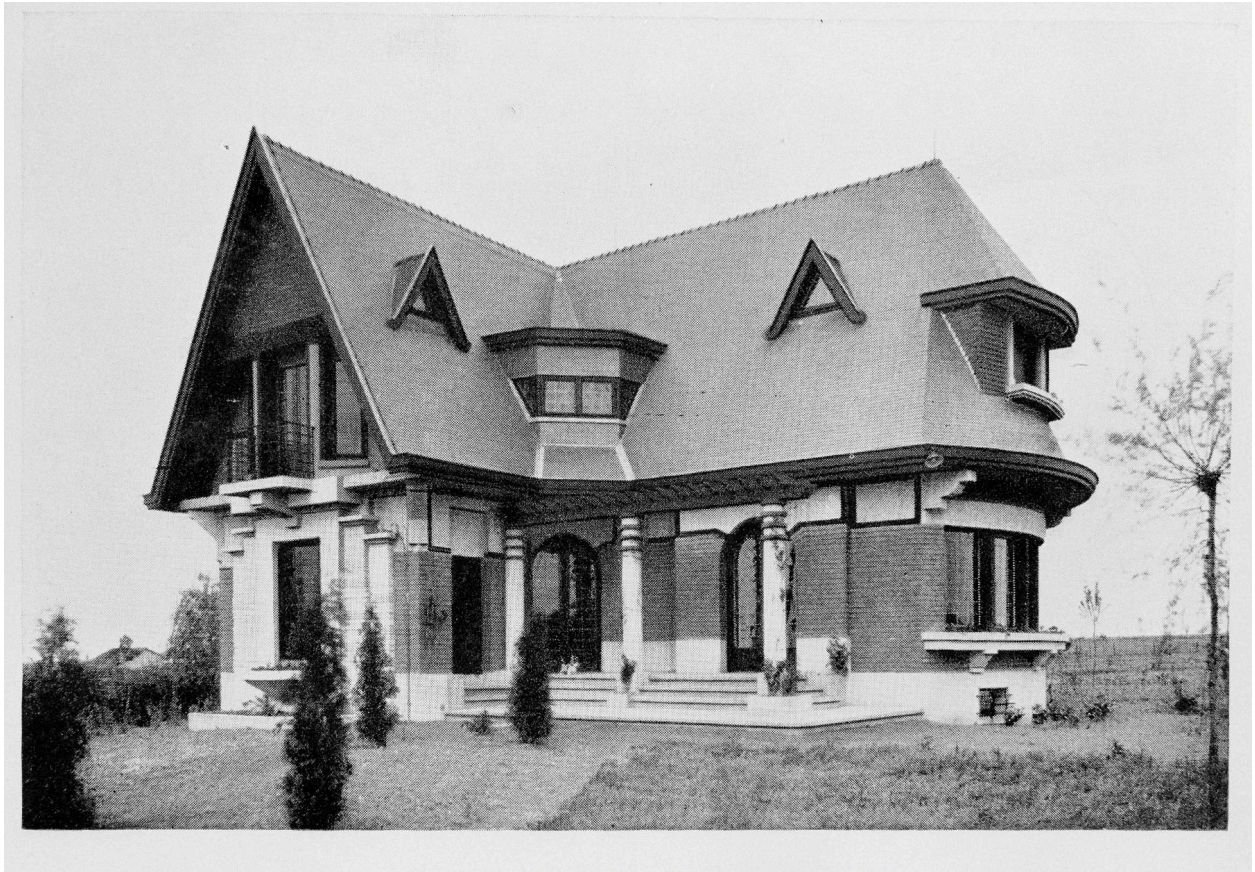
Vue vers l'est vers 1930, Danis architecte, in Travaux d'Architecture (AP Dieux).