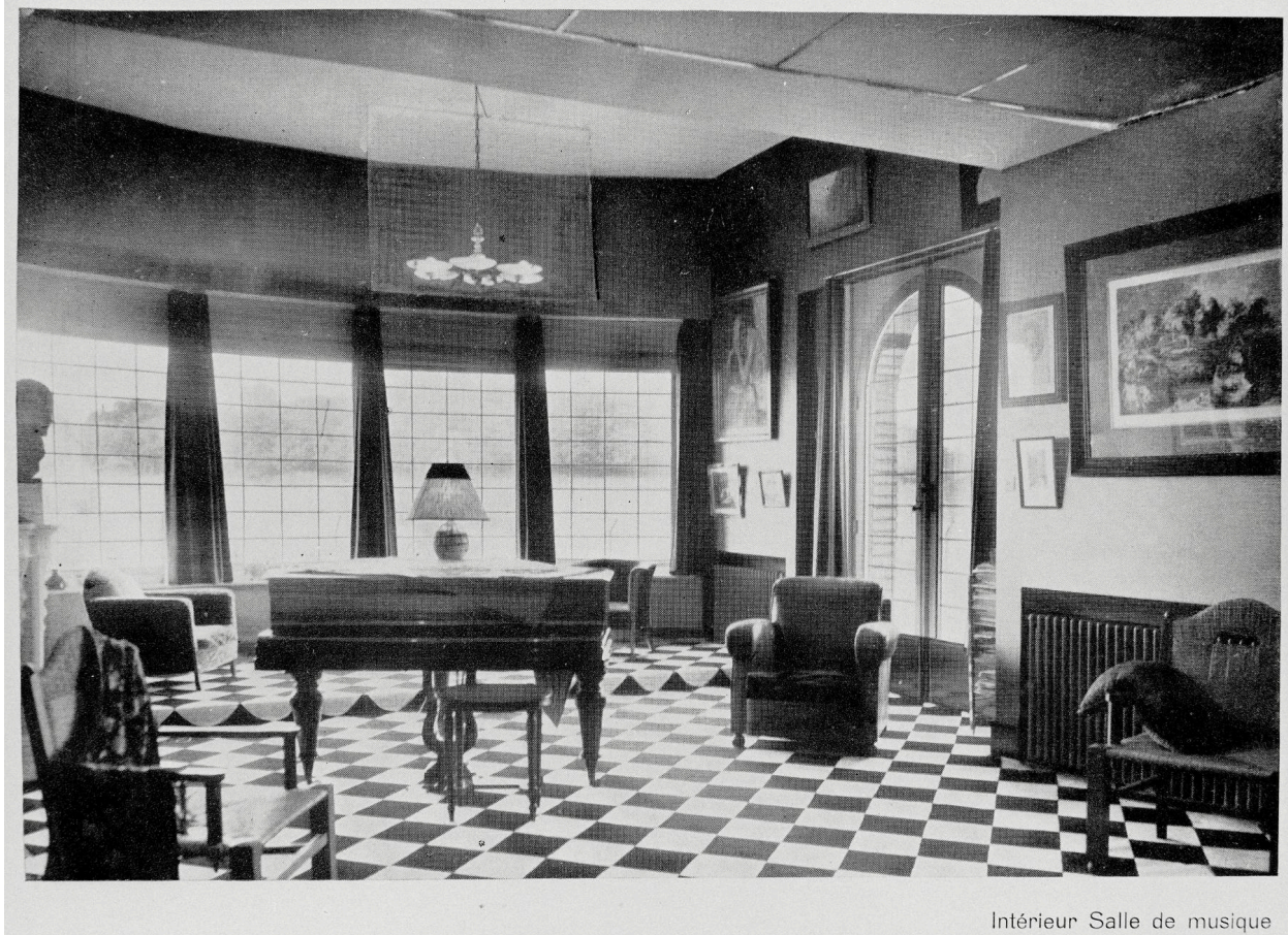
Intérieur Salle de musique

Vue de la salle de musique, vers 1930, Danis architecte, in Travaux d'Architecture (AP Dieux).