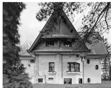
Elévation nord. IVR31_19935901922V