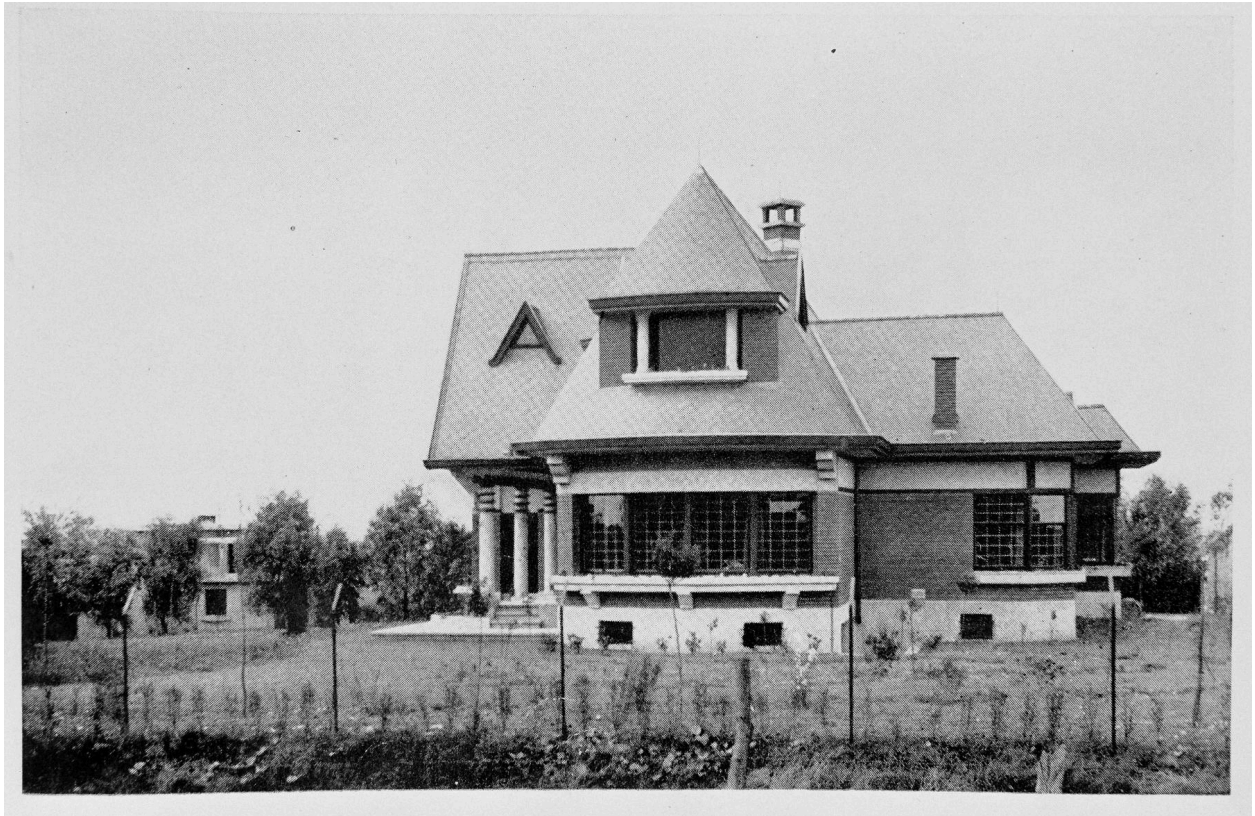
Vue vers le nord depuis la rue, vers 1930, Danis architecte, in Travaux d'Architecture (AP Dieux).