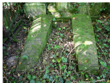
Tombeaux en forme de sarcophage, de forme trapézoïdale. IVR22_20098001267NUCA