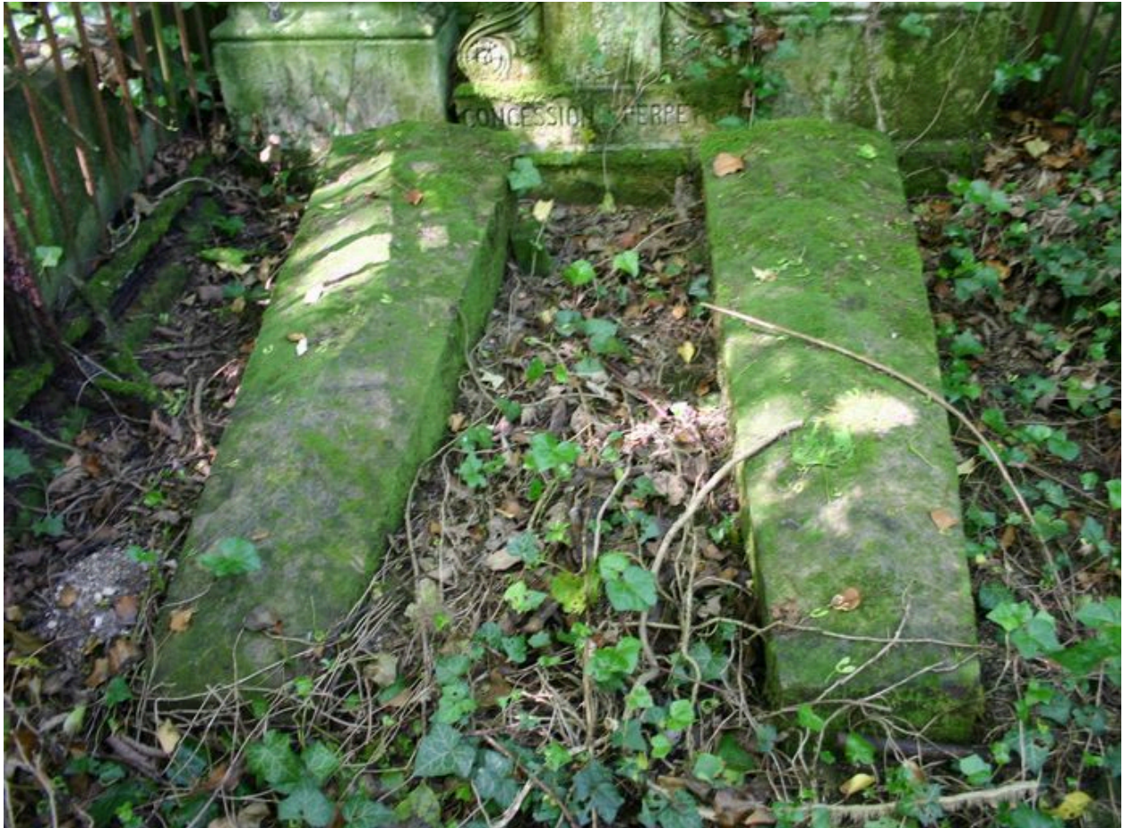
Tombeaux en forme de sarcophage, de forme trapézoïdale.