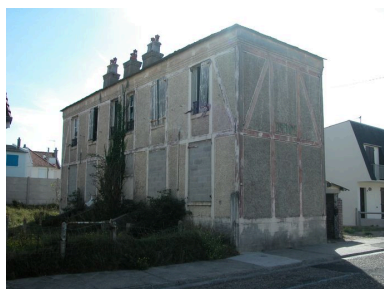
Vue d'ensemble. IVR22_20058003798NUCA