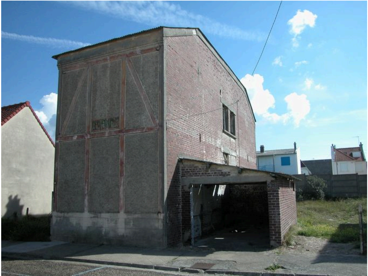
Elévation postérieure et garage accolé.