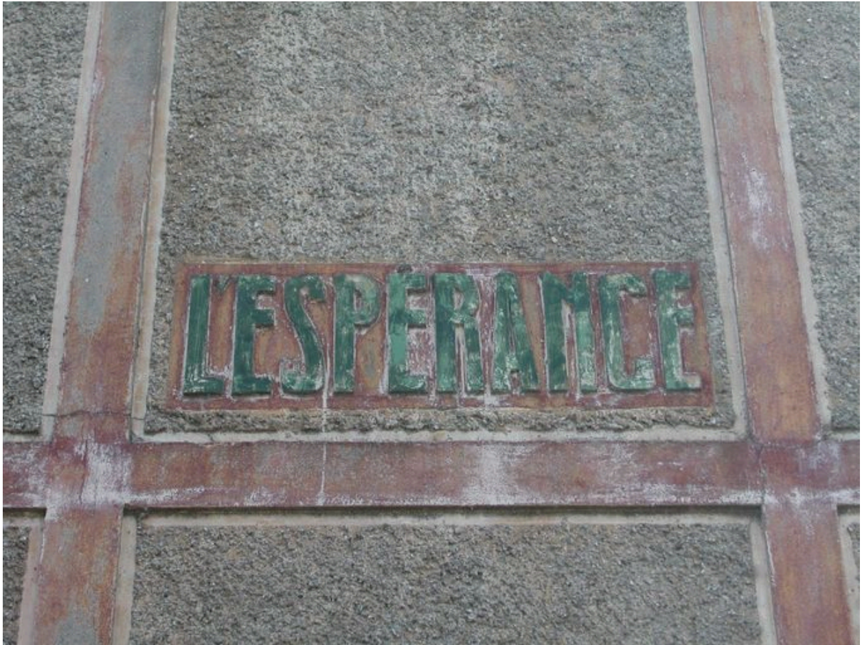
Détail de l'appellation portée sur la façade sur rue.