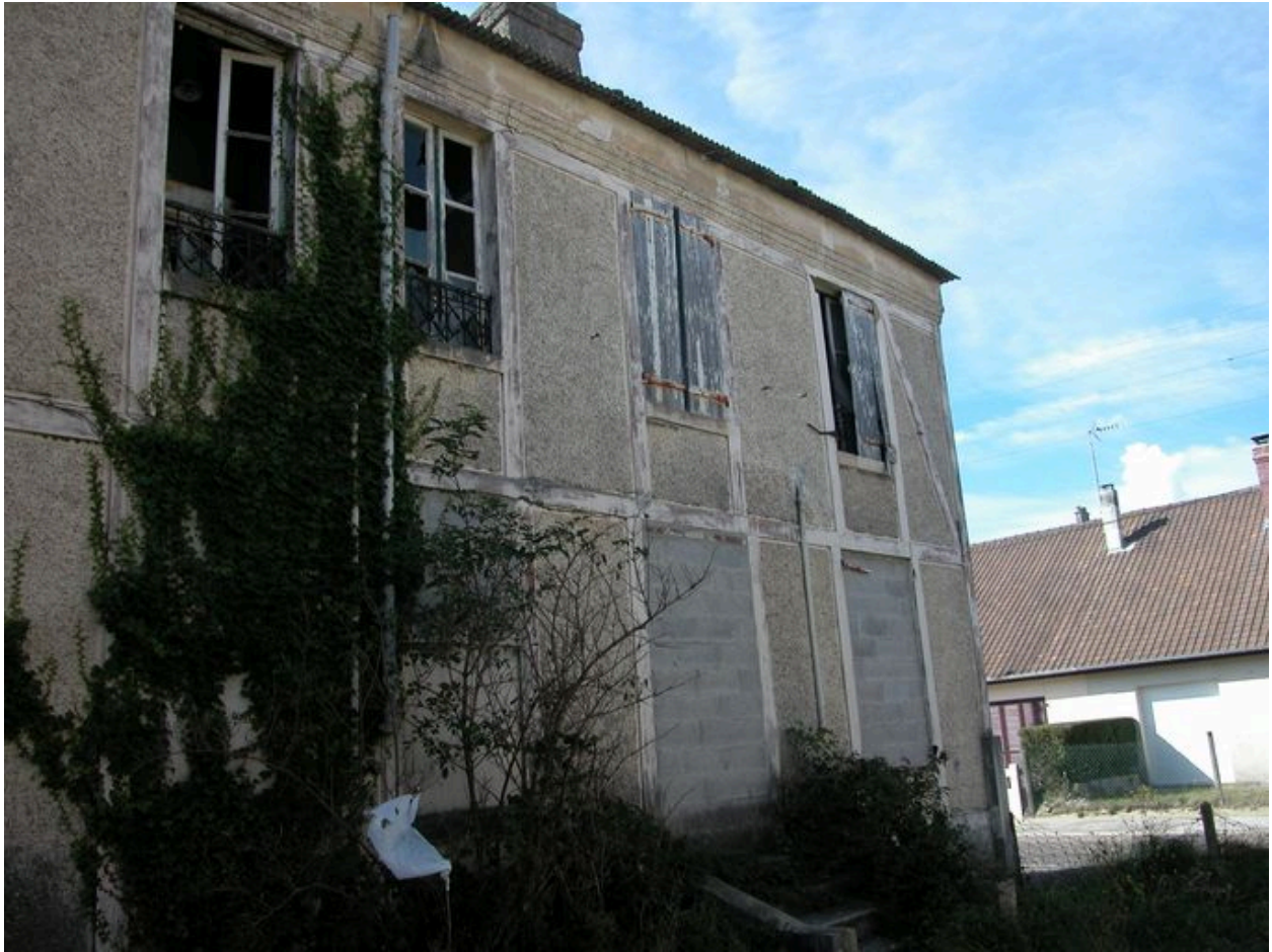
Détail d'un des deux logements, état actuel.