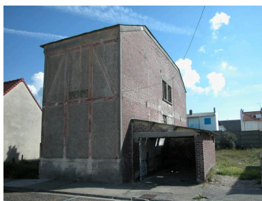
Élévation postérieure et garage accolé. IVR22_20058003799NUCA