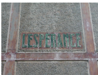
Détail de l'appellation portée sur la façade sur rue. IVR22_20058003802NUCA