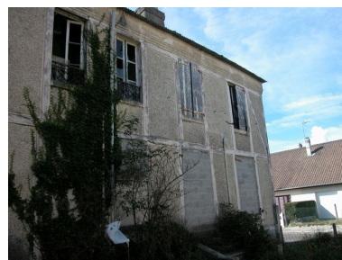
Détail d'un des deux logements, état actuel.