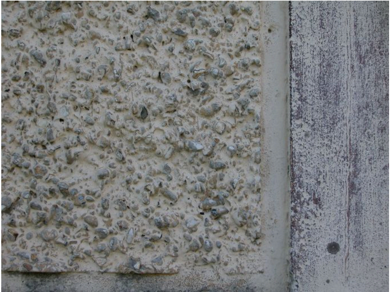
Détail du traitement du parement, rognons de silex et faux pans de bois.