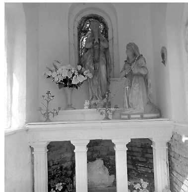
Vue intérieure. IVR22_20010201742X