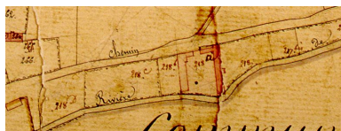
Extrait du cadastre napoléonien présentant le plan de la ferme en 1828.

IVR22_20078005447XAB