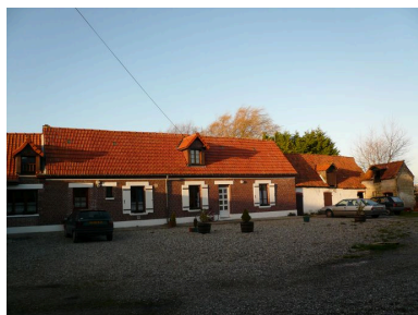
Vue du logis depuis la cour.