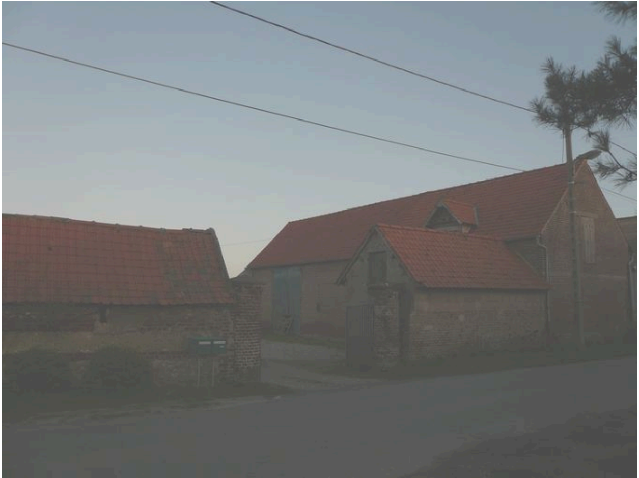
Entrée de la propriété.