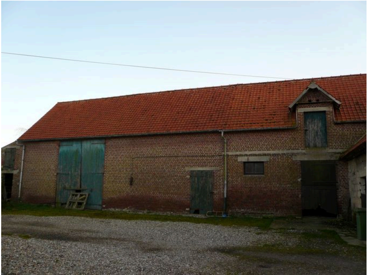
Vue de la grange.