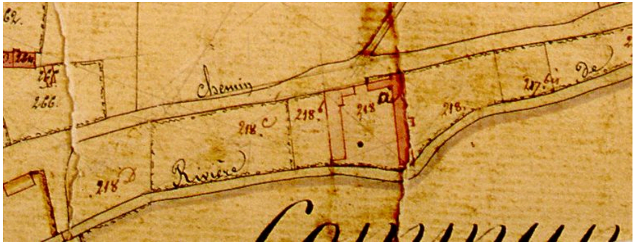
Extrait du cadastre napoléonien présentant le plan de la ferme en 1828.