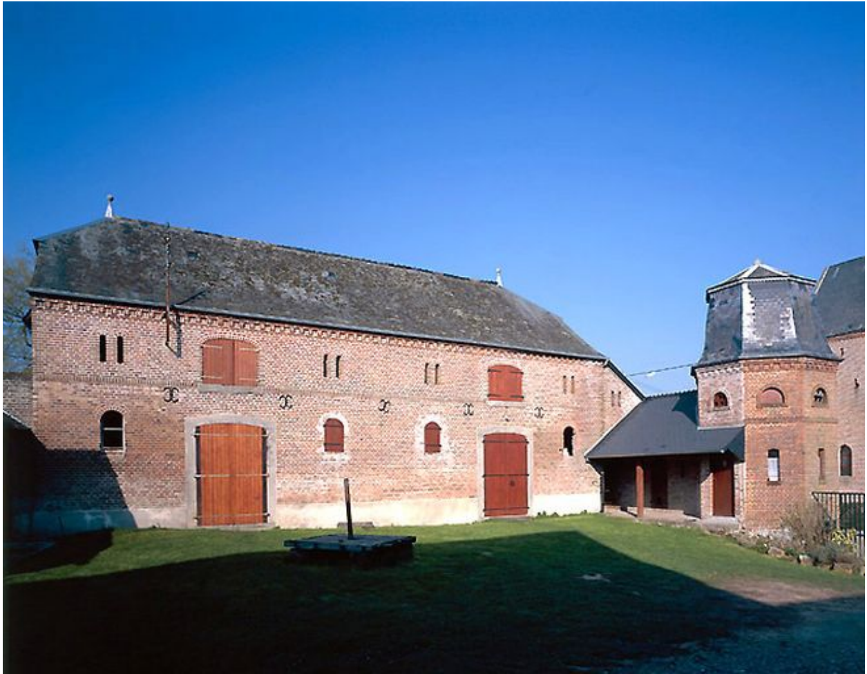
Etable et pigeonnier attenants à la porcherie.