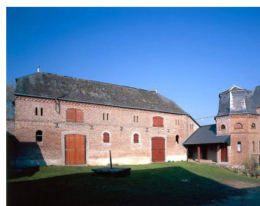
Etable et pigeonnier attenants à la porcherie.