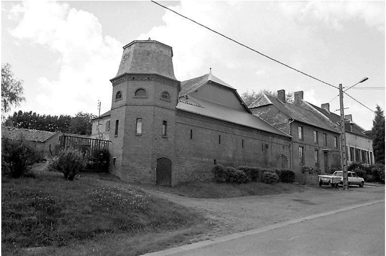
Vue générale depuis la rue.