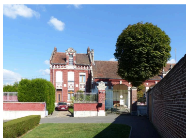
Vue générale depuis le sud. IVR32_20168006192NUCA