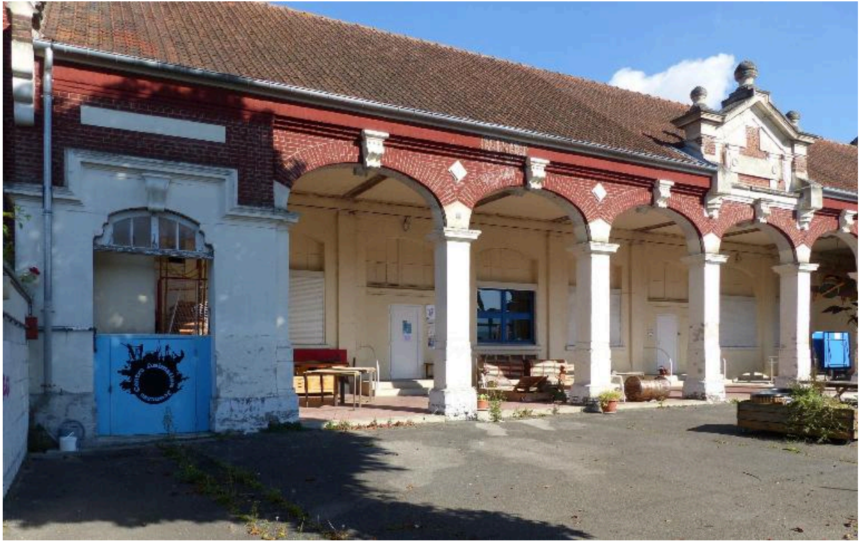
La cour et l'ancienne école.