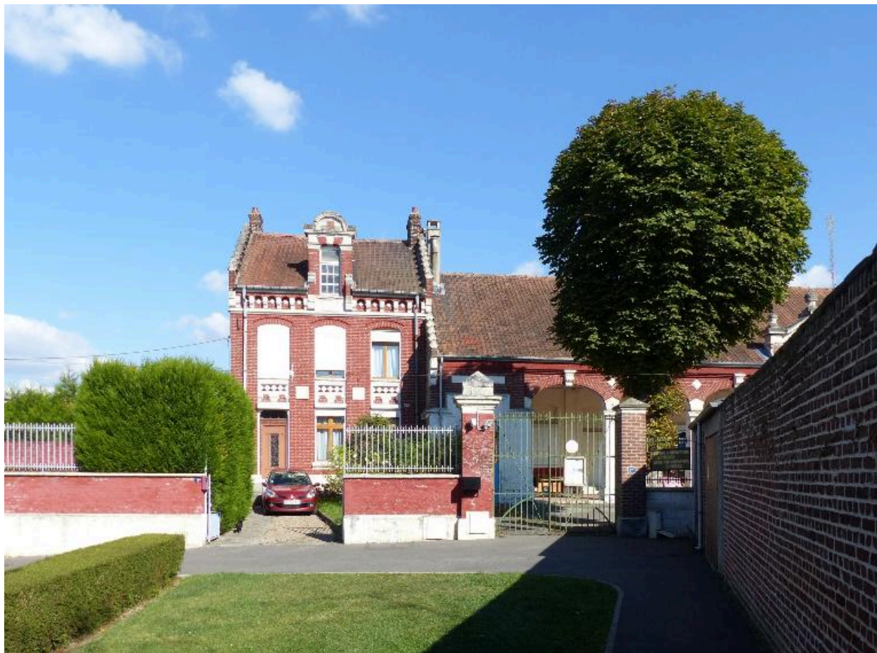
Vue générale depuis le sud.