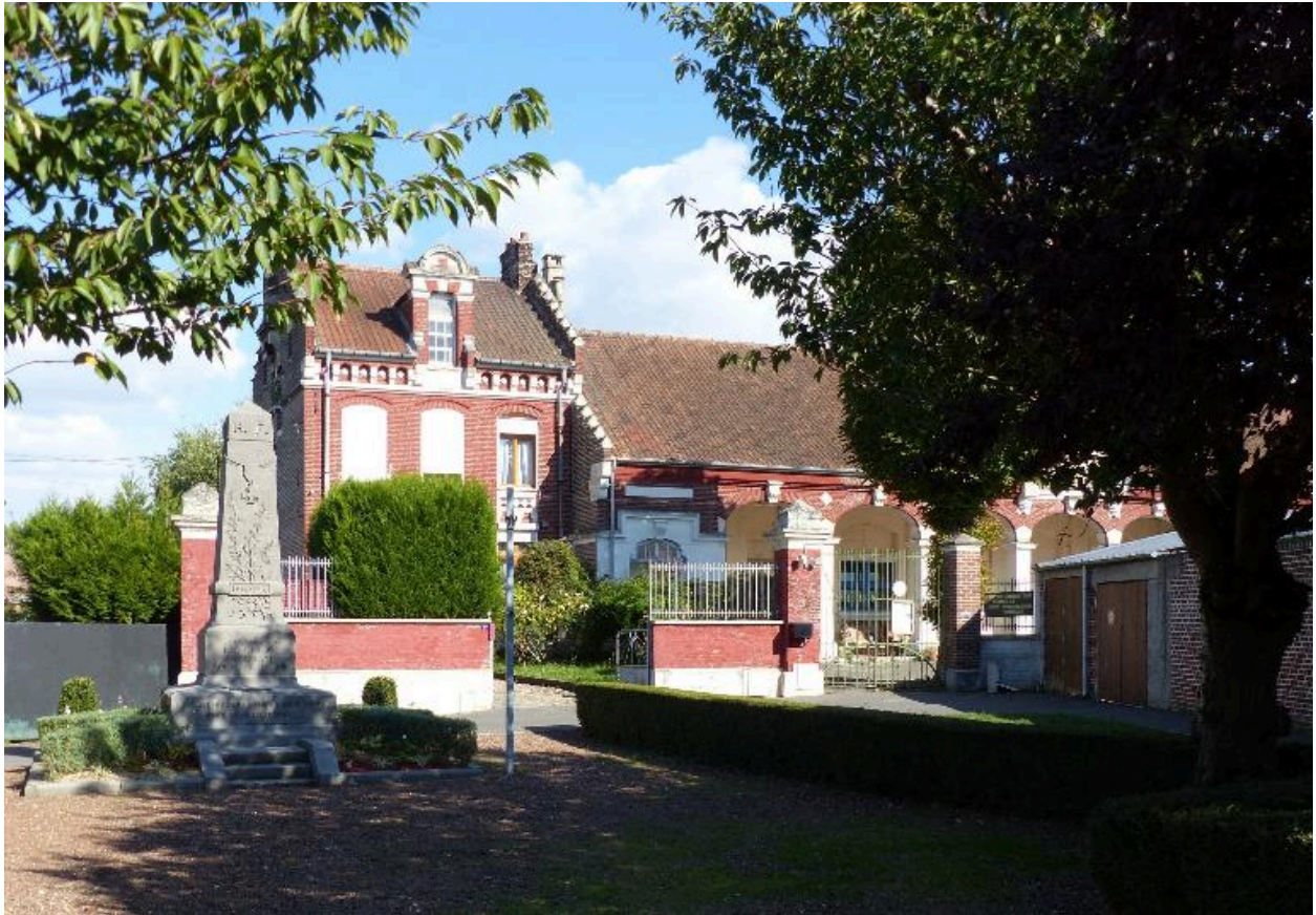
Vue de situation, depuis le sud.