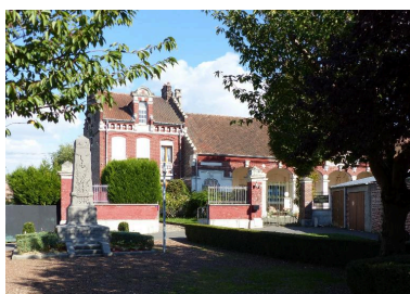
Vue de situation, depuis le sud. IVR32_20168006193NUCA