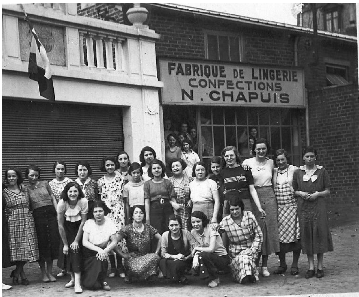
Vue de situation avec les ateliers de confection Chapuis à l'arrière plan. Photographie vers 1950.