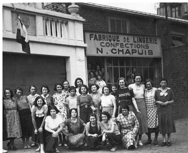
Vue de situation avec les ateliers de confection Chapuis à l'arrière plan. Photographie vers 1950. IVR32_20196200964NUC1A