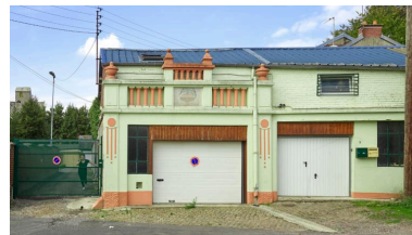
Vue de la façade. IVR32_20196200520NUC4A