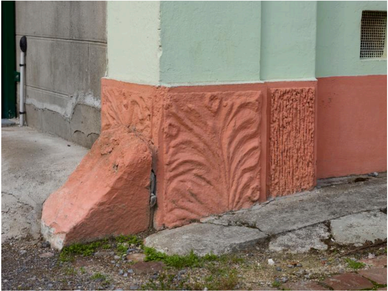
Détail du décor du bas du pilastre.