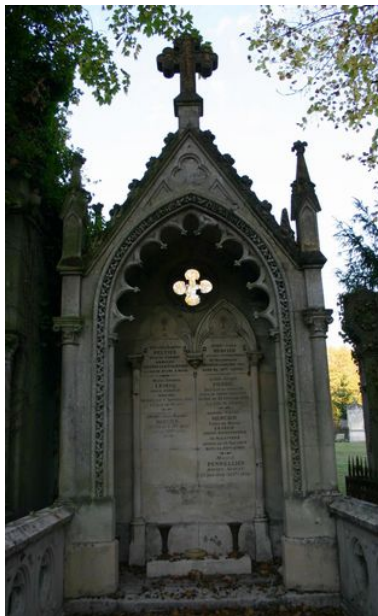
Tombeau en forme de niche monumentale, de style néogothique.