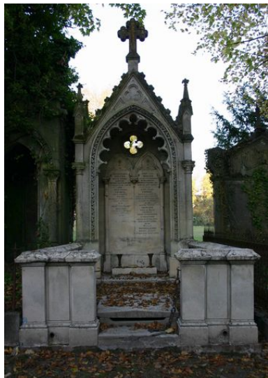
Vue générale. IVR22_20098001487NUCA