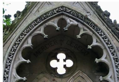
Détail du décor sculpté de l'arcade.