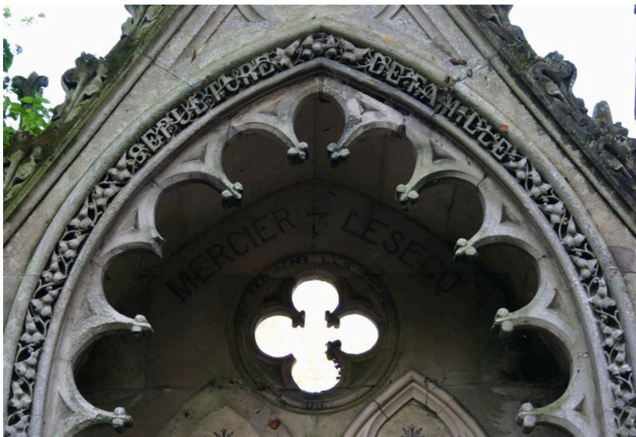
Détail du décor sculpté de l'arcade.