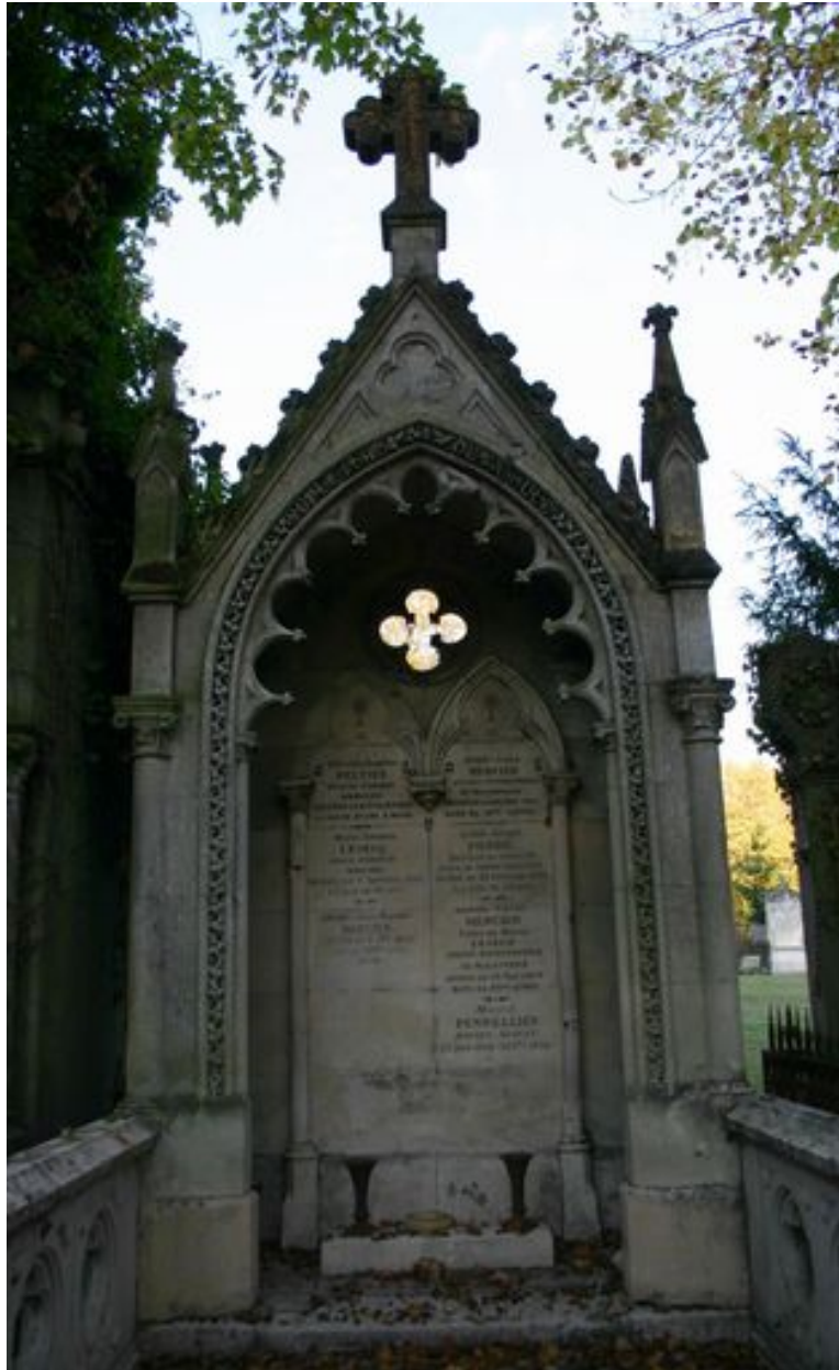
Tombeau en forme de niche monumentale, de style néogothique.