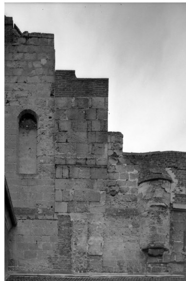
Détail pignon droit. IVR22_19856001371X