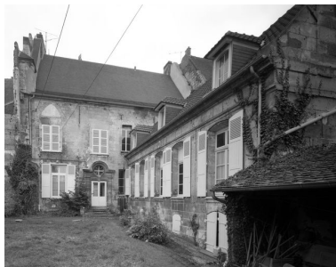
Élévation postérieure. IVR22_19856001420V