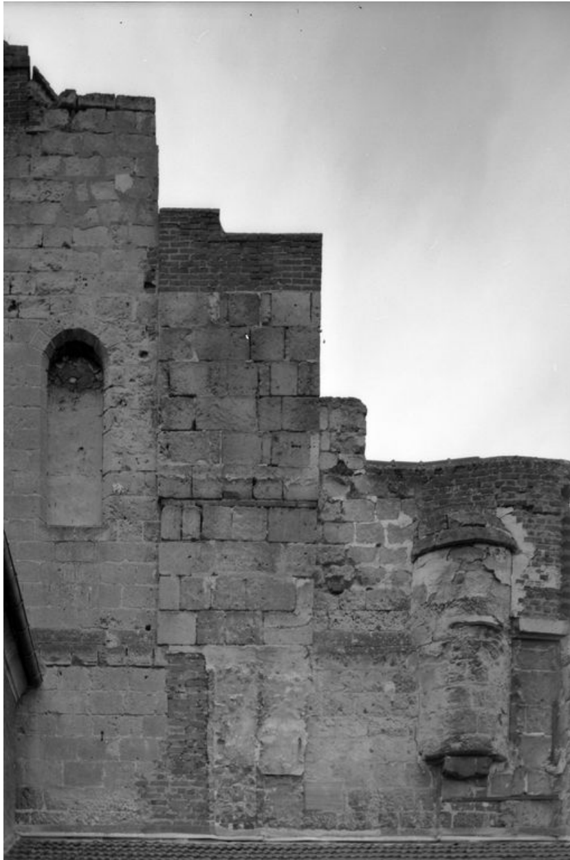
Détail pignon droit.