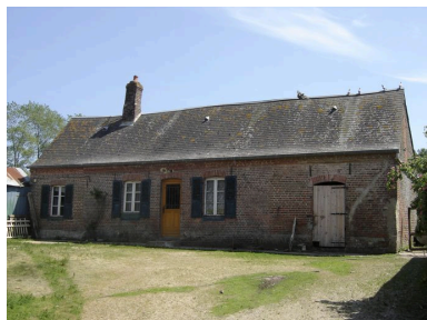
Vue du logis et de l'écurie dans son prolongement. IVR22_20058006035NUCA