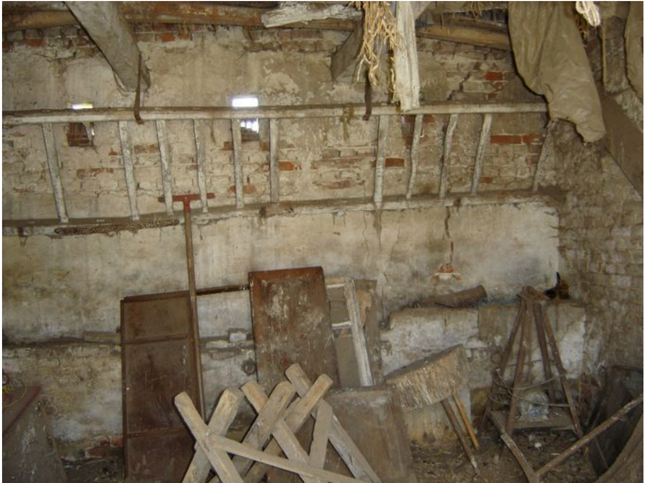
Vue intérieure de l'écurie.