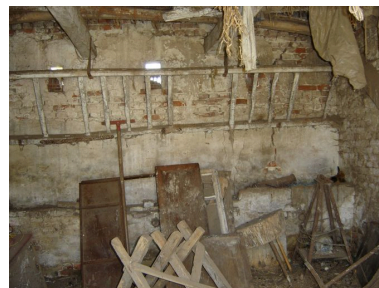
Vue intérieure de l'écurie.