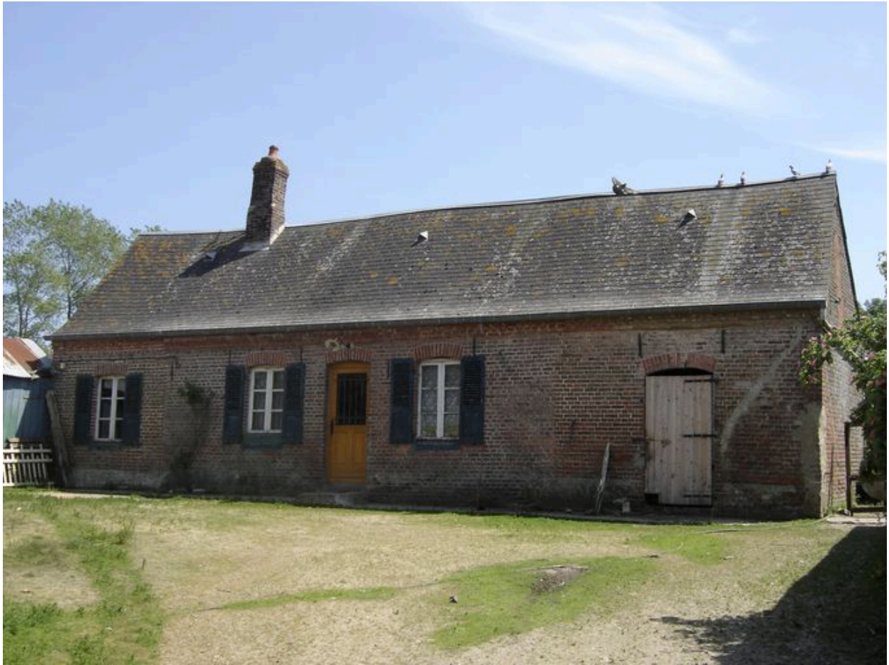
Vue du logis et de l'écurie dans son prolongement.