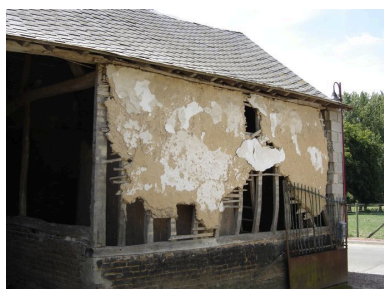
Vue de la grange depuis la cour. IVR22_20058006038NUCA