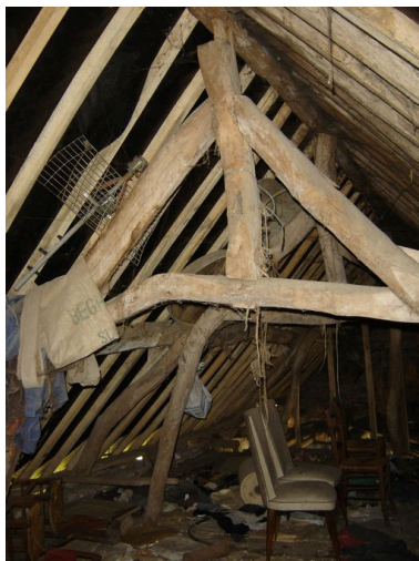
Vue d'une ferme de la charpente du logis. IVR22_20058006036NUCA