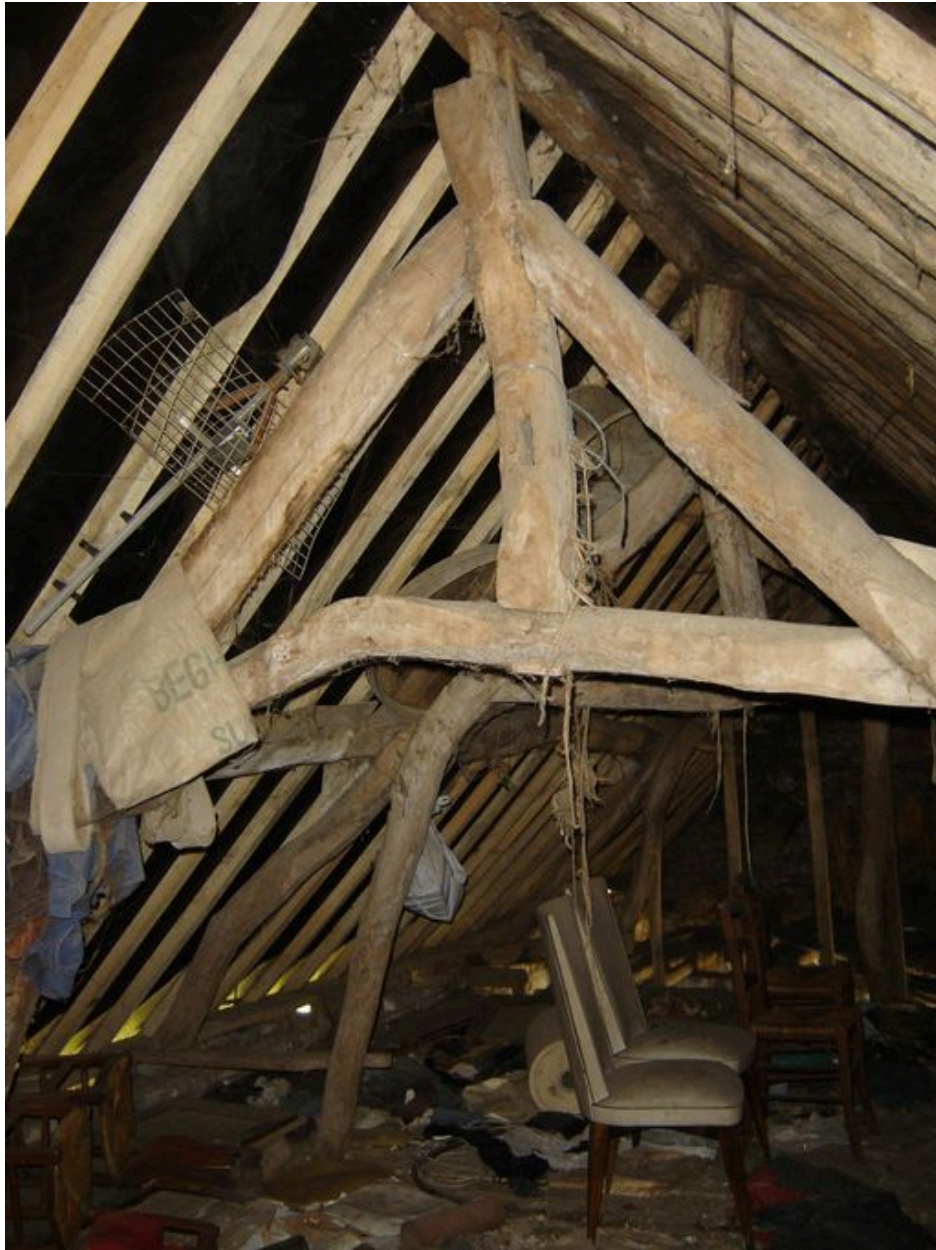
Vue d'une ferme de la charpente du logis.