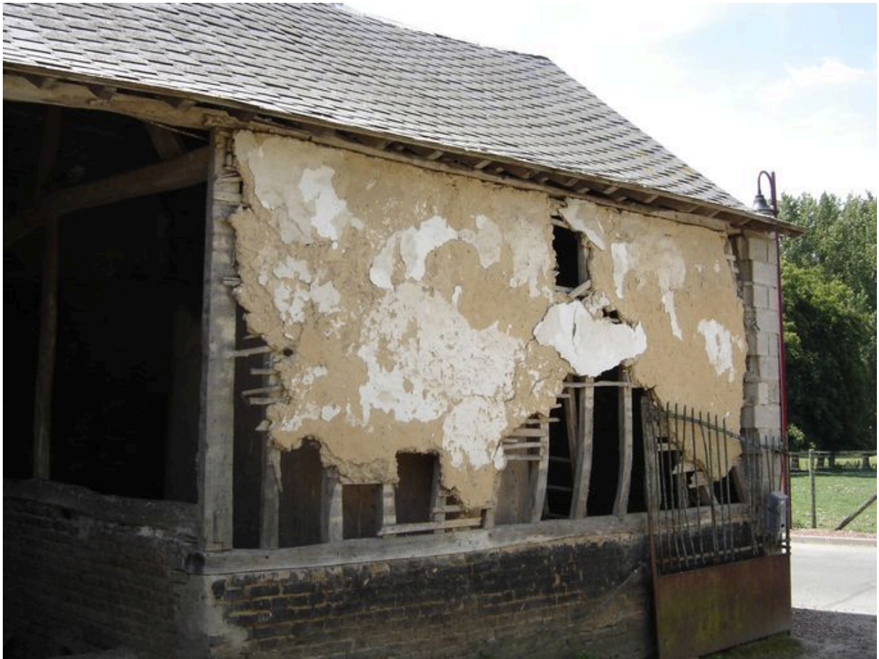
Vue de la grange depuis la cour.