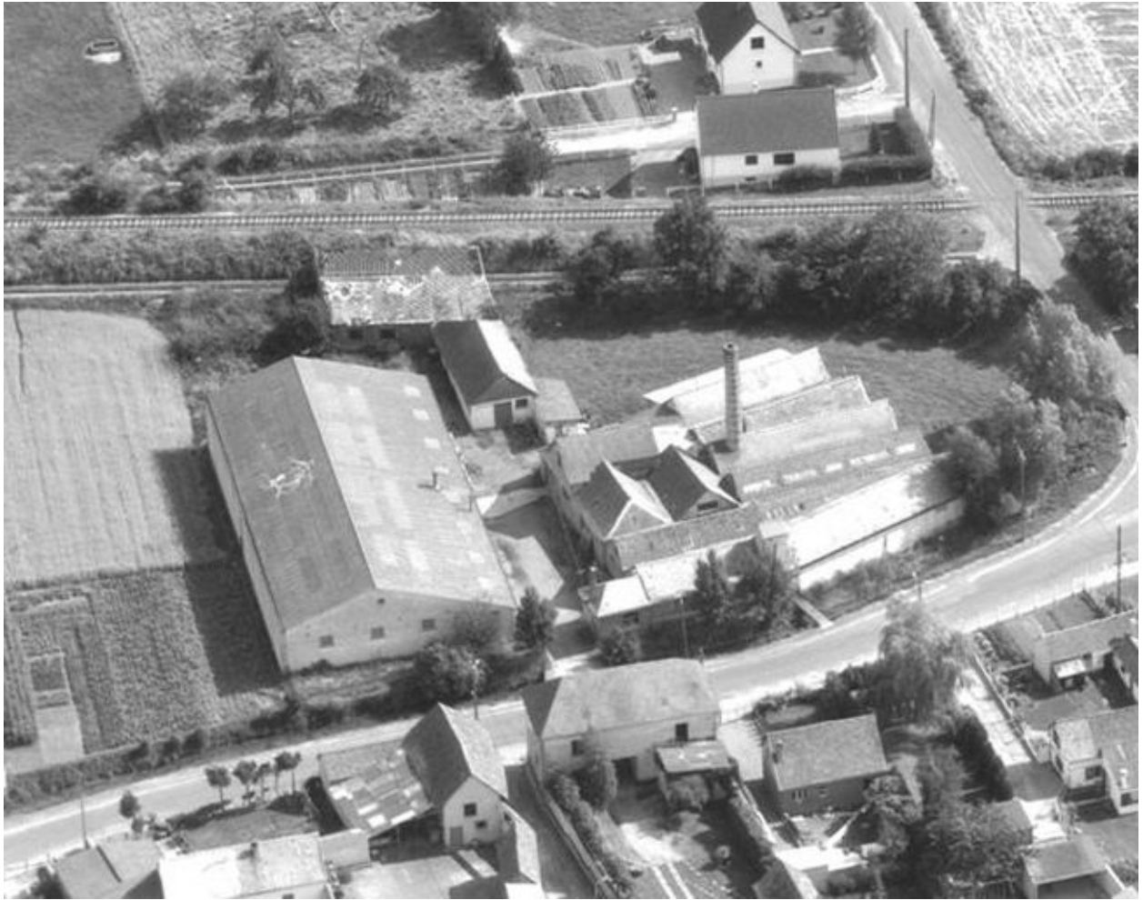
Vue aérienne, flanc nord.