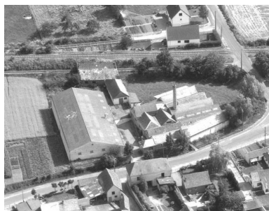
Vue aérienne, flanc nord. IVR22_19888001378P