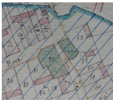
Extrait du cadastre napoléonien (DGI). IVR22_20038010915NUCA