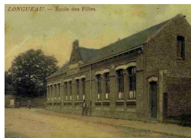
L'ancienne école de fille de Longueau. Carte postale, début 20e siècle (coll. part.).