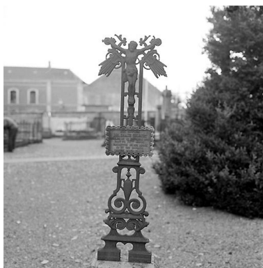
Détail d'une croix en fonte.