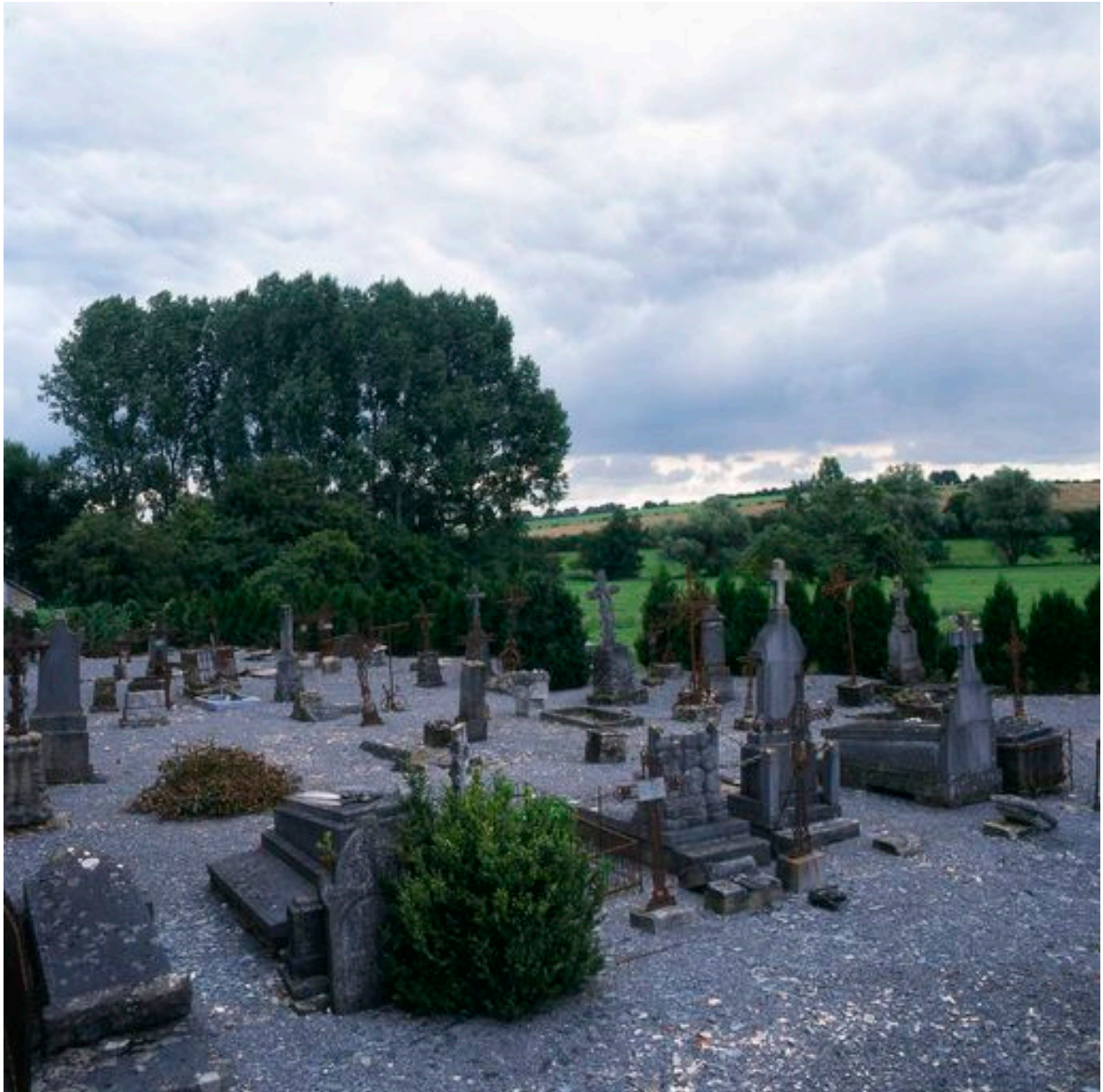
Vue d'ensemble du côté sud du cimetière.