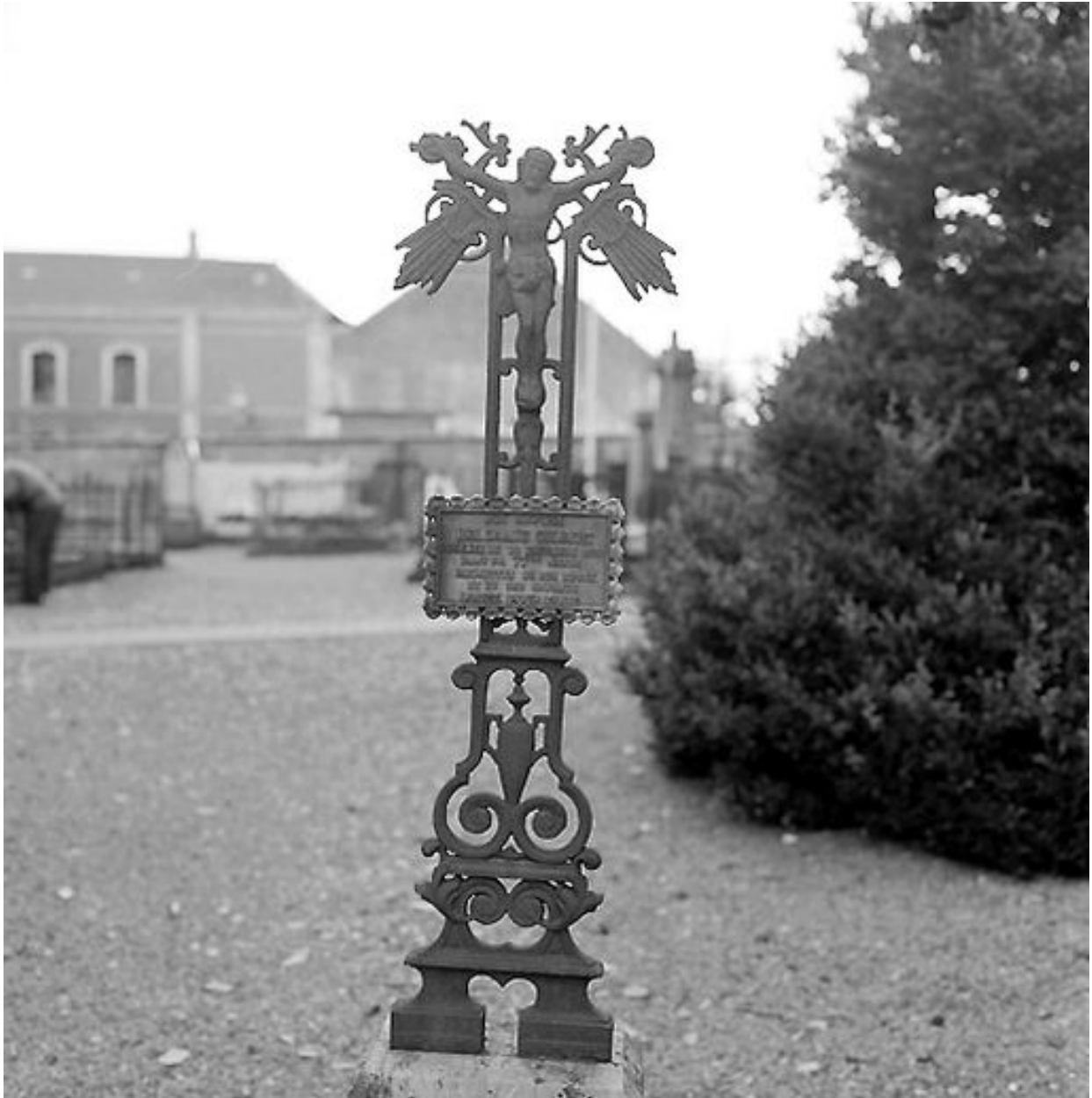
Détail d'une croix en fonte.