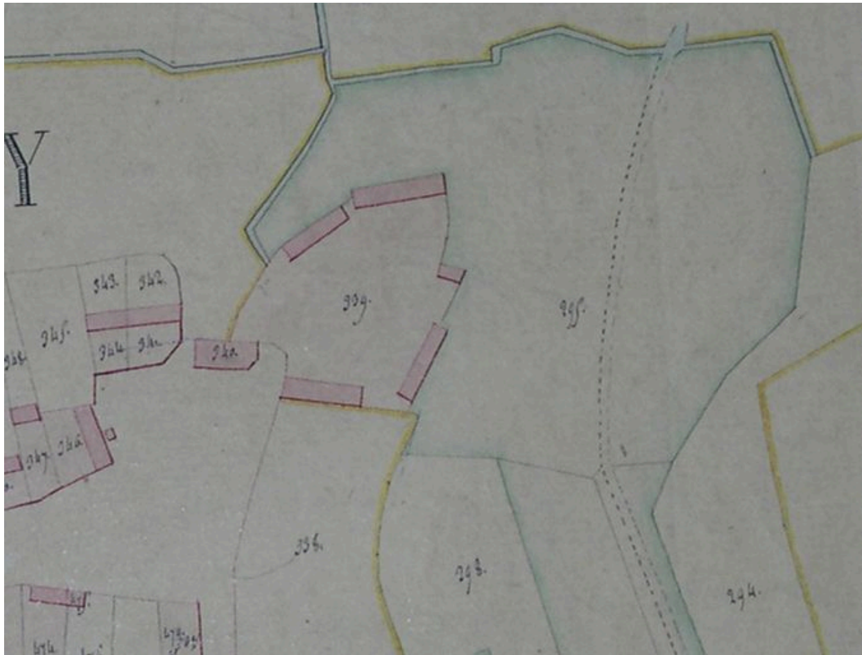
Extrait du cadastre napoléonien de 1809 (DGI).