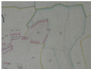
Extrait du cadastre napoléonien de 1809 (DGI). IVR22_20048010366NUCA