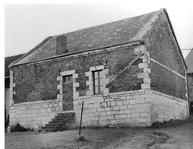
Elévation postérieure du logis.