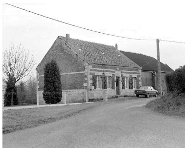
Elévation antérieure du logis. IVR22_19970202204X