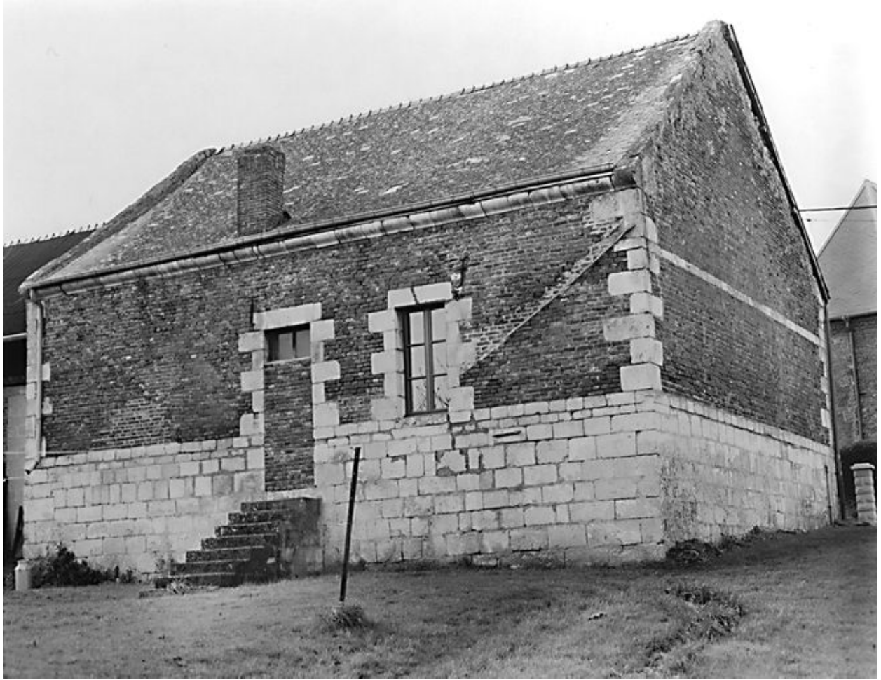
Elévation postérieure du logis.