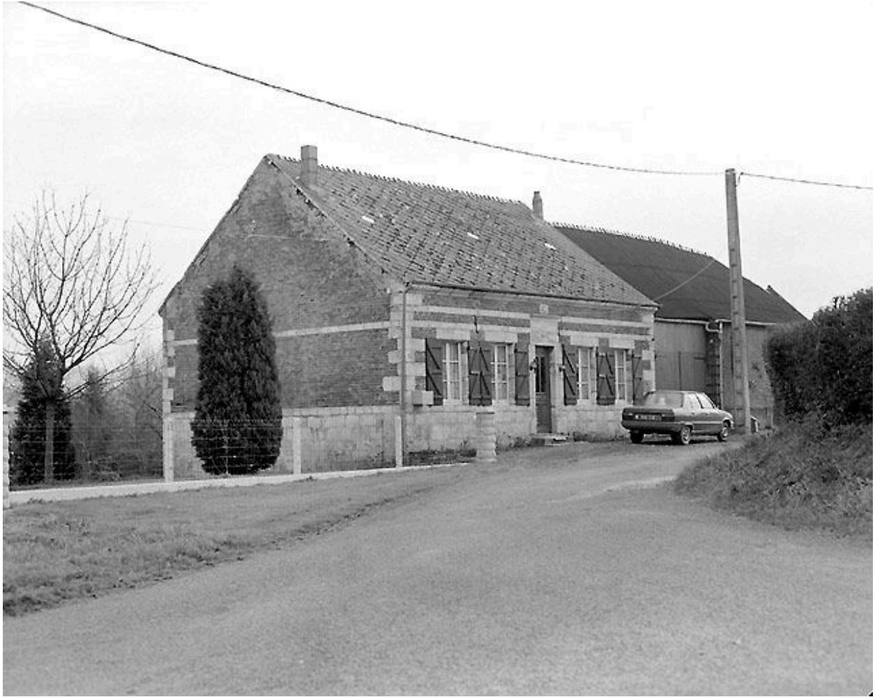
Elévation antérieure du logis.