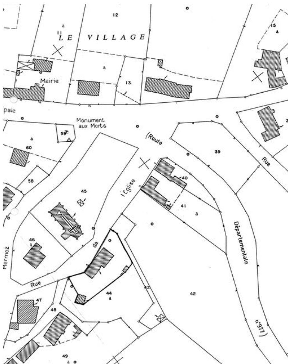
Plan de situation. Extrait du plan cadastral de 1994, section ZA.